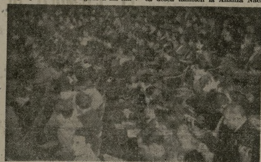
Los delegados al Pleno escuchan las intervenciones de ayer

años. Las Casas de la Juventud Campesina de Cuenca poseen mesas de billar, clases de cultura, equipos de fútbol, porque nos hemos ligado a las ma-