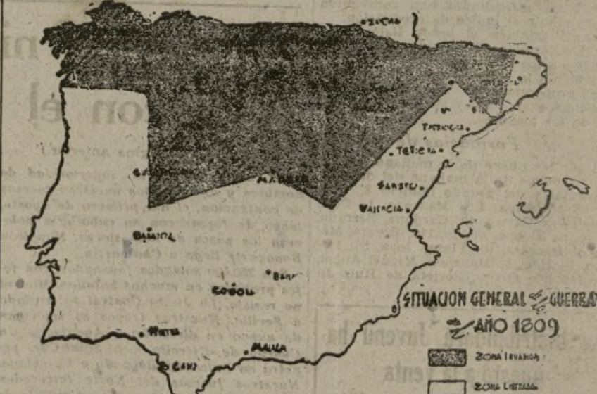
SITUACION GENERAL DE LA GUERRA EN 1809 La parte rayada del mapa es la zona invadida. La parte blanca pertenece a los territorios liberados.

Efectivamente, la situación apurada de los ejércitos invasores, que se habían replegado en la margen derecha del Ebro,