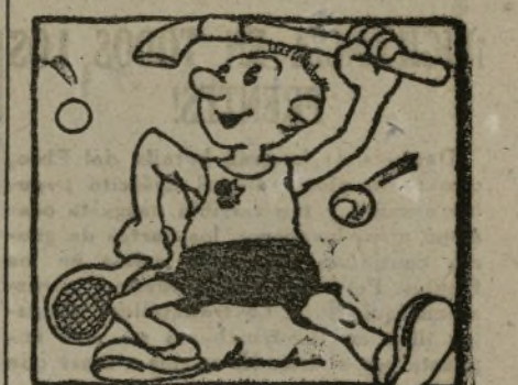
Paquito el espartaquista va a ser un gran deportista.