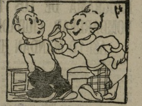
Paquito a un camarada dice que va a ser sonado.