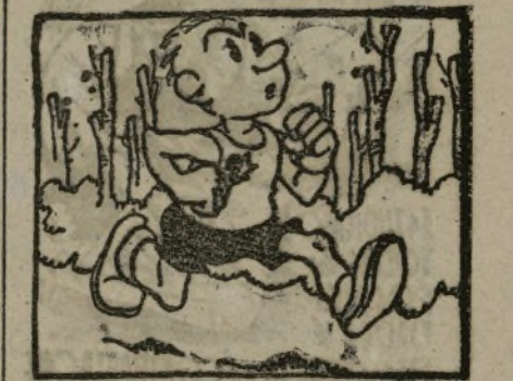
Y se entrena sin respiro para la vuelta al Retiro.