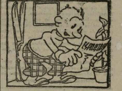
Esta prueba popular va "ESPARTACO" a organizar.