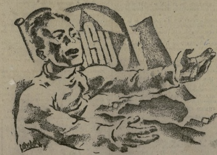
Jóvenes españoles: ¡La heroica juventud madrileña necesita viveres y combustible!