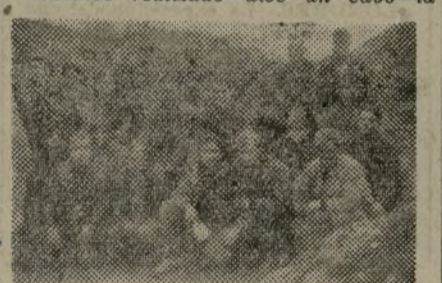
Un grupo de activistas de las trincheras de Madrid

tarea que se nos marcó de entivado, pero nos ha faltado madera; en cuanto la recibamos reforzaremos el trabajo, recuperando el tiempo perdido.