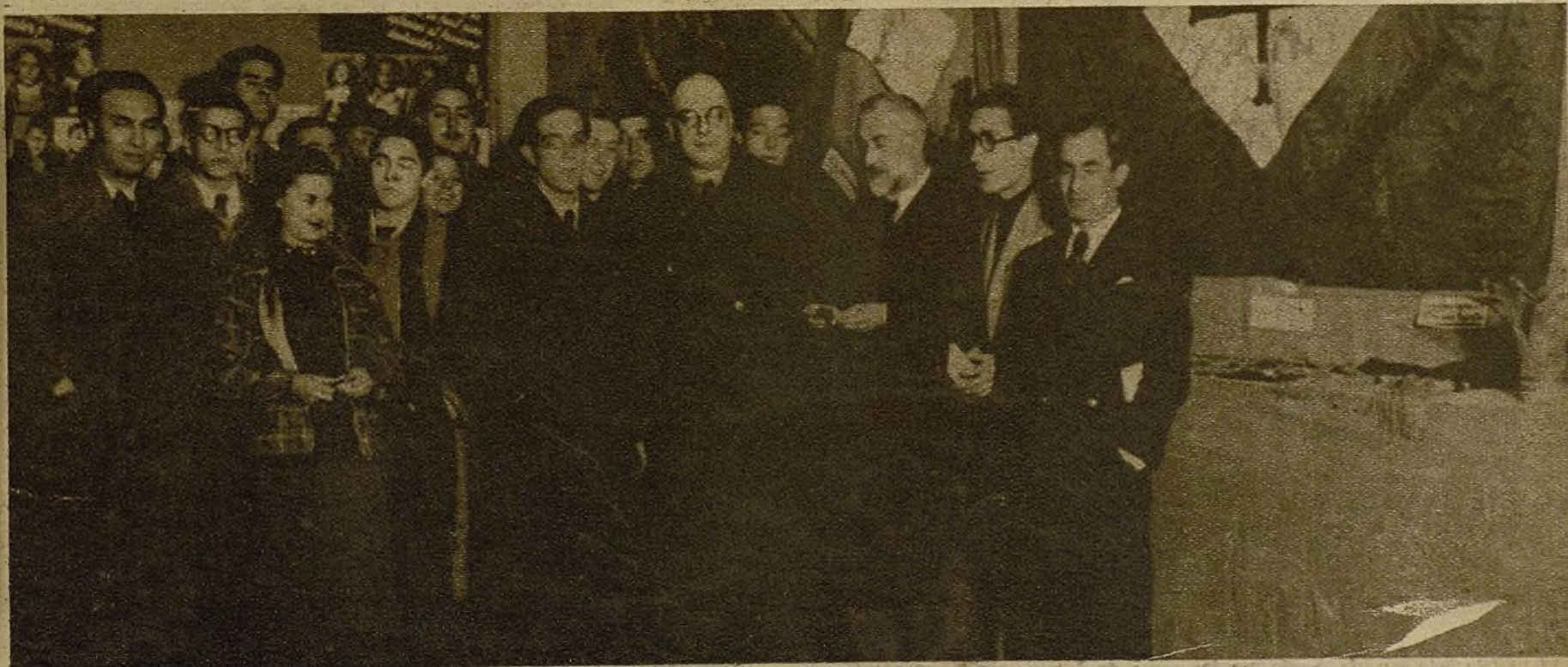
En Valencia se ha inaugurado la formidable Exposición de guerra organizada por "Altavoz del Frente", con la asistencia de los ministros de Instrucción Pública y Propaganda y representaciones de los organismos culturales y políticos