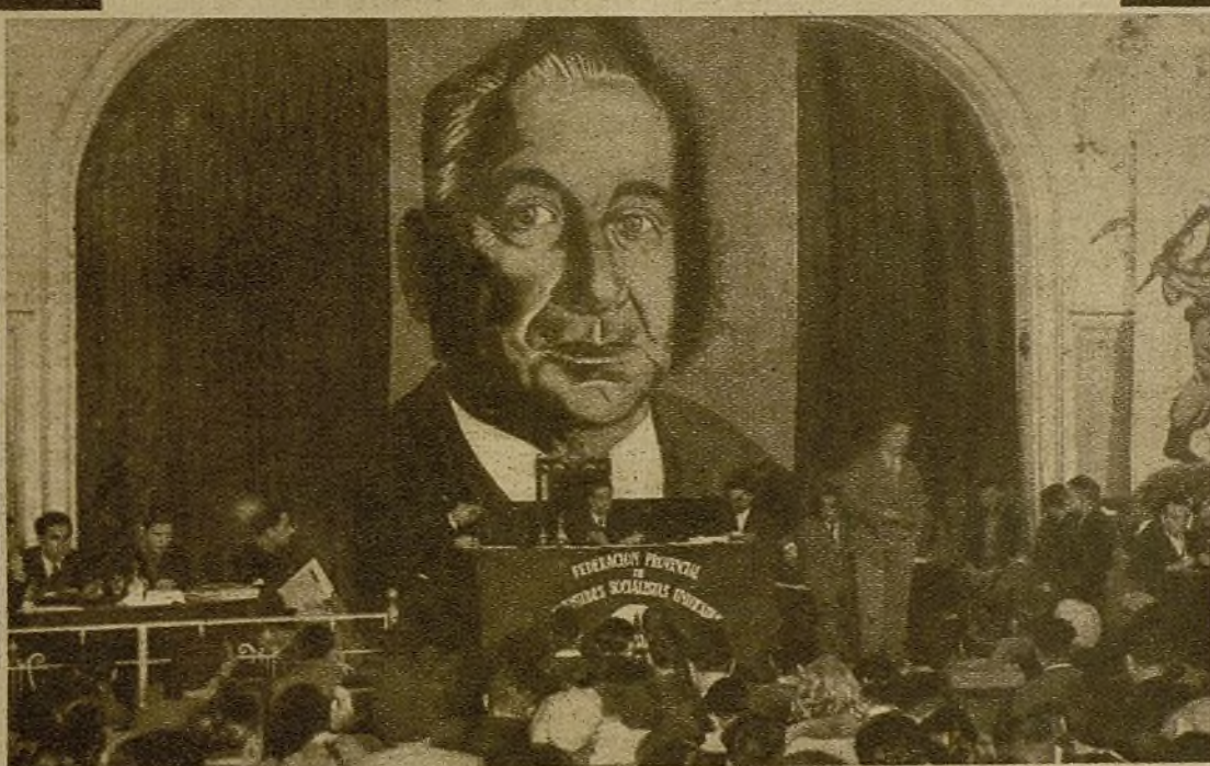
Una sesión del Congreso Provincial de las J. S. U. de Valencia. El gran interés que en las masas juveniles ha despertado este Congreso hace prever el enorme éxito que tendrá el gran Congreso Nacional de las J. S. U.

Hemos visto estos días, con motivo de las fiestas, demasiados niños y mujeres por las calles de Madrid. ¡La juventud combatiente exige su evacuación!