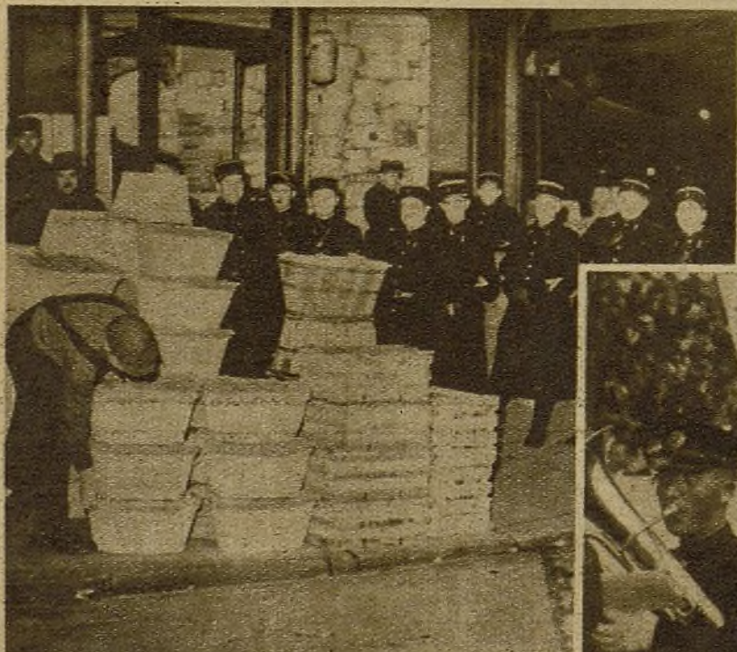
Huelga en el mercado parisino. Los trabajadores unen a las consignas de reivindicación las de solidaridad con el pueblo español. ¡Ese es el camino para salvar la democracia mundial!