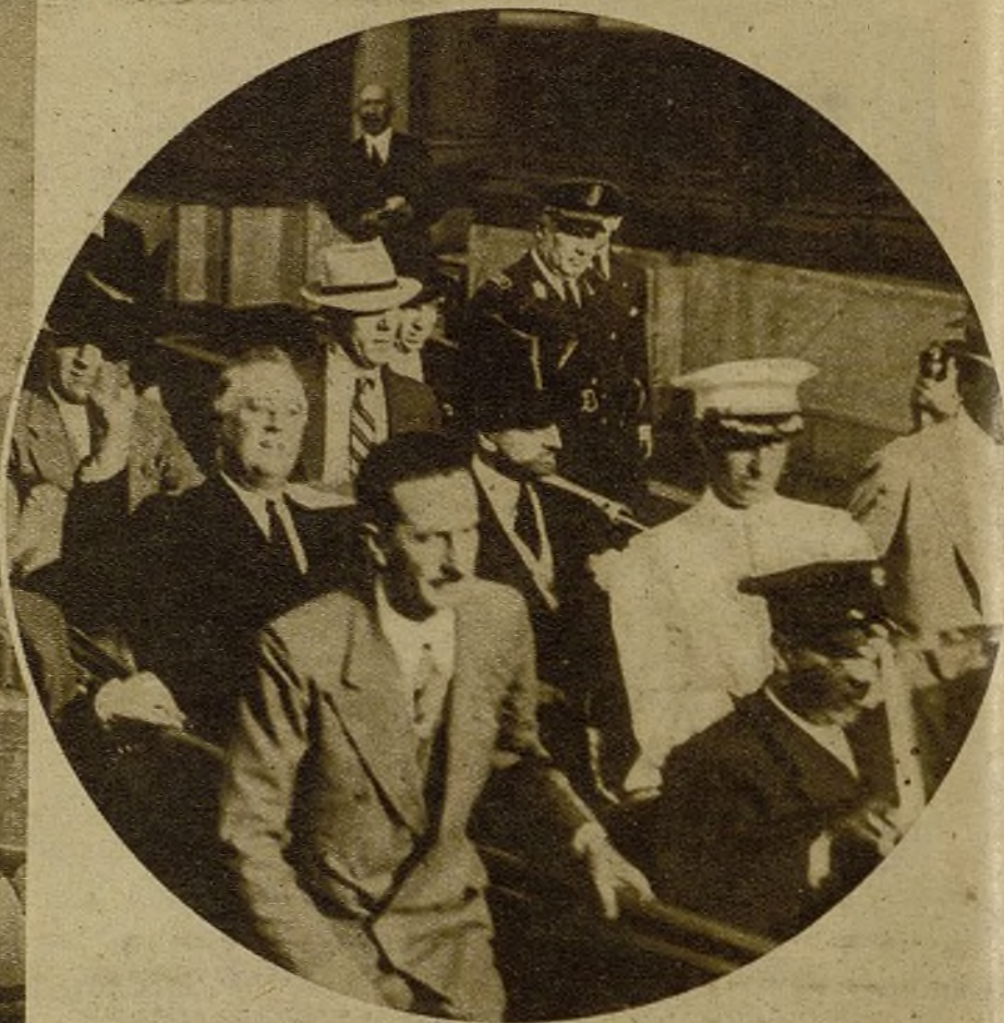
El presidente democrático de la Casa Blanca, Roosevelt, dirigiéndose a visitar al presidente conservador de la Casa Rosada, general Agustín P. Justo, en Buenos Aires, con motivo de la Conferencia Panamericana de la Paz. Roosevelt hizo después honor a las palabras de paz que pronunció en el Congreso, al reconocer al legítimo Gobierno de España