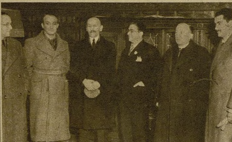
La Delegación de Sanidad de la Sociedad de Naciones ha llegado a España. Los delegados ginebrinos presenciaron, cuando visitaban Madrid, los criminales bombardeos de la Aviación extranjera