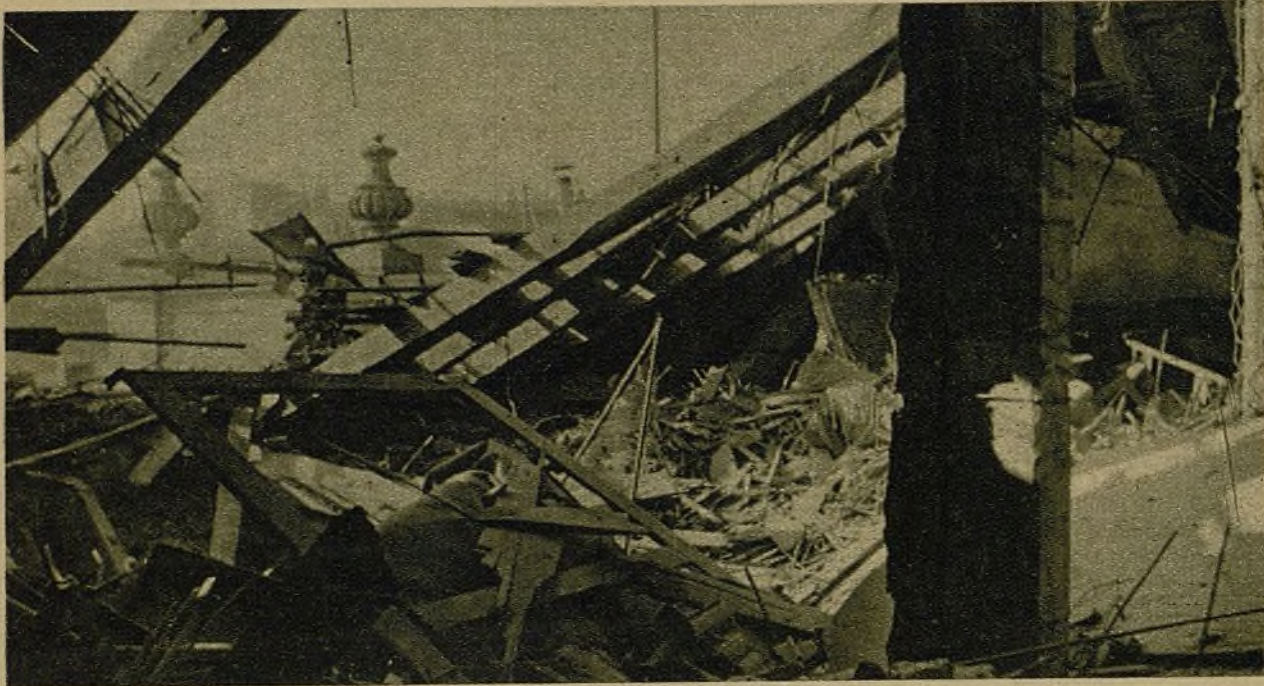
Una prueba, palpable y reciente, de la política suicida de la "no intervención": la Embajada de Inglaterra en Madrid bautizada por la metralla de los "hunos", enemigos tradicionales del pueblo inglés