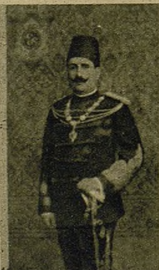
El retrato del rey Fuad de Egipto cayó al suelo, sobre los escombros...