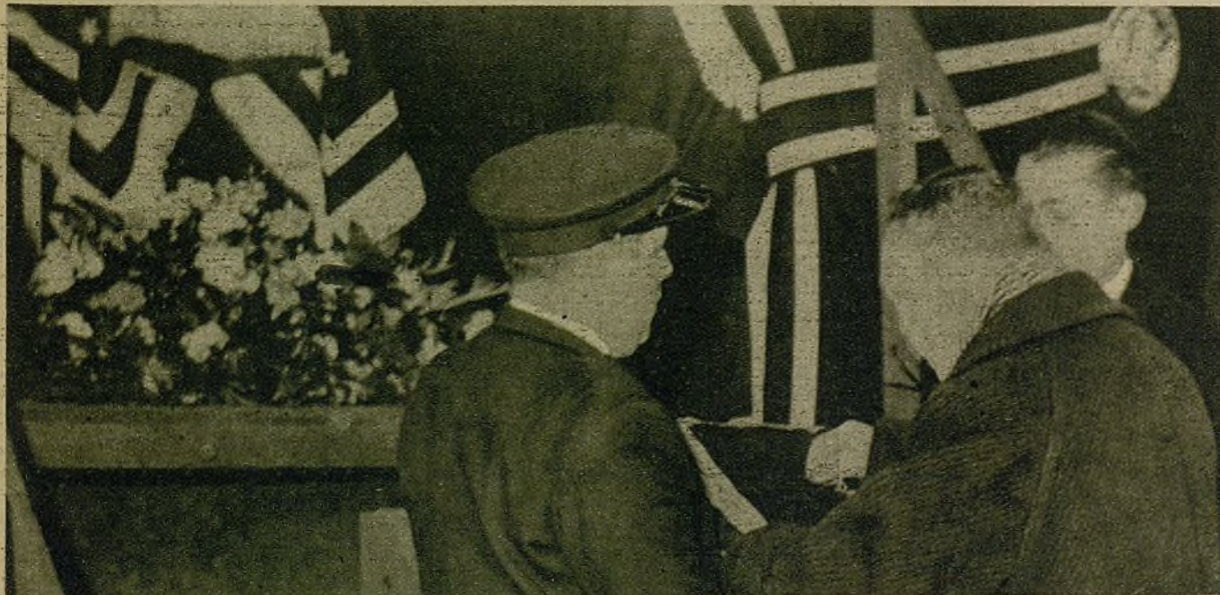
El pueblo francés honra a un periodista, Luis Delaprée, gran amigo de España y una víctima más de la Aviación alemana