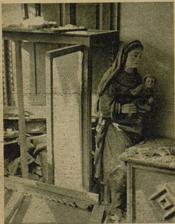
Esta Virgen con el niño, que adornaba la Embajada inglesa, ha conocido de cerca la barbarie de los católicos de Franco y de los protestantes de Hitler. Una de las granadas la ha arrojado al suelo, con la violencia y el insulto de una gran bofetada...