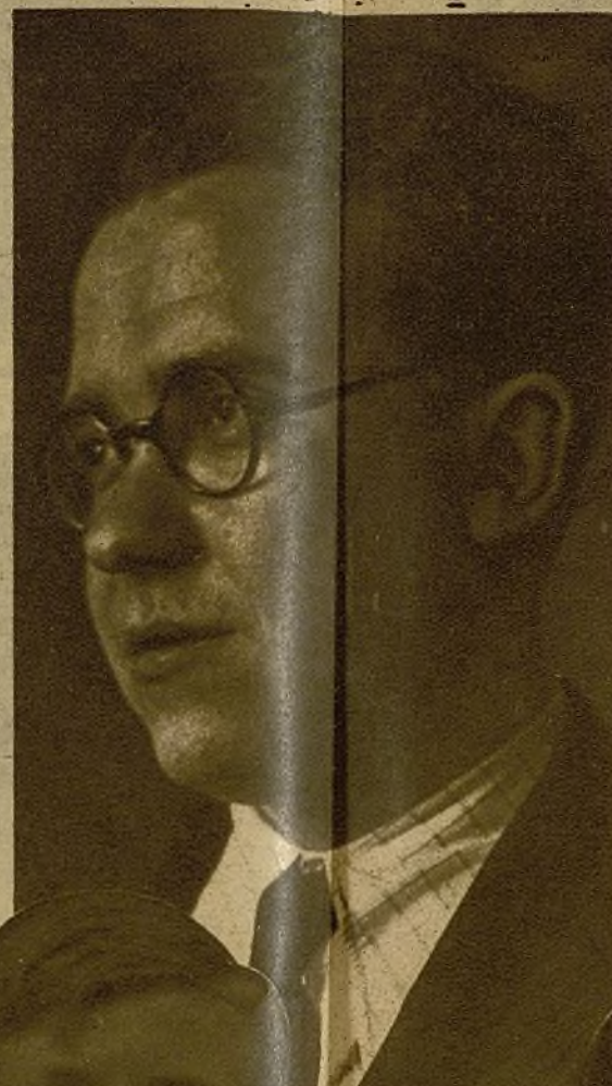
El camarada Santiago Carrillo, secretario general de las Juventudes Socialistas Unificadas

por los intereses de la juventud, hemos centrado nuestro trabajo en el Ejército, en la producción y en las Escuelas Militares, rompiendo con los viejos moldes de organización, que si eran justos el 18 de julio, hoy no se adaptan a la situación de guerra.