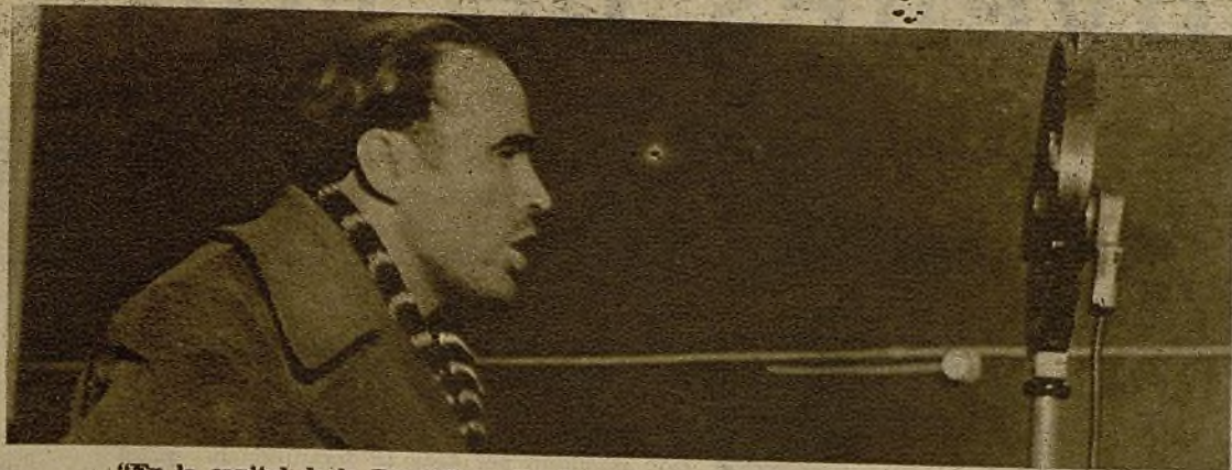
"En la capital de la República sólo debe haber combatientes" (Comandante Lister)