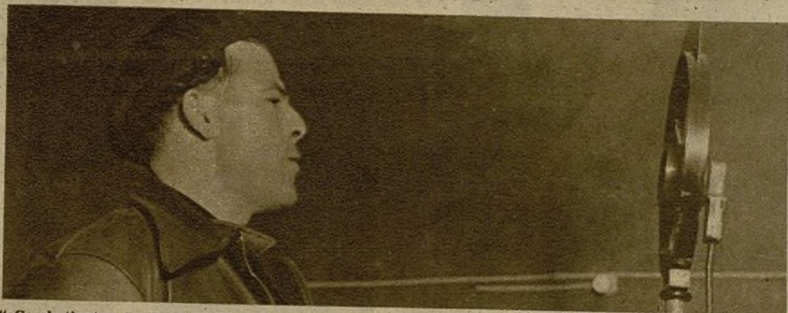
"¡Combatientes de Madrid! Más firmes que nunca, con las bayonetas delante y dirigidas hacia el pecho de nuestros enemigos para aplastar al fascismo internacional" (Comandante Modesto)