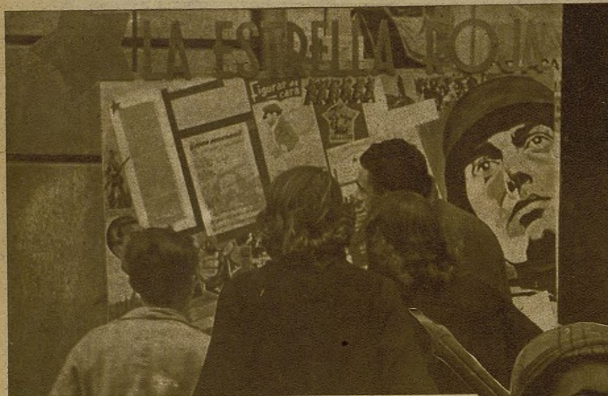
En todos los barrios, en todos los lugares de reunión de la juventud madrileña, docenas de periódicos murales redactados por los propios jóvenes se encargan de esclarecer los problemas que se van a discutir en Valencia

Despreciando las dificultades, venciendo el riesgo de la inexperiencia, decenas de muchachos, casi niños, se han transformado en el curso de la guerra de militantes anónimos en jefes queridos y respetados por millares de jóvenes.