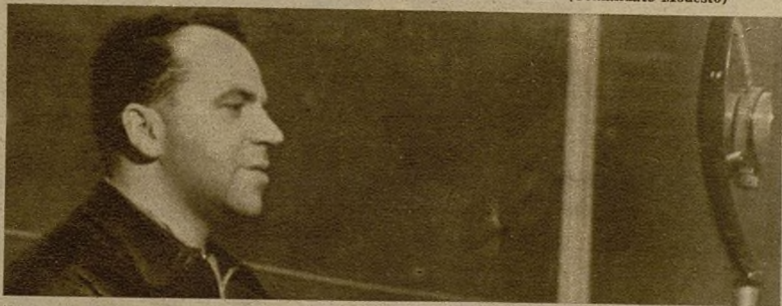
"Uno que abandona su puesto de batalla sin orden, pone en peligro al país, entrega su camarada al enemigo" (Comandante Carlos)