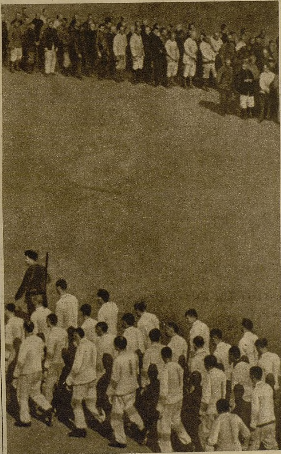
Esta es la España que quieren los fascistas...

No. Por mucho que ahonden los traidores en su terror no llegarán a "la raíz". "La raíz" está demasiado honda y es inmortal. "La raíz" es el pueblo todo de España.