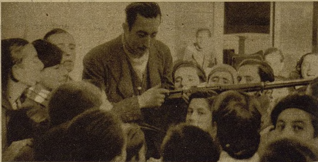
También el maestro ha tenido que aprender, y con qué trabajo. Hoy es un experto que enseña toda su ciencia a los nuevos soldados del Ejército del pueblo