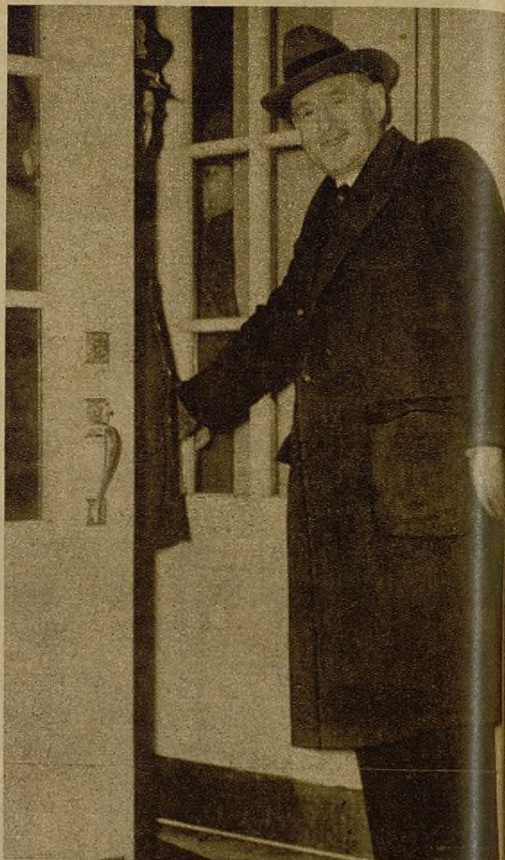
El gobernador Alf Landon, de Kansas (Estados Unidos), que pretendió convertirse en el dictador de la plutocracia yanqui