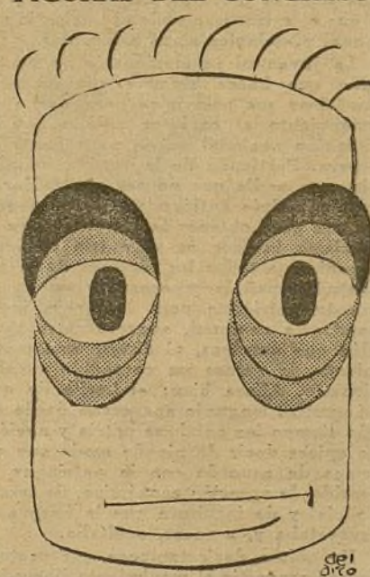
El matemático Blas Cabrera

patria libre de invasores y nuestra democracia libre de enemigos." Firma, Conferencia Nacional de Juventudes.