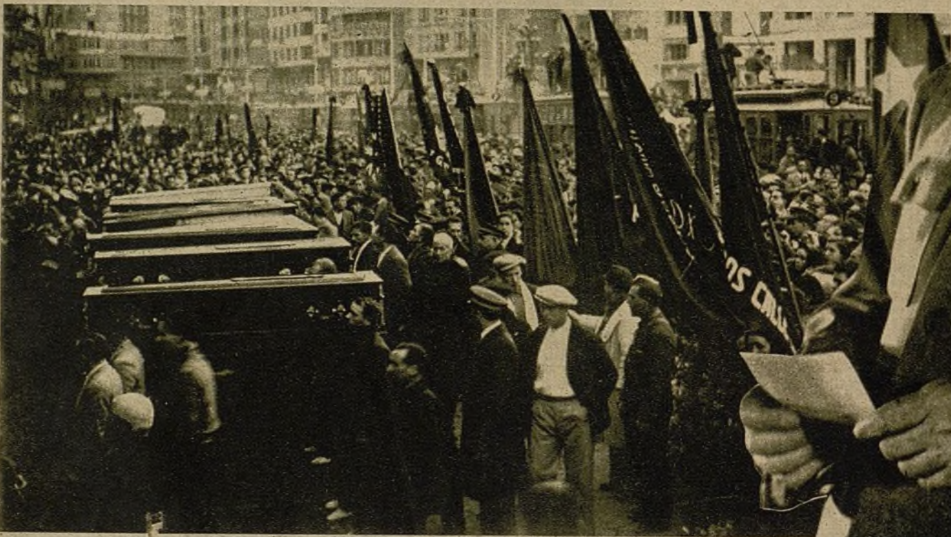
Una imponente manifestación, que invadió las calles de Valencia, acompañó a las víctimas que el bombardeo de los barcos fascistas alemanes causó en la población civil