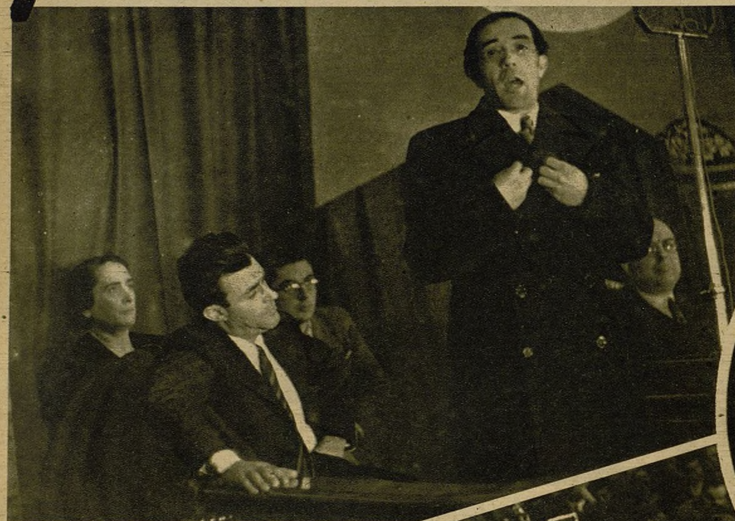
Los dirigentes del glorioso Partido Comunista Español, Jesús Hernández, José Díaz y "Pasionaria", heroicos luchadores del antifascismo y primeras figuras de la lucha por la unidad de todos los combatientes en lucha contra el invasor extranjero