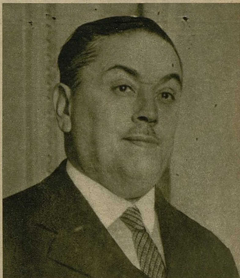
El jefe de Unión Republicana y presidente de las Cortes, Martínez Barrio, que ha dado pruebas de ser un leal amigo del pueblo