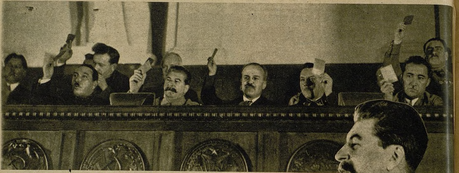
Los representantes del pueblo libre y feliz de la Unión Soviética en una de las sesiones en que se discute el proyecto de la nueva Constitución