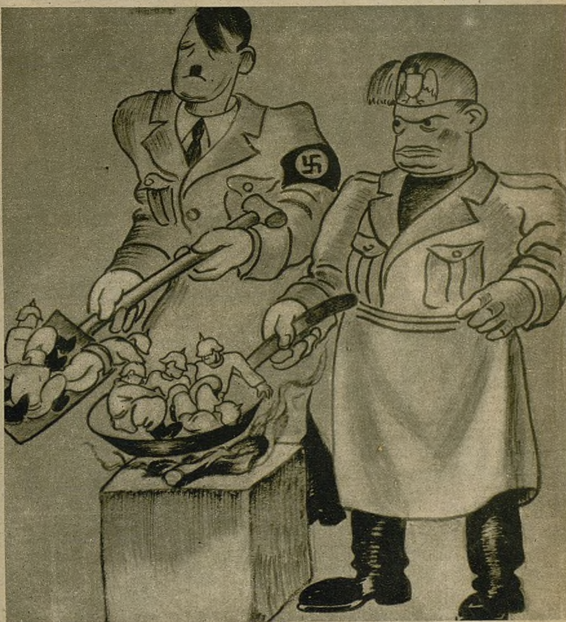
BENITO: Anda, date prisa; hay que echar toda la carne en el asador antes que nos intervengan.