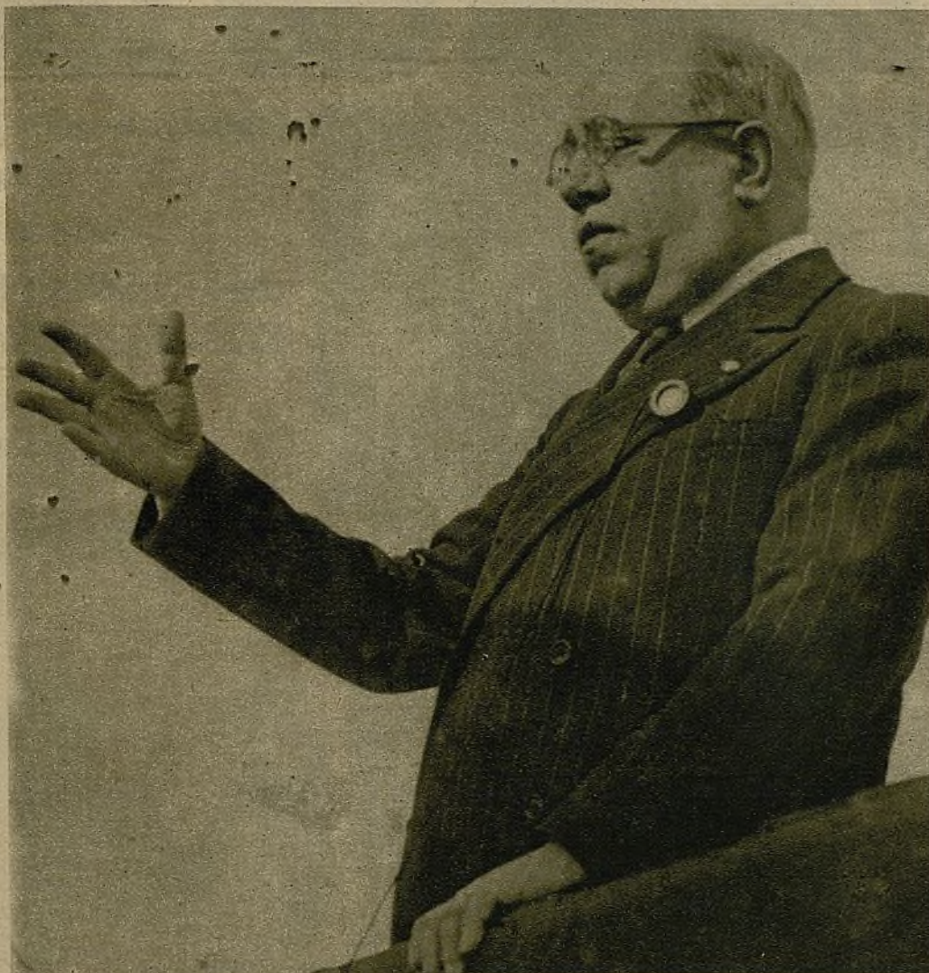
Su Excelencia el Presidente de la República, señor Azáña, uno de los hombres que luchó por el advenimiento de la República.