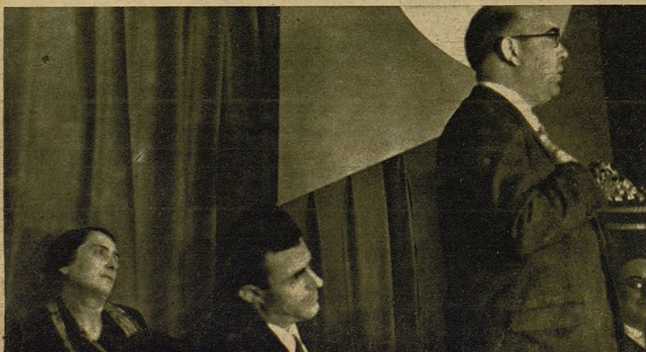
En el círculo, Antonio Machado, la más honda conciencia poética de España y un firme pilar del pensamiento europeo. Su presencia en nuestro Congreso afirma ante el mundo nuestra defensa de la cultura y de la tradición en contra de la barbarie fascista