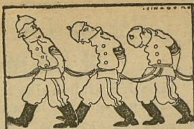
Le llegan los "voluntarios" sin voluntad a von Franco