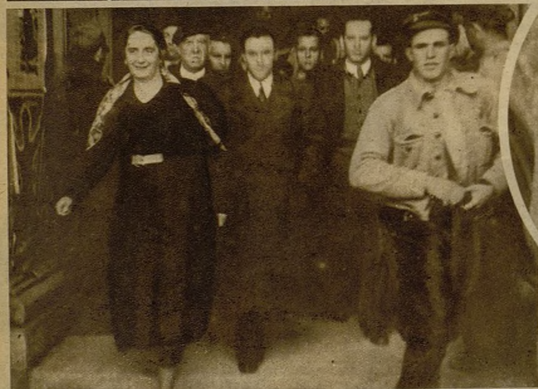
• "Pasionaria" y José Díaz abandonan el edificio en que se está celebrando el Congreso y sonríen satisfechos porque tienen fe en la juventud