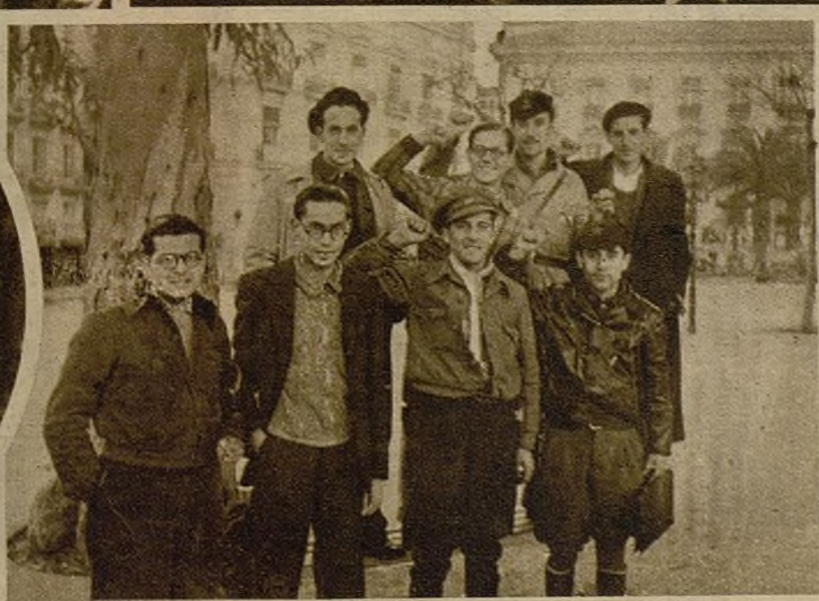
Después de las largas sesiones del Congreso este grupo de delegados toma el aire y el sol en las calles tranquilas de una ciudad de retaguardia