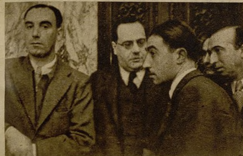
• Todos escuchan con atención. Se determina la línea política del porvenir y es necesario asimilar todo lo que dice el orador