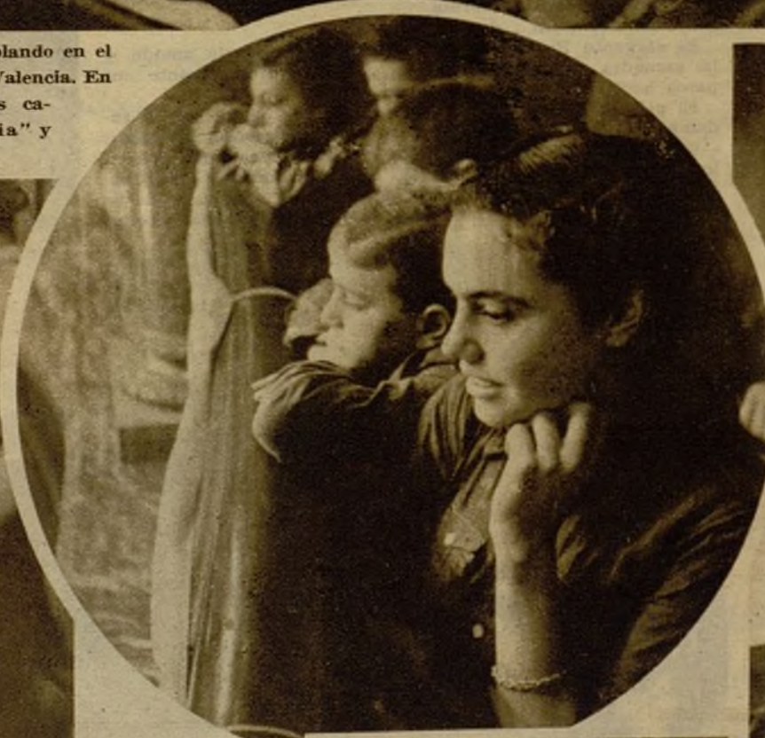
Esta muchacha es una joven socialista unificada. Está segura de la victoria y sonríe al porvenir feliz