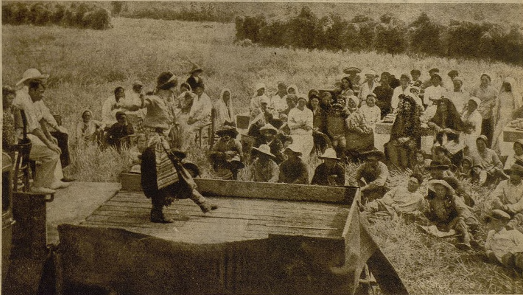
Campesinos, hijos de un pueblo que supo despreciar la vida por la libertad. Viven felices; han terminado sus tareas del campo, bailan y rien y su alegría invade el aire. En sus caras no existe la huella de la miseria y del sufrimiento, porque son los campesinos libres de la Unión Soviética

El hijo fué apresado, y como se negó a luchar contra el pueblo lo mataron. Después destruyeron su casa. Sin hijo y sin hogar, nada hay que la sujete en aquellas tierras. Ha oído hablar de un pueblo feliz, fuerte y poderoso, que se encuentra en lejanas tierras del Este y espera encontrarlo