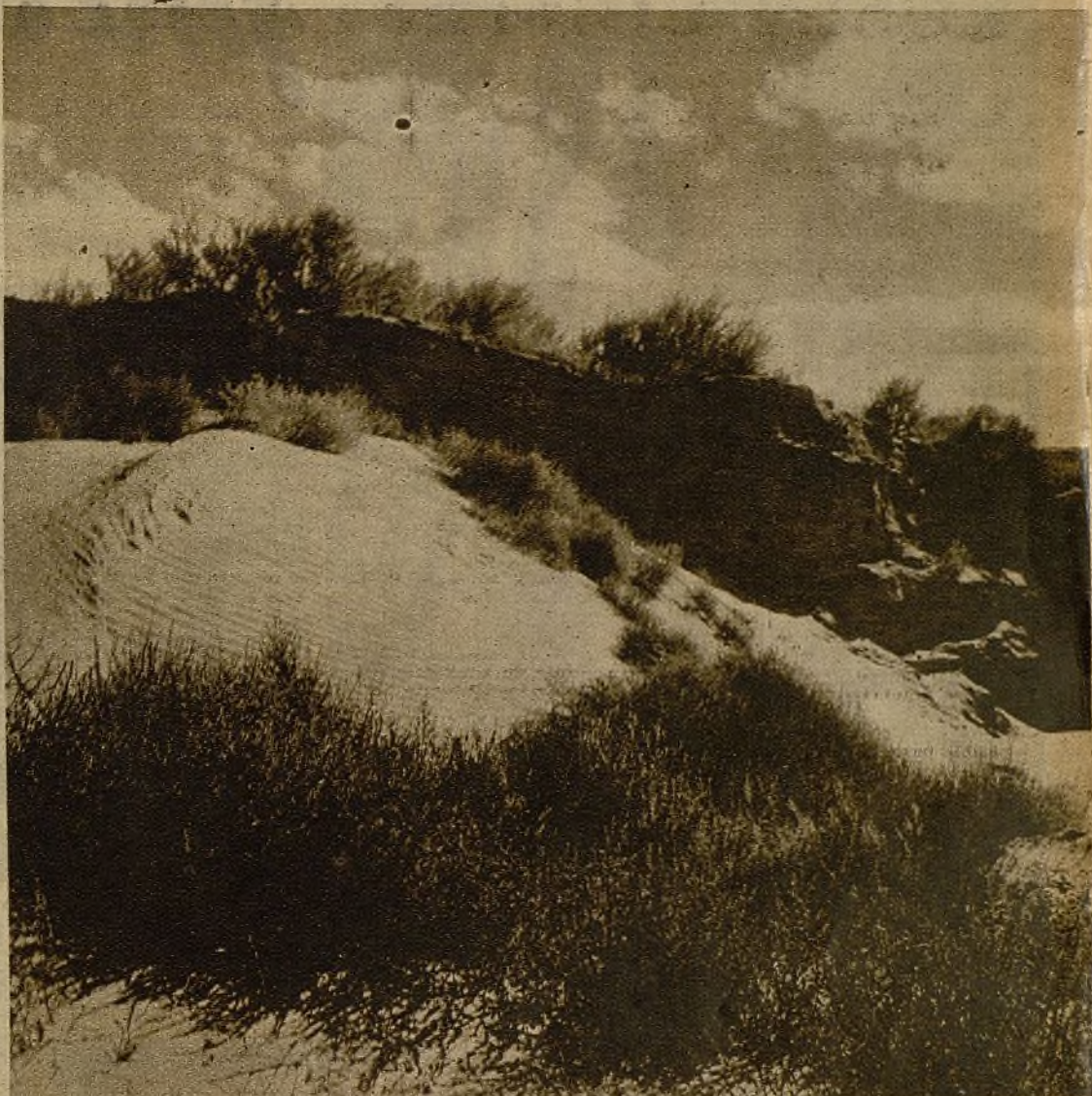
Dunas de arenas en Méjico. Dunas en las que se hundieron los pasos de Cortés, el conquistador, y de las caballerías de Pancho Villa, el guerrillero indómito

El pelotón de los torpes—diez o doce a lo sumo—golpea rudamente, plac-plac—sobre el duro suelo caliginoso. Los otros—unos seiscientos o setecientos—se ejercitan en las marchas, en los cuerpos a tierra, en el manejo del fusil. Son casi las cinco. El sol, en declive, alarga sobre la tierra las sombras, que se persiguen y se entrecruzan caprichosamente. Hombres y som-