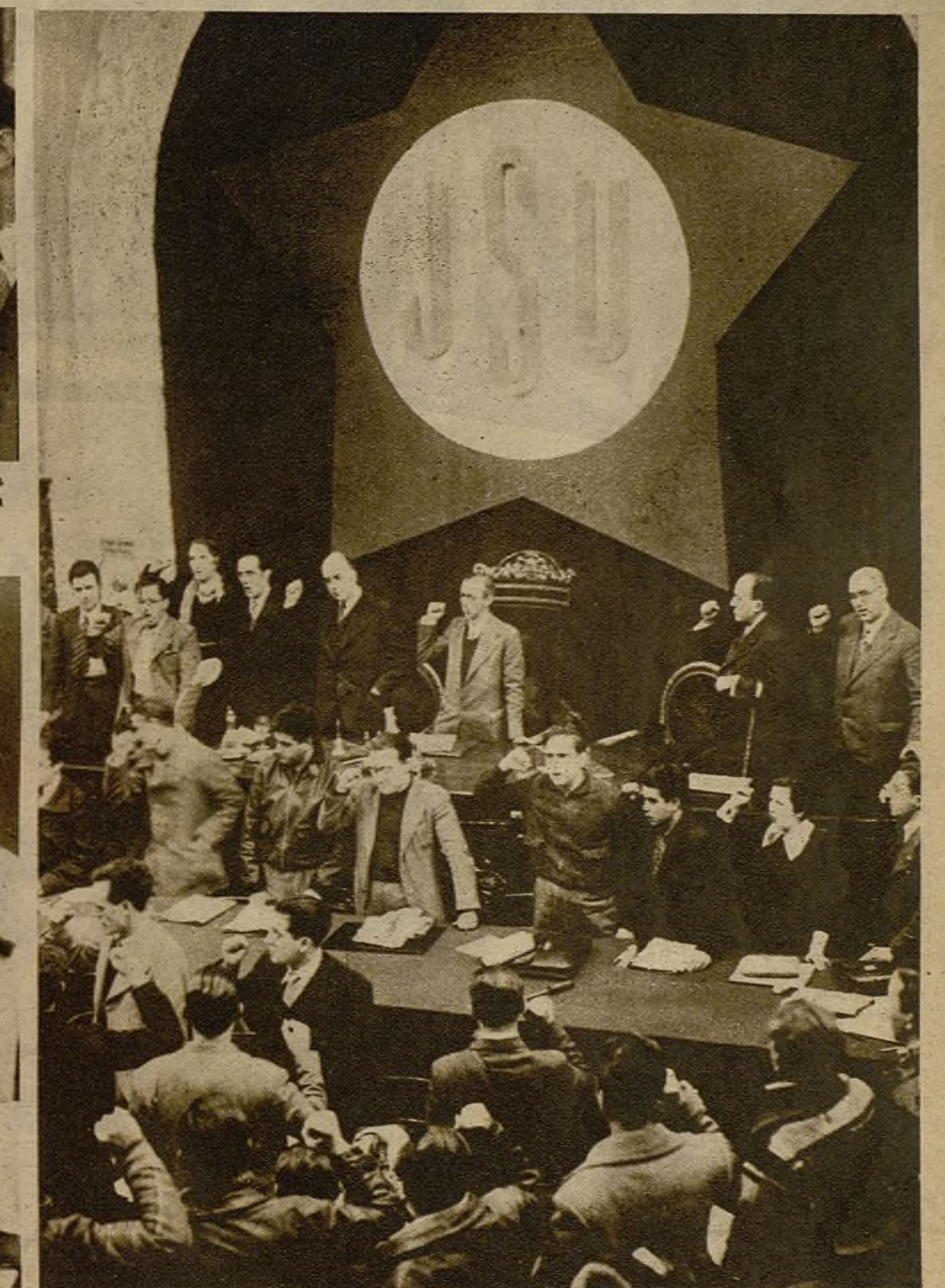
Los congresistas saludan con el puño en alto, mientras se escuchan los acordes de "La Internacional". En la mesa de la presidencia, Santiago Carrillo, secretario general de las Juventudes Unificadas