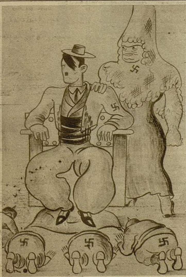
EL SUEÑO DEL "FUHRER" EN ESPAÑA

—Aquí no hay más español que yo; los demás los he fusilado.