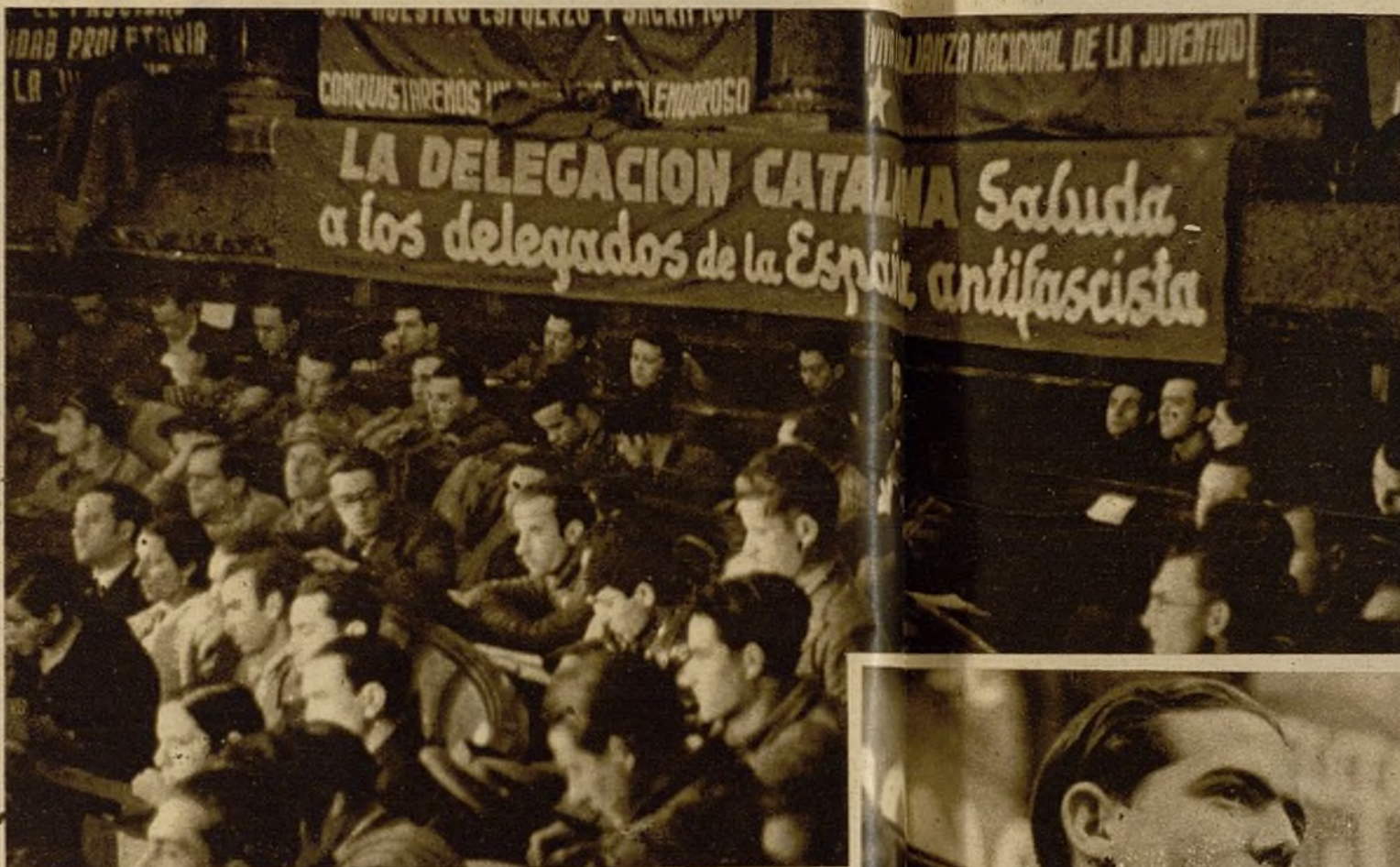
Cataluña ha enviado una numerosa delegación al Congreso Nacional de las Juventudes Socialistas Unificadas, celebrado en Valencia

“Y podemos decir que la representación de esa nueva juventud heroica, de esa nueva juventud culta está aquí” ¡AHORA SOMOS DOSCIENTOSCINCUENTA MIL!