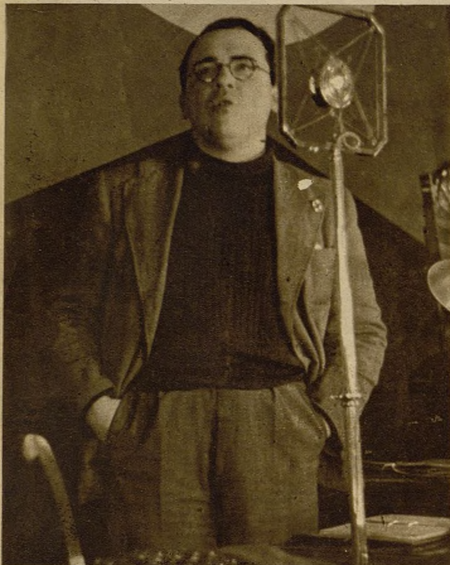
Nuestro camarada Santiago Carrillo, secretario general del Comité Ejecutivo de la Federación de Juventudes Socialistas Unificadas