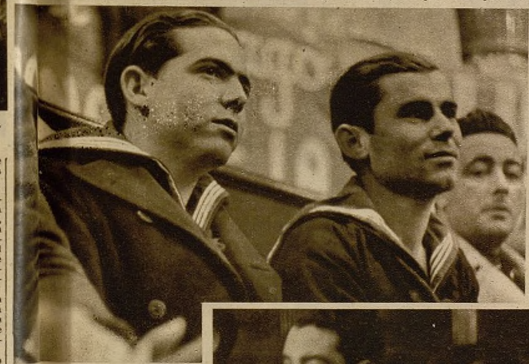
También "Cronstadt" españoles han estado representados por estos camaradas al Congreso de Valencia

Hay algo aún que diferencia nuestra Conferencia de las que anteriormente ha celebrado la juventud española. Os acordáis, seguramente, de los Congresos de la Juventud Socialista y de la Juventud Comunista. Entonces no hacíamos más que ver de qué modo podíamos ir contra los Gobiernos, de qué modo podíamos minar la autoridad y la fuerza de los Gobiernos, de qué modo podíamos