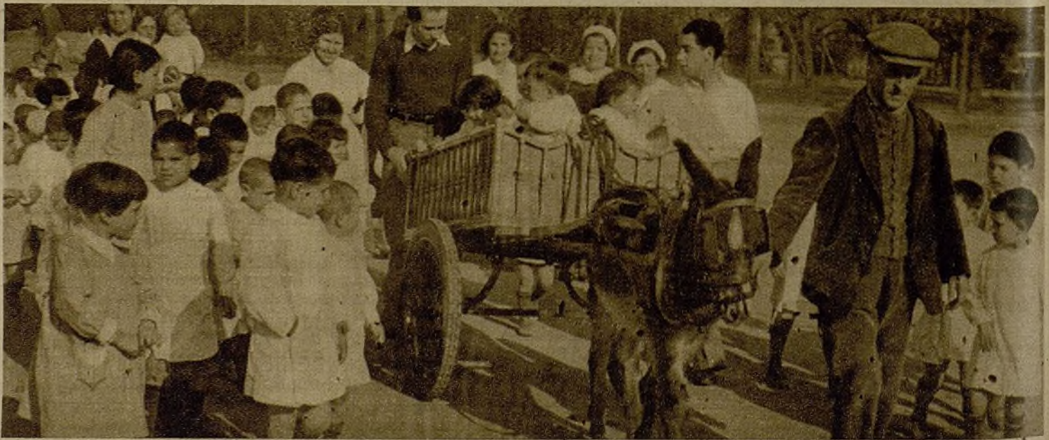
En Barcelona, los niños madi- leños juegan "al burro Mola", y el que paga el pato, por des- gracia, es un burro honrado que nada tiene que ver con los facciosos