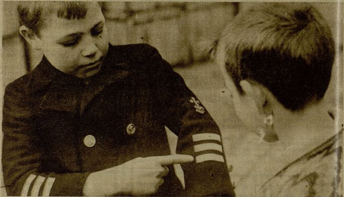
El valor de nuestros marineros entusiasma a los niños de toda España. Uno de ellos convenció a los Magos (ellos saben que los Magos son las bellas camaradas que repartieron los juguetes) de que le tra- jeran un traje de almirante republicano. Con este motivo, está más orgulloso que un "cazador de tanques"