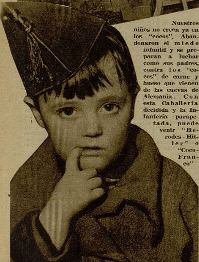
Nuestros niños no creen ya en los "cocos". Aban- donaron el miedo infantil y se pre- paran a luchar como sus padres, contra los "co- cos" de carne y hueso que vienen de las cuevas de Alemania. Con esta Caballería decidida y la In- fantería parape- tada, puede venir "He- rodes - Hit- ler" o "Coco- Fran- co"