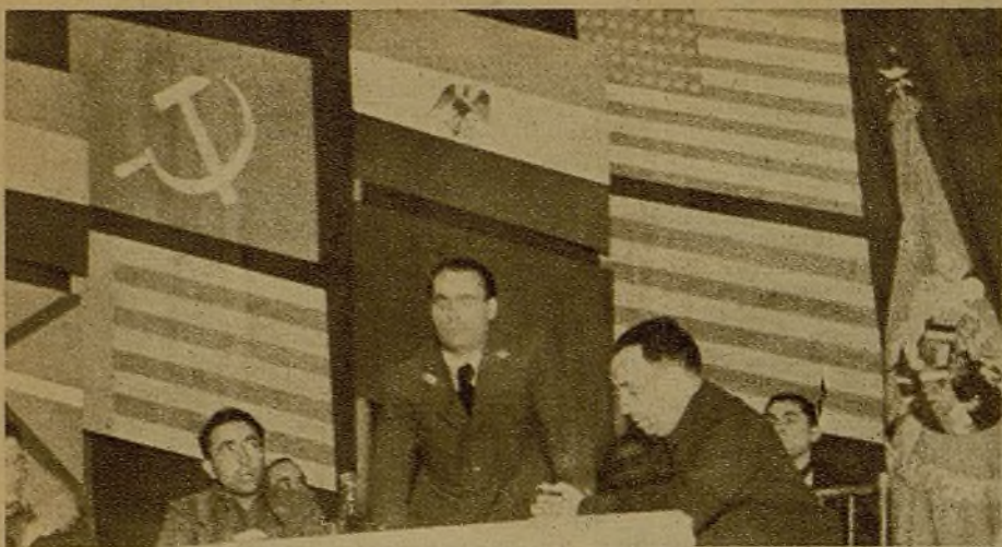
Organizado por los grupos de Sanidad de la Primera Brigada Mixta se celebró un acto de homenaje a la Brigada Lister e Internacional, a la que le fué entregada una bandera. El heroico comandante Lister en un momento de su intervención