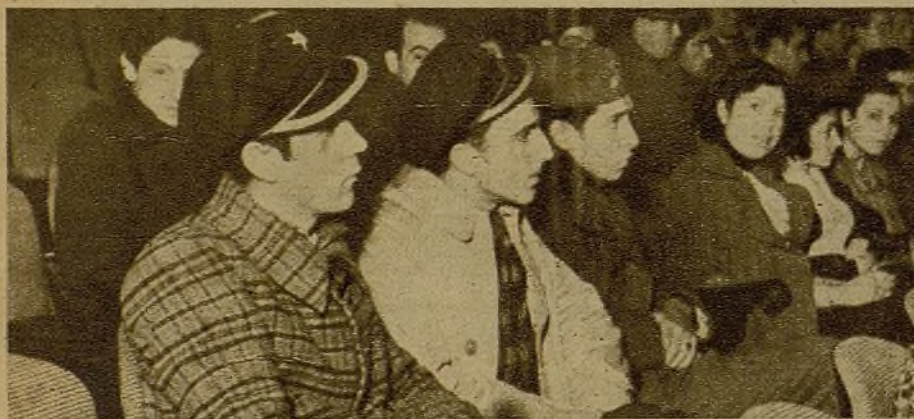
Otro acto del domingo. La juventud escucha a un orador. Las últimas consignas y la verdadera situación actual de la guerra se explican desde el escenario, ante la atención consciente y entusiasta de los jóvenes, a los que no distrae ni el fogonazo aparatoso del magnesio del fotógrafo