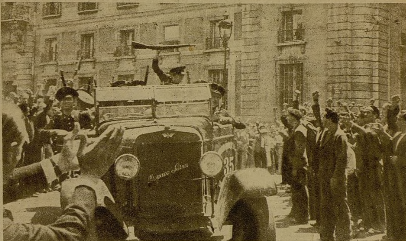
Primeros días de la sublevación militar. Algunos camiones con guardias de Asalto salen—en pleno desconcierto heroico— a sofocar los focos rebeldes. Bajo el sol violento de julio, el pueblo los aclama a gritos

El capitán Cuevas—la mujer de la ventana había quedado complacida—se quedó allí fijo también, como la guerra. No admitió ni conoció nunca los permisos.