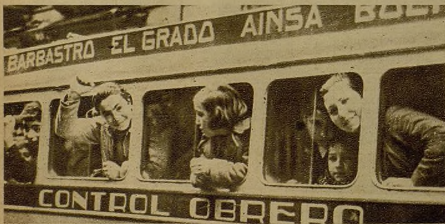
Los Sindicatos de Barbastro no se contentan con condolerse de la situación de las mujeres y niños de Madrid, amenazados por la metralla "nazi". Han hecho algo más práctico: han enviado a la capital catorce autocares, para contribuir así a la evacuación. He aquí uno de ellos—repleto de niños—en el momento de su salida hacia regiones más seguras