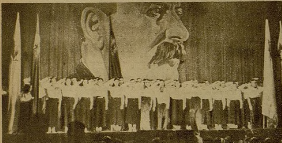
Alerta, la creciente organización juvenil, celebró un importante acto en el cine Monumental. Una sección de muchachas, en el escenario, saludan al público, que las aclama