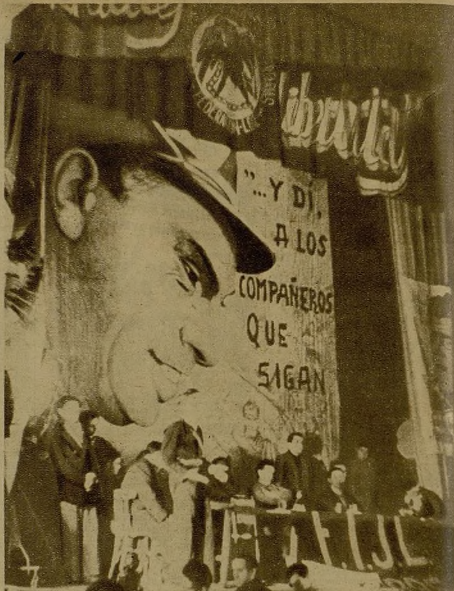
Las Juventudes Libertarias celebraron un mitin en el cine Durruti. Sobre la presidencia, un monumental retrato del heroico luchador confederal, con una inscripción de sus últimas palabras: "Dí a los compañeros que sigan..."