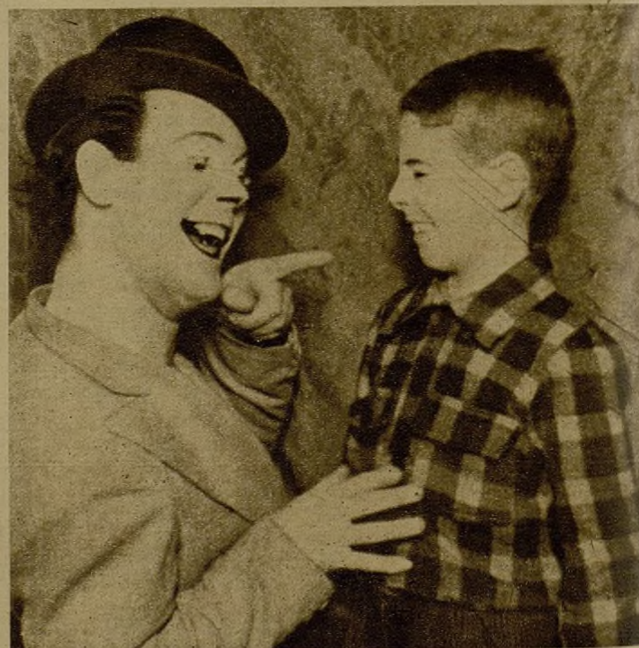
En uno de los actos organizados por los jóvenes que aprenden la instrucción pre-militar, hubo también "varietés". El excéntrico "Sepepe", manteniendo un animado diálogo con uno de los pequeños espectadores