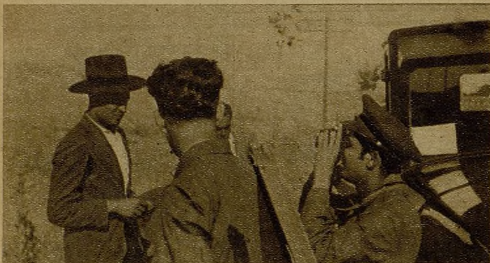
Sol y tiros en el frente de Málaga. El enemigo está cerca. Muchachos del Perchel, de la Trinidad, de la calle de la Victoria, se juegan la vida cara a cara...