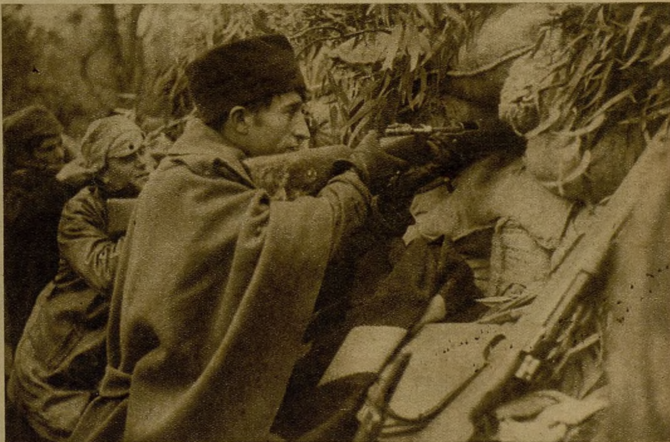
En las fotos, tres aspectos del Parque y de sus combatientes, héroes populares, chavales cetrinos de nuestro Madrid, que se han convertido hoy en ejemplares artilleros y buenos especialistas de la reconquista del bello F.º