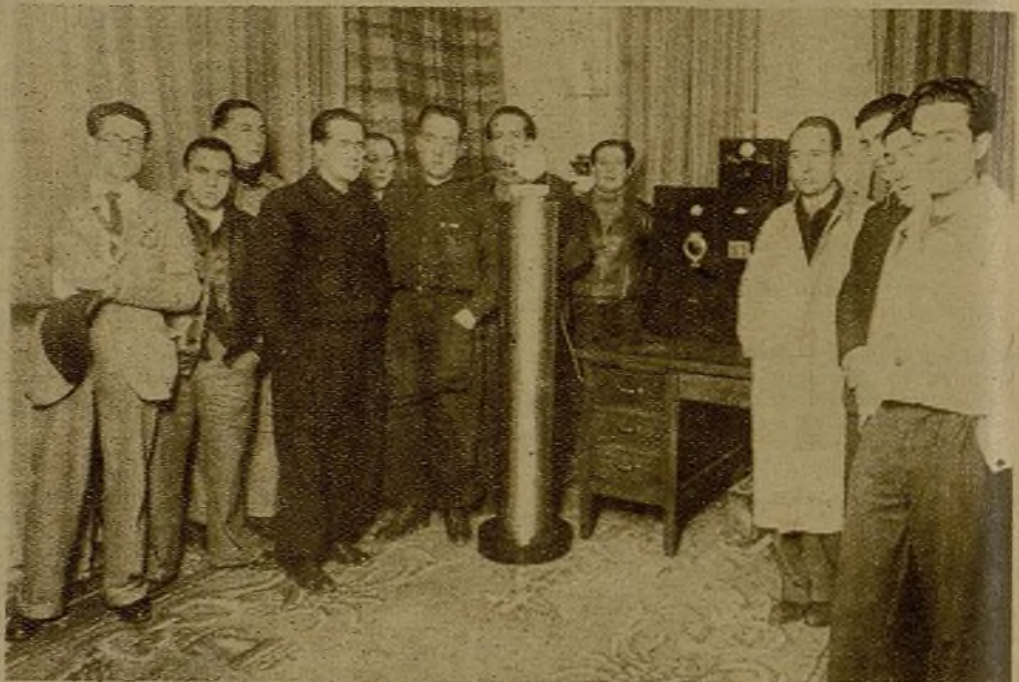
El S. R. I.—la gran organización de la solidaridad—ha inaugurado una emisora en Madrid. En la foto: representantes de los distintos grupos del Frente Popular, que intervinieron en el acto inaugural