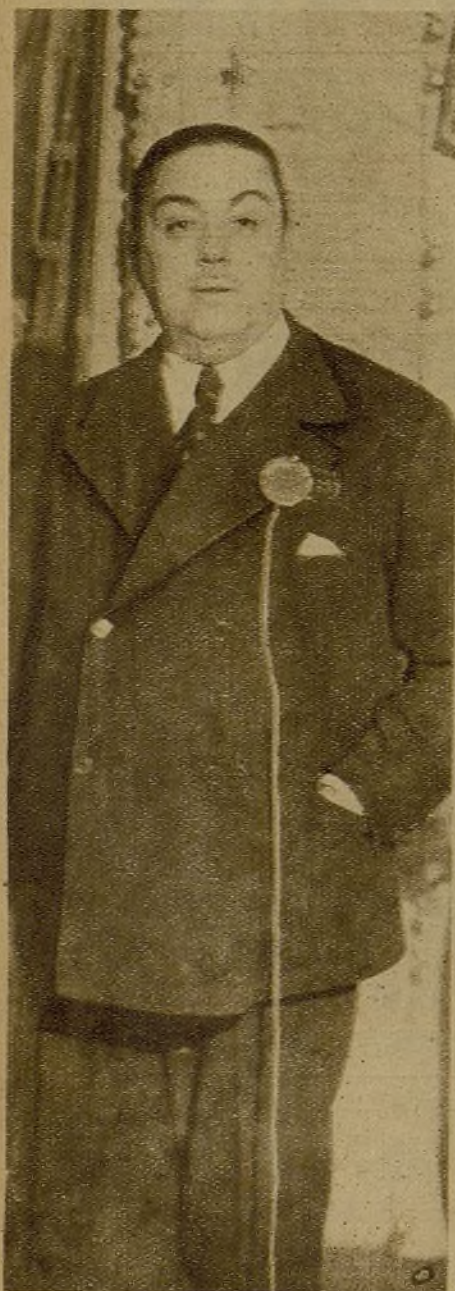
El presidente de las Cortes de la República, señor Martínez Barrio, en un momento del discurso que pronunció últimamente en Valencia