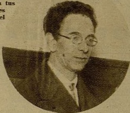
Leopoldo Alas Argüelles—hijo de "Clarín"—, rector de la Universidad de Oviedo, va a ser fusilado por los "civilizadores" de Asturias. El fascismo quiere demostrar, una vez más, al mundo su capacidad inagotable para el crimen y su odio a muerte a la cultura