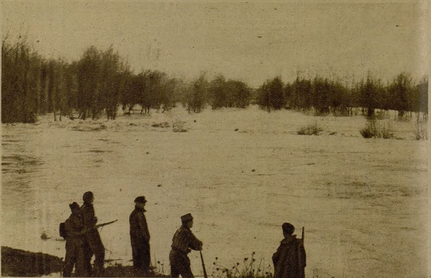
El río Tago—antiguo testigo de idilios reales y hoy espectador de la guerra—ha sufrido una crecida con las últimas lluvias. El agua ha hecho retroceder a un bando y a otro. Las siluetas vigilantes de estos milicianos hacen centinela en "nuestra orilla..."