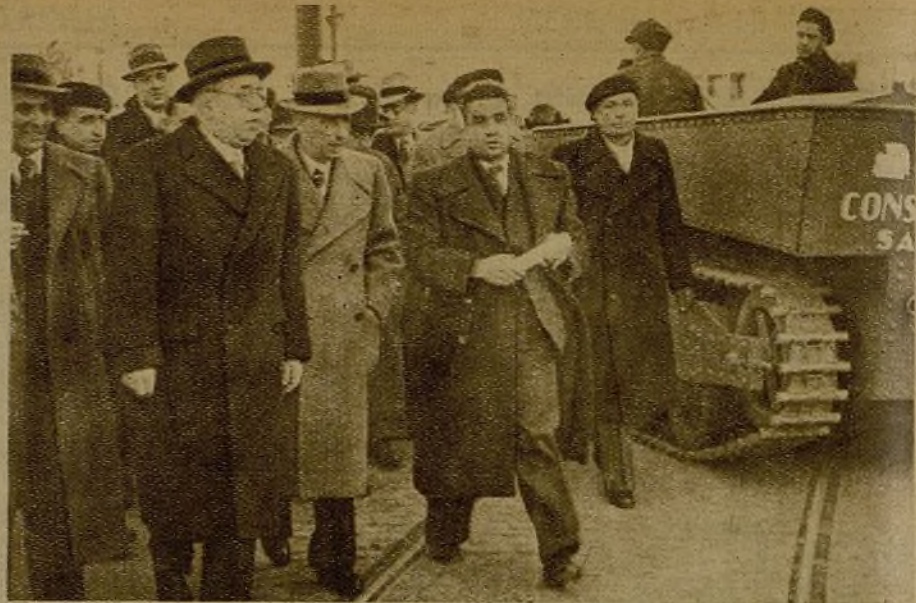
El Presidente de la República, acompañado del presidente de la Generalidad, visitan las fábricas de material de guerra de la región catalana