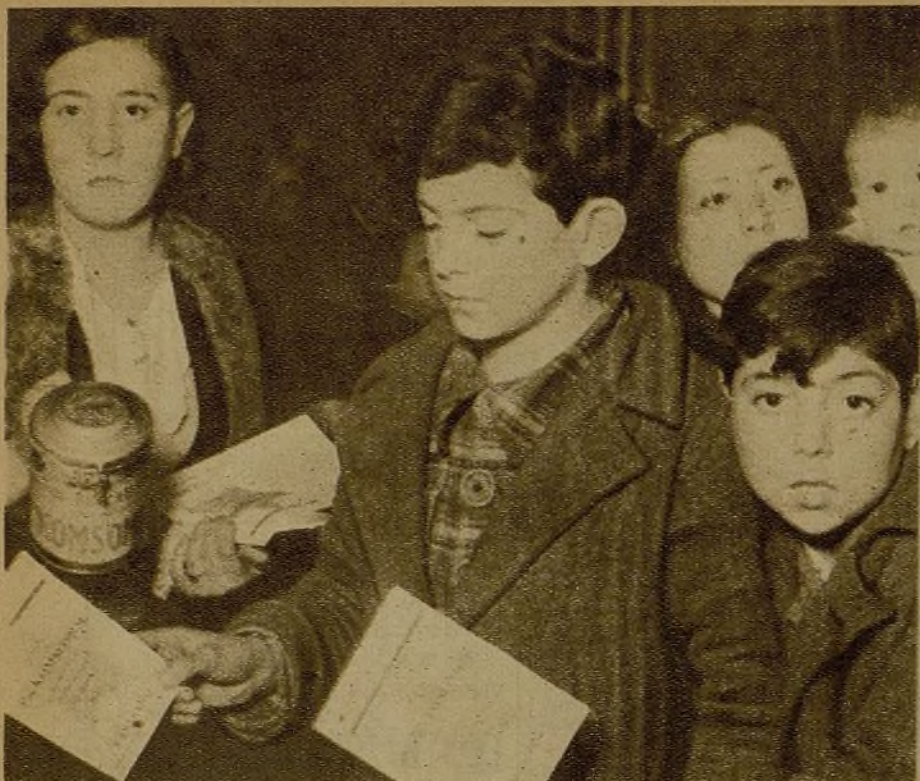
La campaña pro-"Komsomol". Lector: ¿tú crees que para demostrar tu gratitud y tu admiración por la ayuda que nos presta el pueblo soviético basta con hablar bien de la U. R. S. S. con tus amigos...? Hoy, mejor que mañana, debes dar tu donativo para la construcción del nuevo "Komsomol". Estos tiempos no son de palabras