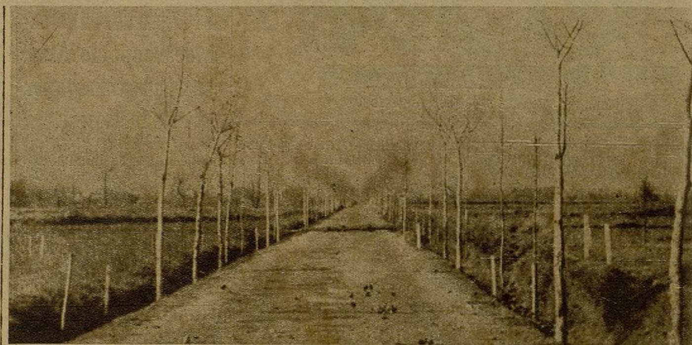
Desde la Granja de Monflorite parte esta carretera, que muere en Huesca. Ha sido recorrida por nuestras tropas en combates duros, donde palmo a palmo se ha ido conquistando el terreno hollado por el enemigo. En el camino se observan los efectos de la metralla. No importa. Con el esfuerzo unido de la juventud aragonesa y catalana construiremos la nueva carretera de la reconquista