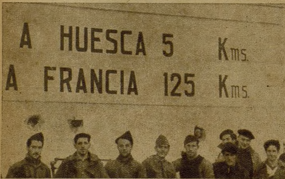
Este grupo de valientes, al lado de la casilla de los peones camineros, muestran su enorme deseo: avanzar, entrar en Huesca para vengar tanta infamia, tanto crimen