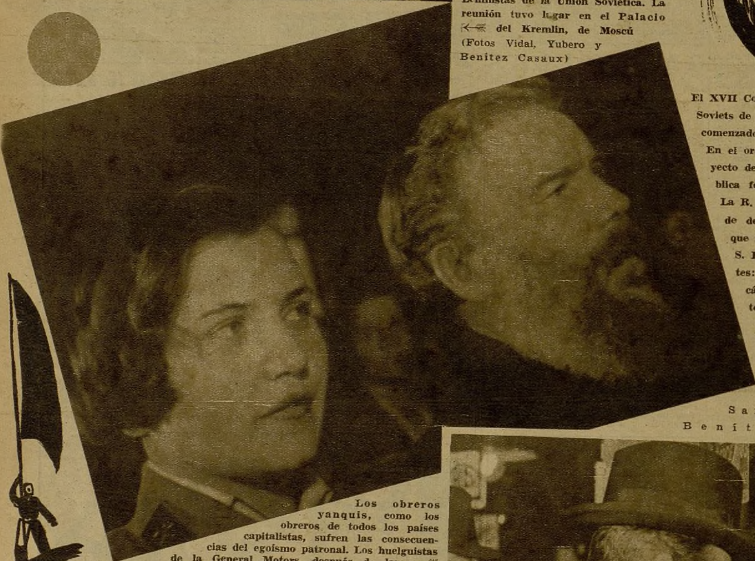
Los obreros yanquis, como los obreros de todos los países capitalistas, sufren las consecuencias del egoísmo patronal. Los huelguistas de la General Motors, después de largos días de espera, consiguen un triunfo momentáneo

El XVII Congreso extraordinario de los Soviets de la R. S. F. S. R., que ha comenzado el 15 de enero en Moscú. En el orden del día figuraba el proyecto de constitución de esta República federada. Informará Kalinin. La R. S. F. S. R. es la más grande de las Repúblicas federadas que forman parte de la U. R. S. S. En la foto, dos representantes: la camarada Rattsiva, mecánica ajustadora del depósito de ferrocarriles de Sverdlovsk, y Balaudine, granjero del Kolhoz "Tractor", representantes de la construcción socialista.