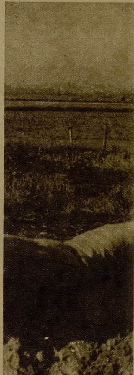
Al fondo se ve Huesca. En algunos combates hemos llegado hasta la calle del Desengaño, batida por los legionarios atrincherados en la Catedral