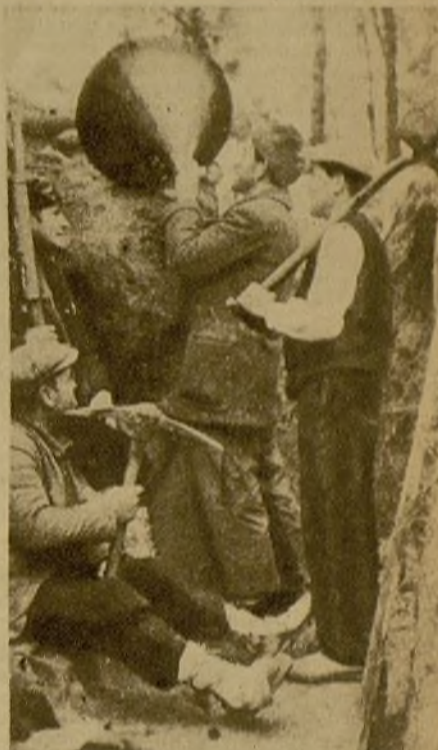
Los heroicos fortificadores han limpiado la trinchera de la primera línea. Ahora escuchan atentos las palabras que este miliciano dirige—a través de una bocina de gramófono—a los soldados enemigos