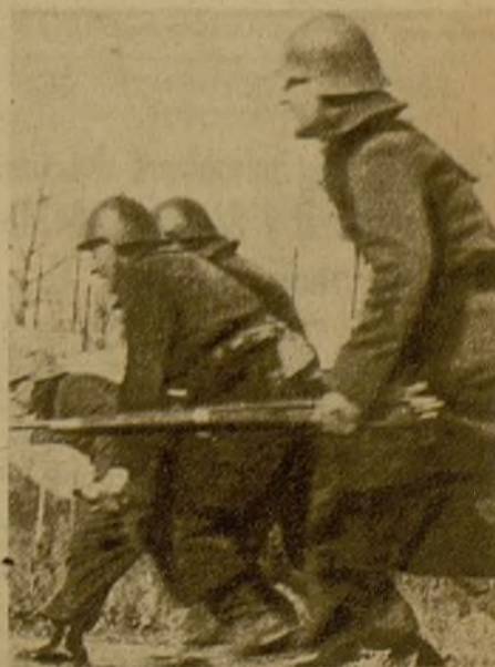
En los sectores cercanos al Parque del Oeste, nuestras tropas llevan la iniciativa en el ataque. Cada paso hacia adelante es un combate, cada hombre una voluntad firme de victoria