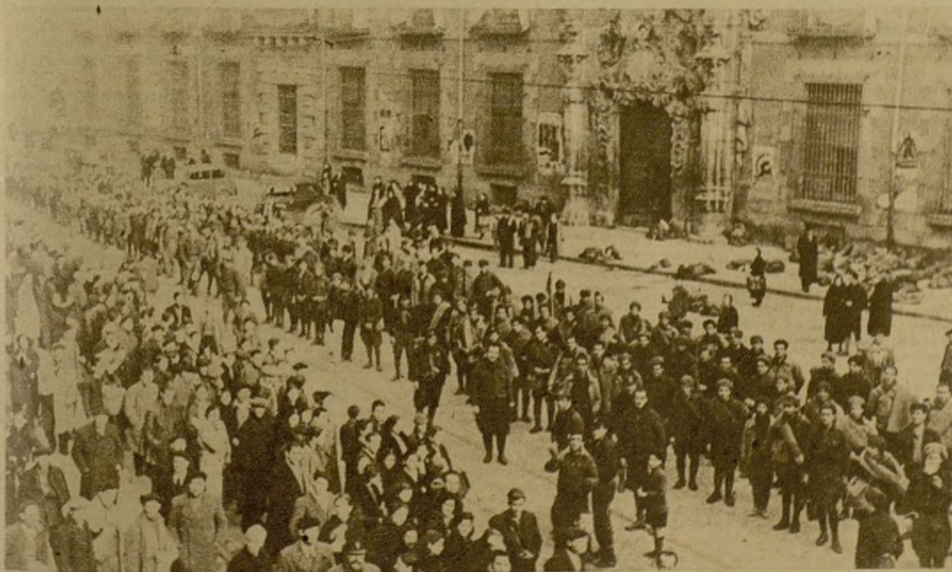
La juventud catalana ha enviado un nuevo batallón a los frentes de Madrid. Formados en la calle, el pueblo de la capital les aclama. Muchachos de Barcelona, de Manresa, de Lérida, de toda Cataluña, que vienen a ocupar su puesto de honor en la defensa de la independencia... Pertenecen todos a la J. S. U. de Catalunya y están encuadrados en un batallón bajo el nombre glorioso de Jaume Gralles