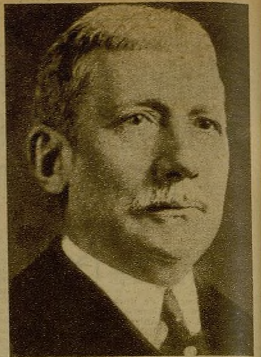
Elihu Root, estadista norteamericano, organizador del Tribunal de Arbitraje de La Haya y Premio Nobel de la Paz en 1912, ha fallecido en los Estados Unidos

Presidencia del gran mitin de solidaridad con el pueblo español, organizado en el Madison Square Garden, de Nueva York, al que asistieron más de 30.000 personas. En este grandioso mitin se recogieron varios miles de dólares, que han sido destinados a servicios sanitarios y acopios de productos para los heroicos milicianos que defienden las libertades del pueblo español. Los camaradas yanquis saben que en España se juegan los destinos del mundo