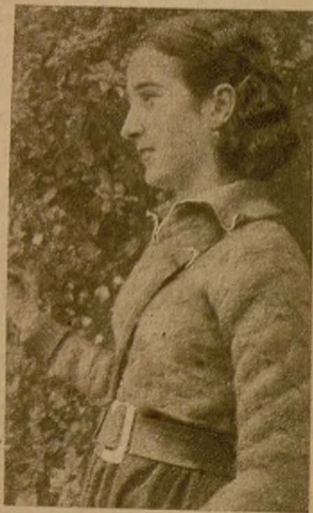
Pero aun le queda otra mano. Aun le queda la fe inquebrantable en la victoria. "¡Todo puede darse por bien empleado!", y el deseo de ayudar, de luchar por el pueblo, como sea...