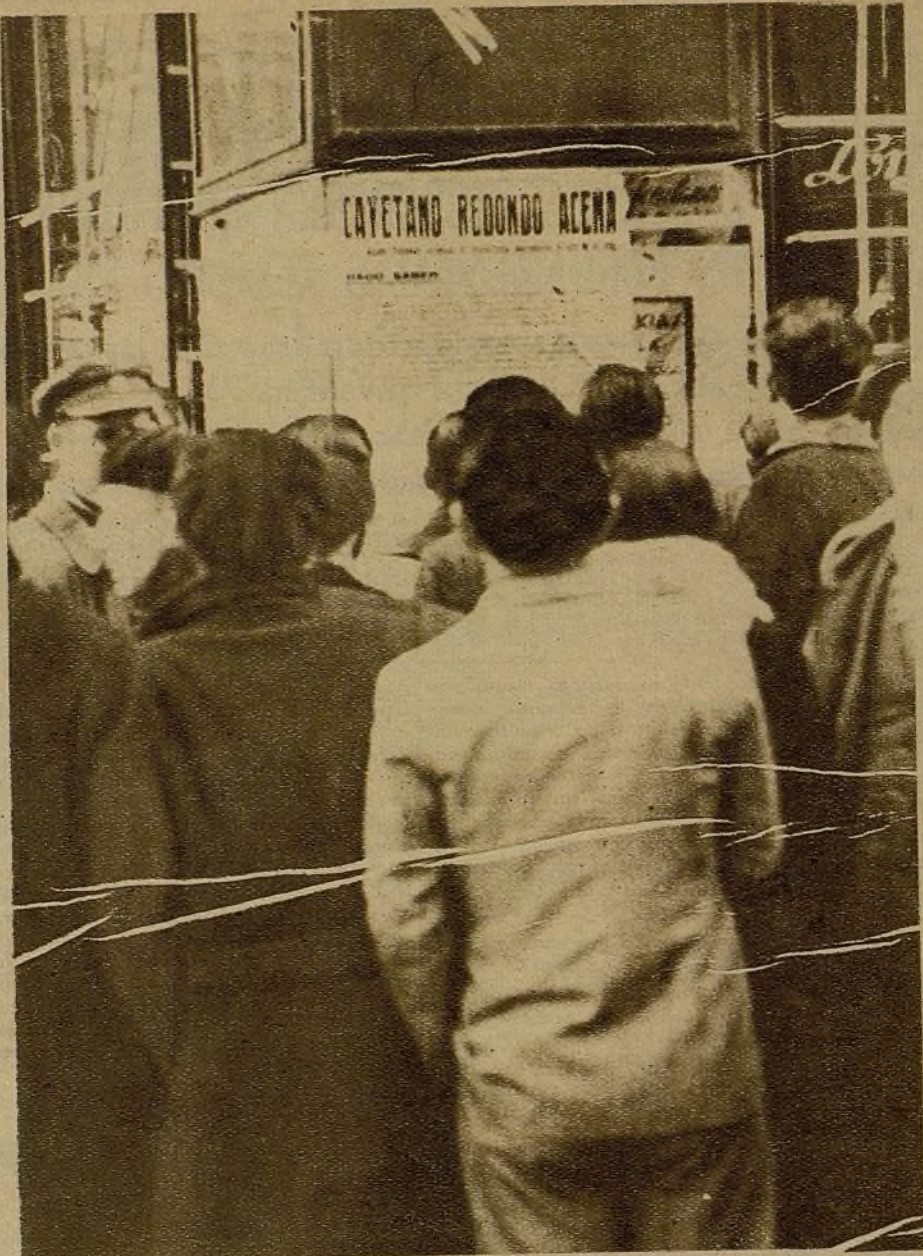
El pueblo de Madrid, lleno de fe en la victoria, lee el bando del alcalde, que expresa su deseo de abatir al fascismo