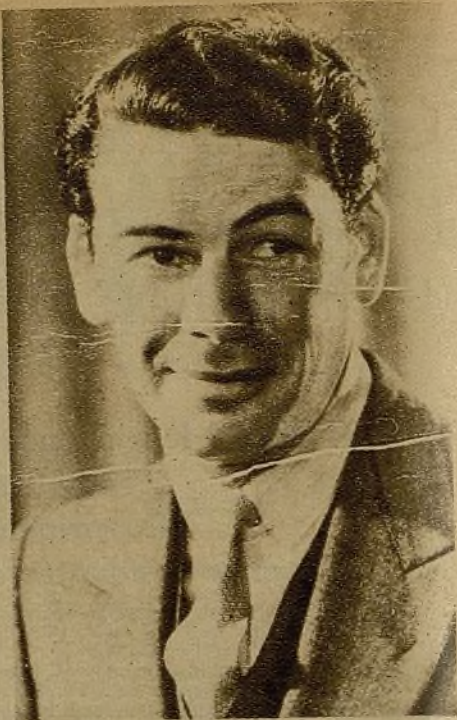
Paul Muni, uno de los artistas más admirados de todo el mundo porque ha sabido interpretar en sus films la tragedia de los oprimidos y perseguidos por la justicia capitalista. El creador de "Soy un fugitivo" se ha solidarizado también con el pueblo español. Los grandes artistas están siempre con el pueblo