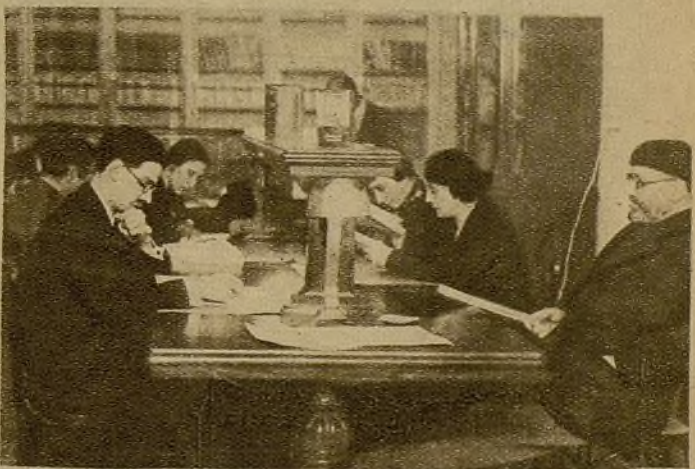
La biblioteca de la Casa de la Cultura. Una de las mejores bibliotecas actuales