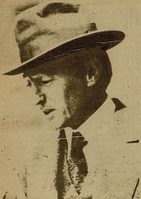
El gran escritor yanqui Upton Sinclair, autor de "La Yungla" y "Carbón", que con un grupo de escritores y artistas de fama internacional ha dirigido un mensaje de adhesión calurosa al pueblo español a través de nuestro querido camarada Largo Caballero