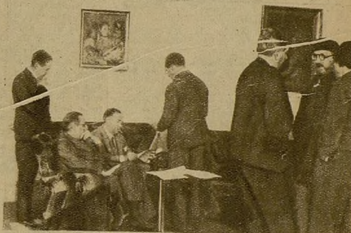
A la derecha de la foto, León Felipe, con boina de viajero, habla sobre España

LOS POETAS, LOS ESCRITORES Y LOS HOMBRES DE CIENCIA ESTAN CON EL FRENTE POPULAR CONTRA EL ESPIRITU FEUDAL DEL FASCISMO