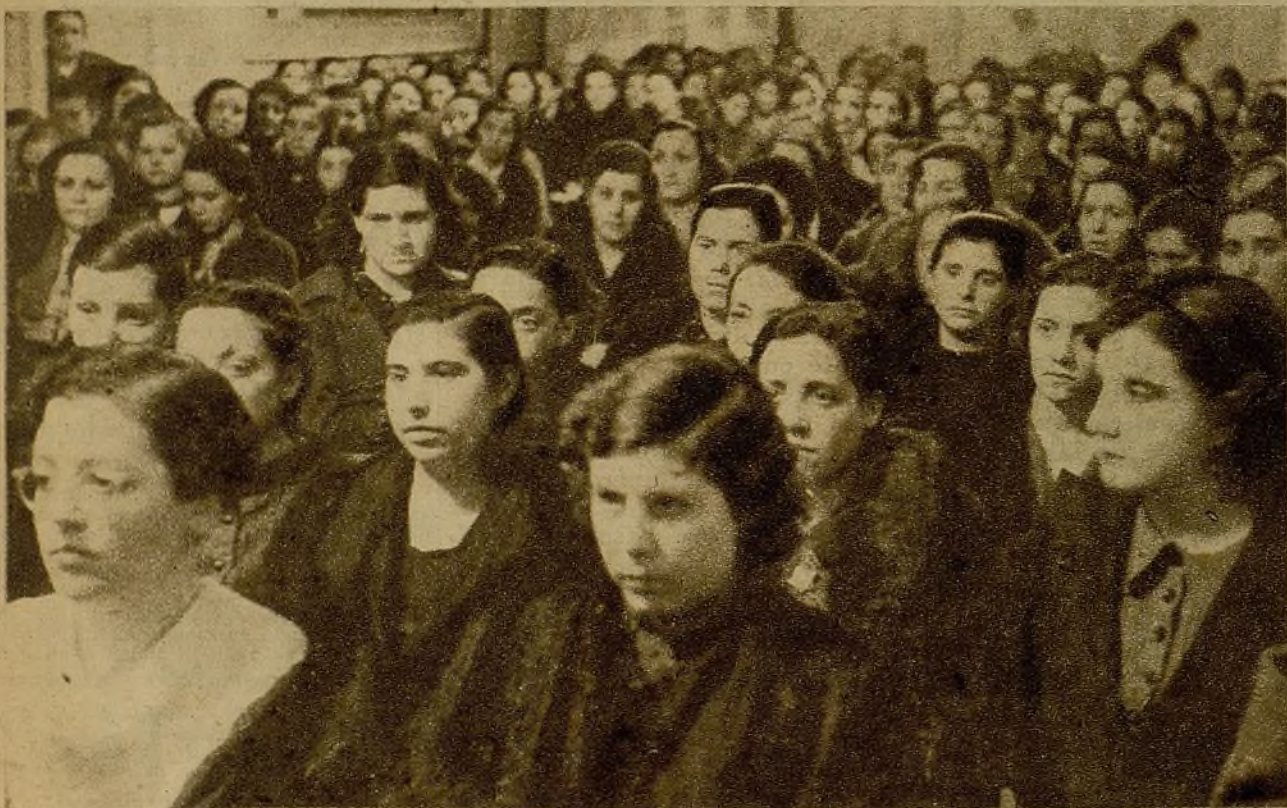
El Partido Comunista sigue su campaña de esclarecimiento de todos los problemas actuales. Un aspecto de la reunión de responsables femeninos