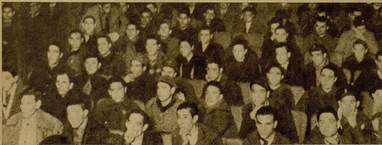
Ante la caída de Málaga, todas las juventudes de Madrid se han puesto en pie. En la foto primera, un aspecto parcial del mitin de las Juventudes Libertarias