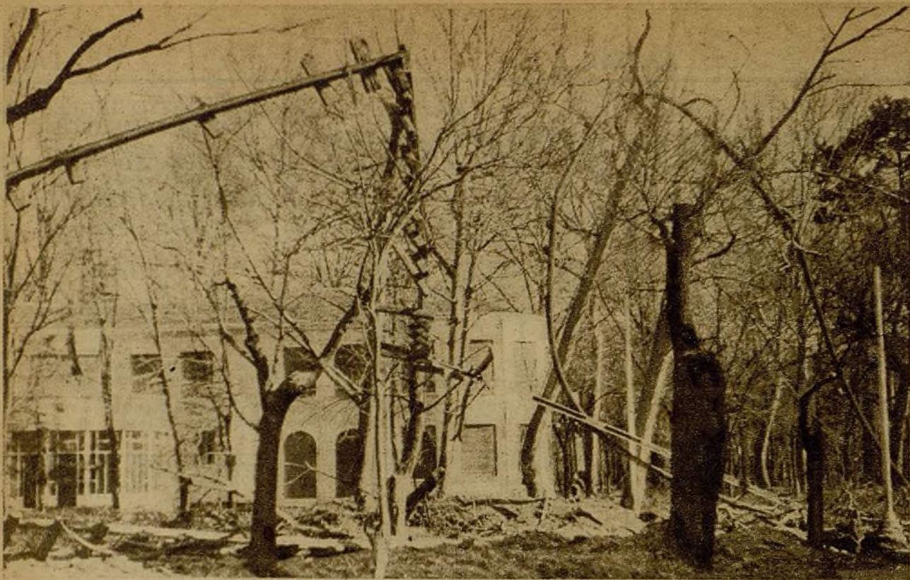
La guerra "la toma" también con los árboles. He aquí unas astillas capaces de solucionar el problema del frío...