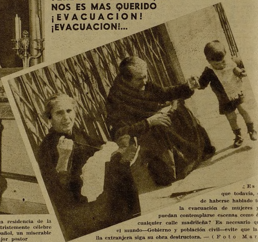
¿Es posible que todavía, después de haberse hablado tanto de la evacuación de mujeres y niños puedan contemplarse escenas como éstas en cualquier calle madrileña? Es necesario que todo el mundo—Gobierno y población civil—evite que la metralla extranjera siga su obra destructora.