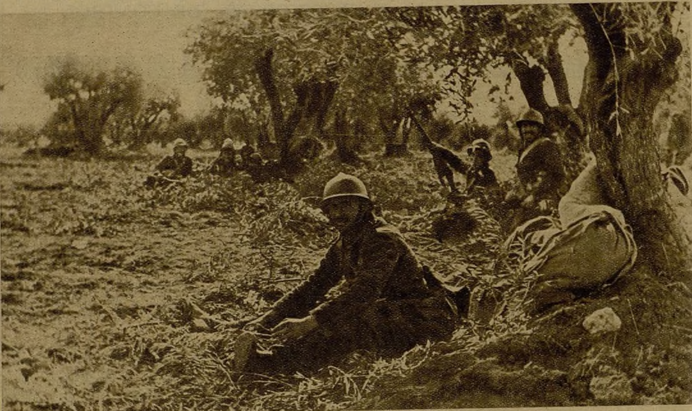
Alemania quiere cercar Madrid. Entre los olivares, sobre las lomas, las brigadas del Ejército del pueblo resisten férreamente los ataques enemigos. El domingo pasado nuestros hombres rechazaron siete ofensivas...