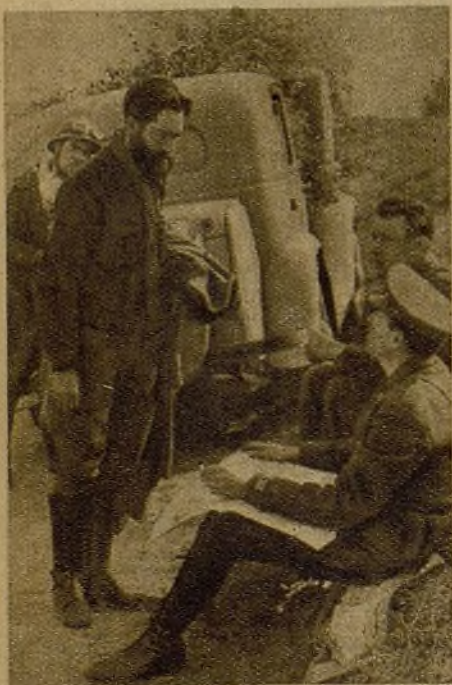
Jefes del Ejército de la libertad junto a las líneas. Estado Mayor, órdenes y cadáveres... Faupel—el general de la Alemania fascista—comienza a preocuparse al sentir la presencia de estos hombres

Sin embargo, hay algo que molesta e irrita al general extranjero. Es algo con lo que él no contaba: la resistencia y el heroísmo del Ejército del pueblo. Los