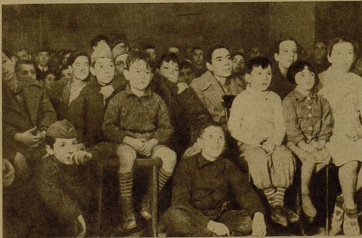
El local de nuestro periódico AHORA se vió anteanoche animado con la presencia de los chicos de la barriada del paseo de San Vicente, que vinieron a presenciar el teatro del pueblo "La Tarumba". A pesar de la alegría que nos produjo su presencia, gritamos a sus padres y madres: "¡Salvad vuestros hijos de la barbarie fascista evacuándolos!"