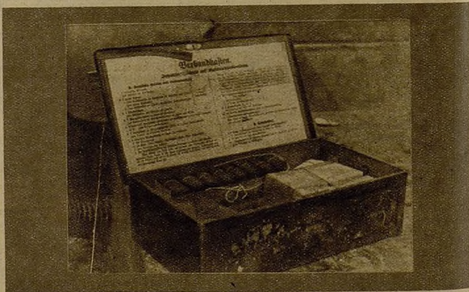
En uno de los tres tanques arrebatados al enemigo el domingo se encontró esta caja que contenía material sanitario. El tanque lo conducía un italiano. El Comité de "no intervención"—mientras tanto—continúa su vida placida y serena...