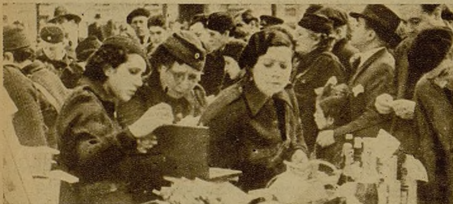
Las mujeres catalanas responden al bombardeo de los enemigos internacionales del pueblo organizando homenajes a los amigos. He aquí una tómbola instalada por ellas, pro "Komsomol"