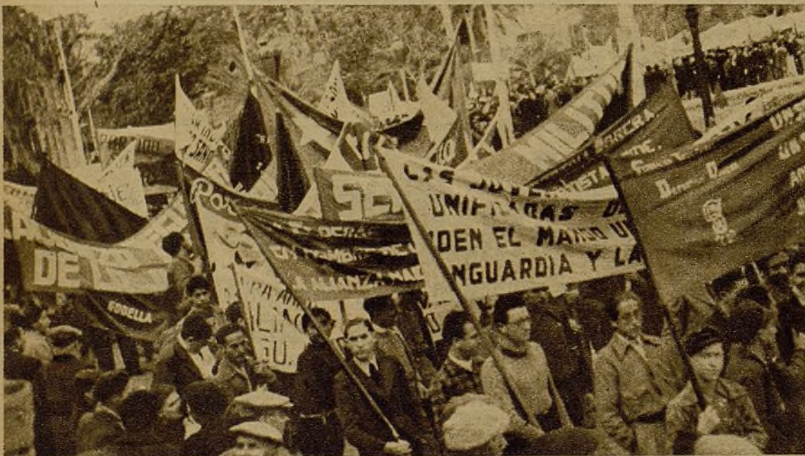
Las masas juveniles se manifestaron en Valencia con sus consignas: ¡Alianza Nacional de la Juventud! ¡Servicio militar obligatorio!