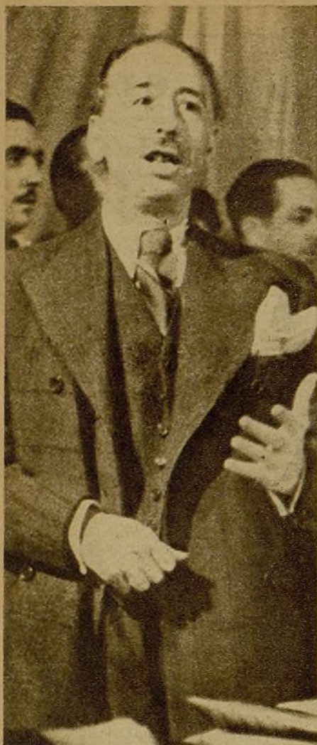
El presidente de la Generalitat, Companys, hablando en el acto organizado en Barcelona pro "Komsomol". "El pueblo ruso se lo merece todo", dijo