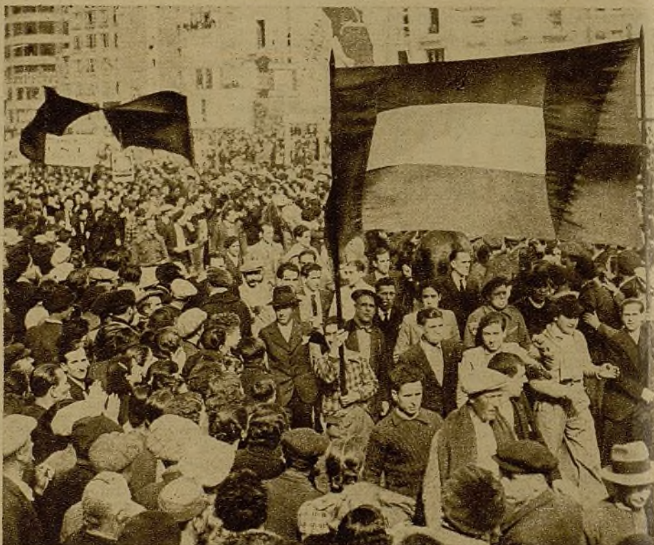
Todas las organizaciones populares expresaron en Valencia su voluntad de ganar la guerra. La bandera roja y la republicana van unidas en defensa de la democracia y de la independencia