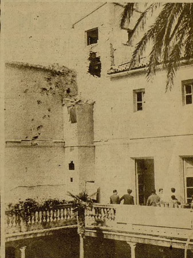
Esta Guardería infantil también fué alcanzada por la metralla de los asesinos internacionales. Desde Radio Roma se lanzó a todo el mundo la noticia de que los "nacionalistas españoles" no repararán en los medios que sean con tal de dominar al pueblo en rebeldía... Para confirmar esto, sus barcos bombardean las poblaciones—como Valencia—separadas por muchos kilómetros de los frentes de lucha...