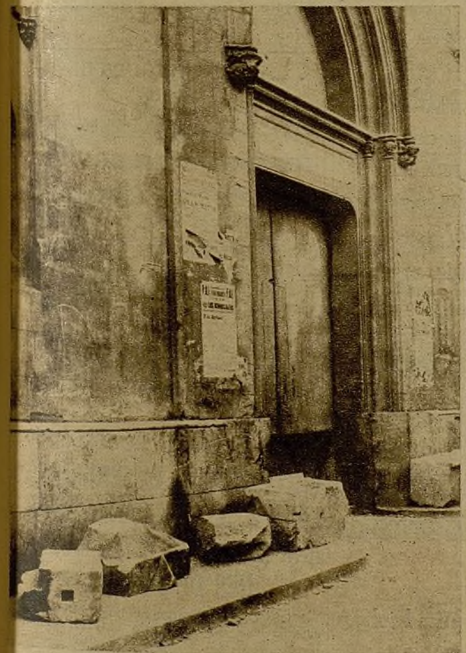
Estas enormes piedras fueron arrancadas de cuajo por los proyectiles de los buques extranjeros. Los fascistas se caracterizaron siempre por su tozudez. Por eso sus objetivos militares siguen siendo—con trágica monotonía—los mismos: los niños, los heridos y las mujeres

Como es de suponer, se han encontrado restos de los proyectiles disparados sobre la ciudad. Nosotros hemos tenido el cierre y la parte del fulminante de uno de los obuses, que pesa más de siete kilos. Se han recogido trozos lo suficiente-