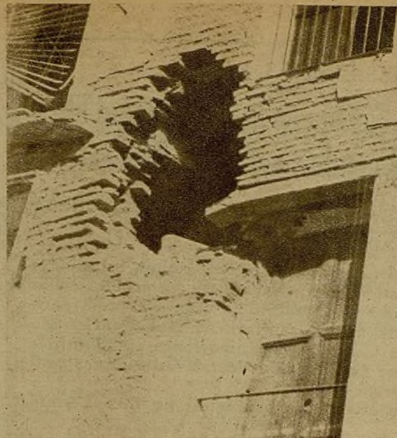
Uno de los boquetes abiertos en un edificio de Valencia por la metralla de la Escuadra de Mussolini

Es la táctica repugnante que desde el comienzo de la rebelión viene desarrollando el fascismo. Son el cumplimiento