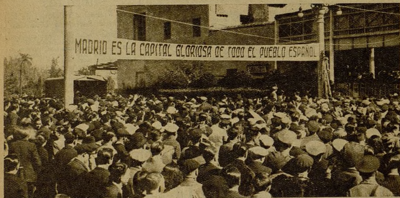
El pueblo de Valencia ha rendido un homenaje al heroico pueblo de Madrid. En el acto—celebrado en los Viveros—dió un concierto la Banda Municipal de la capital de España, que fué acogida por las aclamaciones entusiastas del pueblo levantino