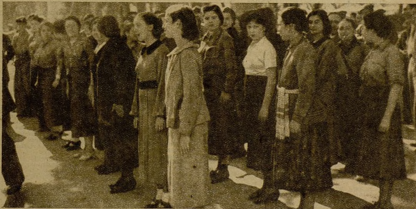
Las muchachas, las mujeres, también incorporaron su entusiasmo a la movilización del domingo en Valencia. La mujer sabe que de la República popular depende su futuro. El porvenir de la mujer en el fascismo es un porvenir de prostitución. En la República popular es la alegría, la igualdad de derechos, el pan ganado dignamente, la cultura

El domingo, en Valencia, lo ha dicho y lo ha realizado entre la honda emoción de la ciudad.