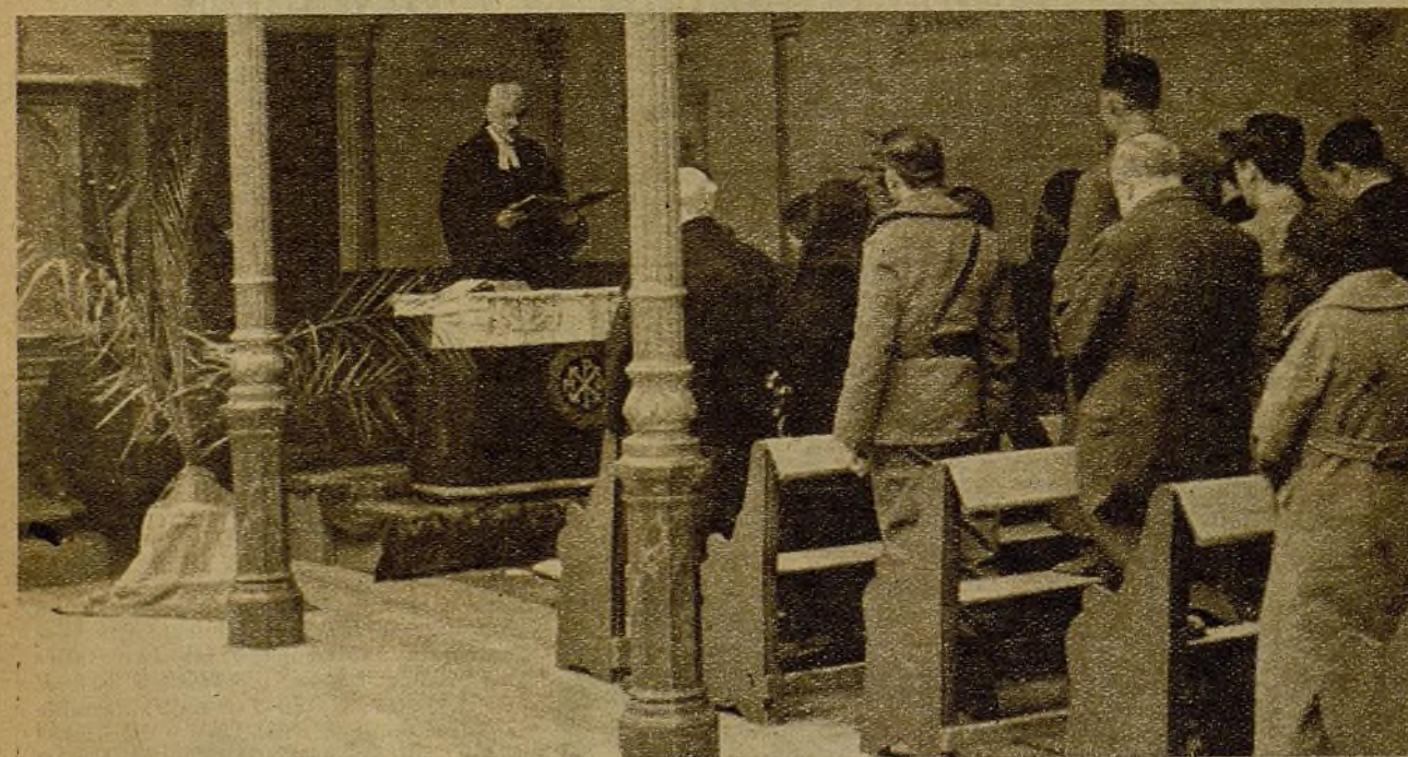
MISA EN MADRID.—Todos los domingos estos fieles protestantes celebran su misa, con toda devoción, en una capilla Evangélica de la capital en guerra. El estampido de los obuses, que estallan a menudo cerca de la capilla, no distrae la atención de los devotos; pero sirve para recordarles que—al otro lado de nuestras trincheras—unos hombres traidores continúan su labor tenaz de asesinato, agresión y guerra, en nombre de una religión que ellos mismos ultrajan y desprecian con sus crímenes...