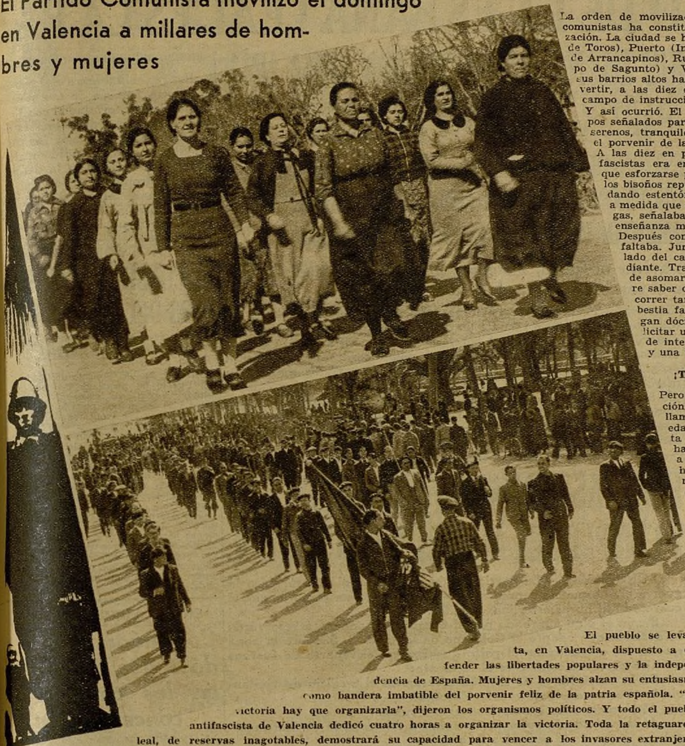
El pueblo se levanta, en Valencia, dispuesto a defender las libertades populares y la independencia de España. Mujeres y hombres alzan su entusiasmo como bandera imbatible del porvenir feliz de la patria española. "La victoria hay que organizarla", dijeron los organismos políticos. Y todo el pueblo antifascista de Valencia dedicó cuatro horas a organizar la victoria. Toda la retaguardia leal, de reservas inagotables, demostrará su capacidad para vencer a los invasores extranjeros

El Partido Comunista lo ha dicho. Las Juventudes Socialistas Unificadas han conseguido llevarlo a la entraña del pueblo antifascista... "Valencia no es una ciudad al margen de la guerra monstruosa que los militares rebeldes han desatado sobre España..." "El frente donde la juventud defiende las más puras esencias de la democracia sólo dista del Turia 150 kilómetros..." "La perla del Mediterráneo, la Meca del republicanismo hispano ha sentido en su carne el zarpazo asesino de los obuses lanzados entre tinieblas por los piratas facciosos..." "Valencia: no permanezcas un minuto más hundida en una absurda indiferencia..." "Piensa que la guerra la tiene que ganar el pueblo con su sacrificio y su heroísmo..."