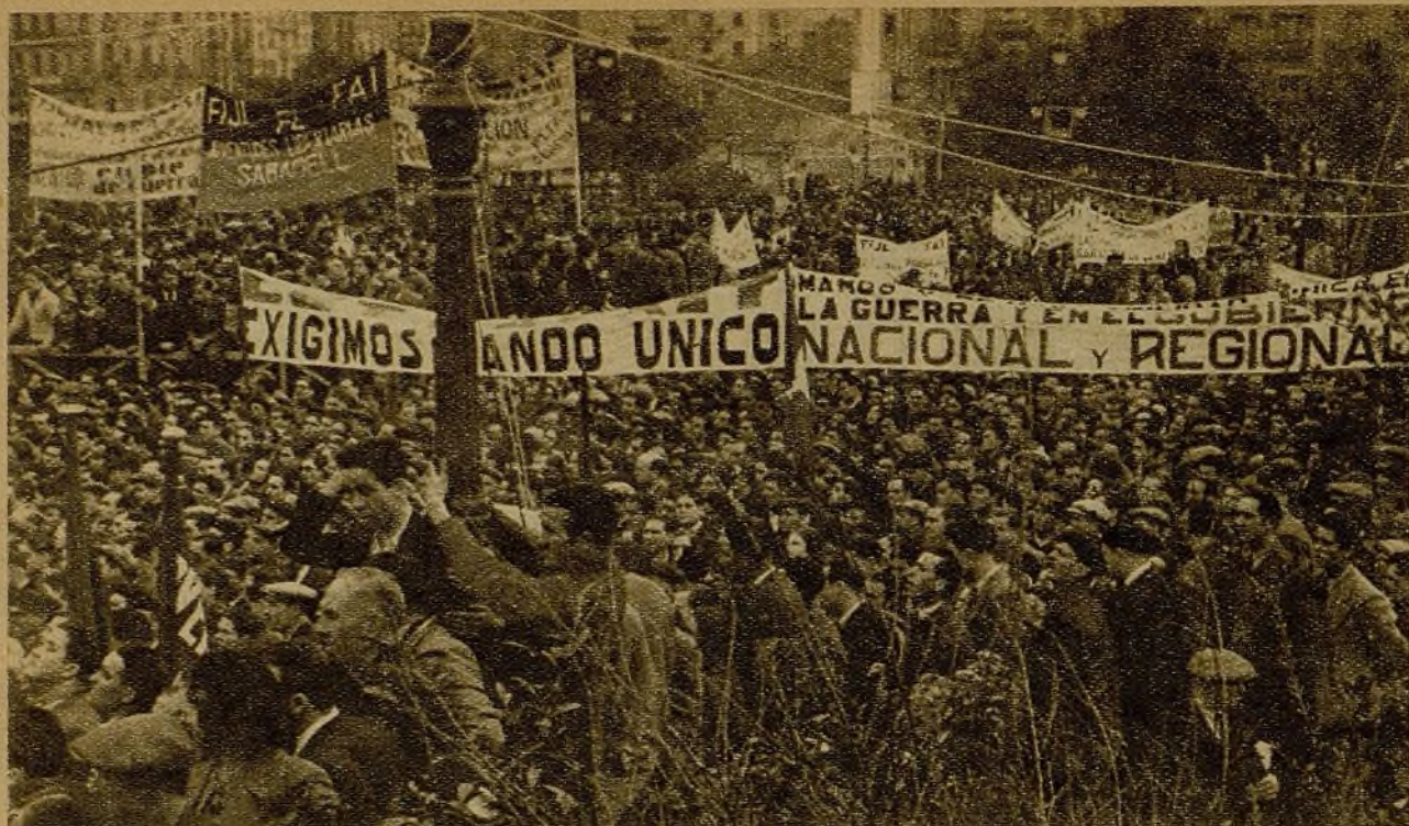
En Barcelona las Juventudes libertarias llenan las calles con una manifestación imponente. En grandes transparentes piden movilización, y le gritan a la juventud catalana: "Ante lo sucedido en Málaga, ¡juventud, en pie de guerra!" Otra de las pancartas dice: "Exigimos el mando único." Las consignas de la victoria son aclamadas por el pueblo