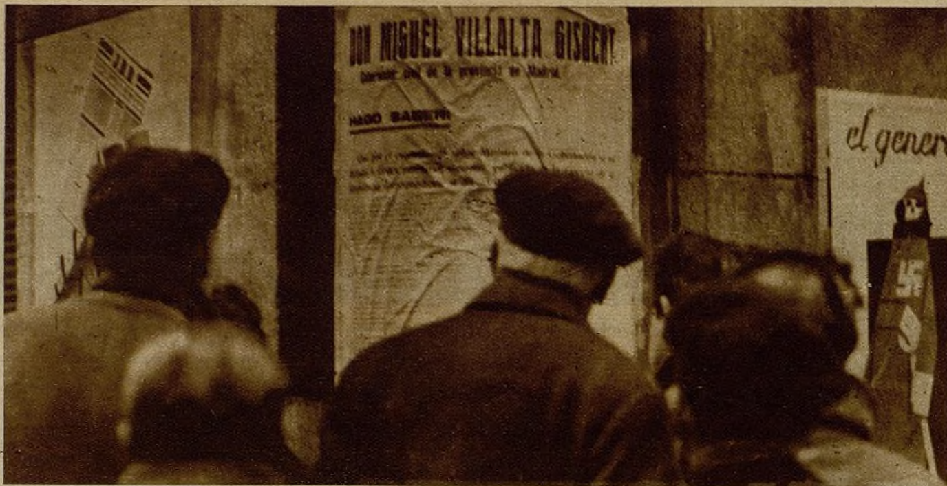
En la guerra por la independencia de España, todos los españoles deben aportar su esfuerzo. El gobernador de Madrid comunica al pueblo la obligación que tiene todo ciudadano de demostrar su utilidad a la causa de la patria, exhibiendo su Carta de Trabajo