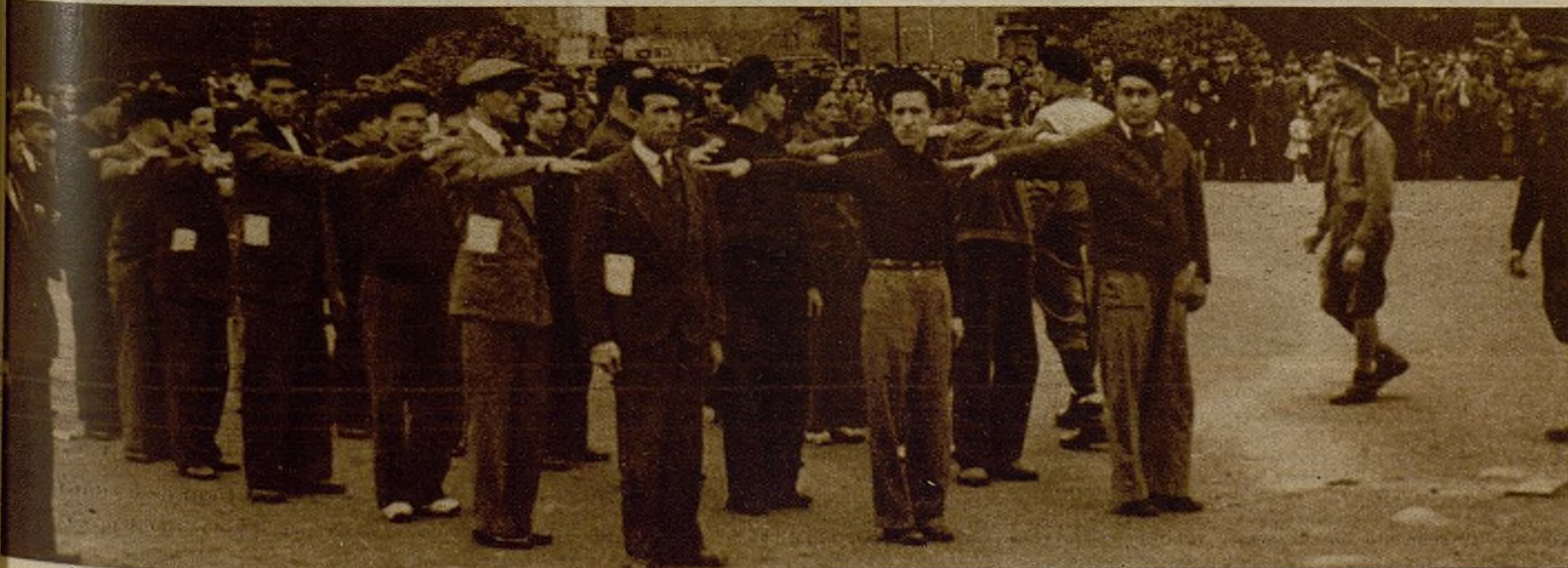
¡A las armas los hombres útiles! Las juventudes, a la vanguardia de la movilización, organizan la instrucción militar en paseos y ramblas