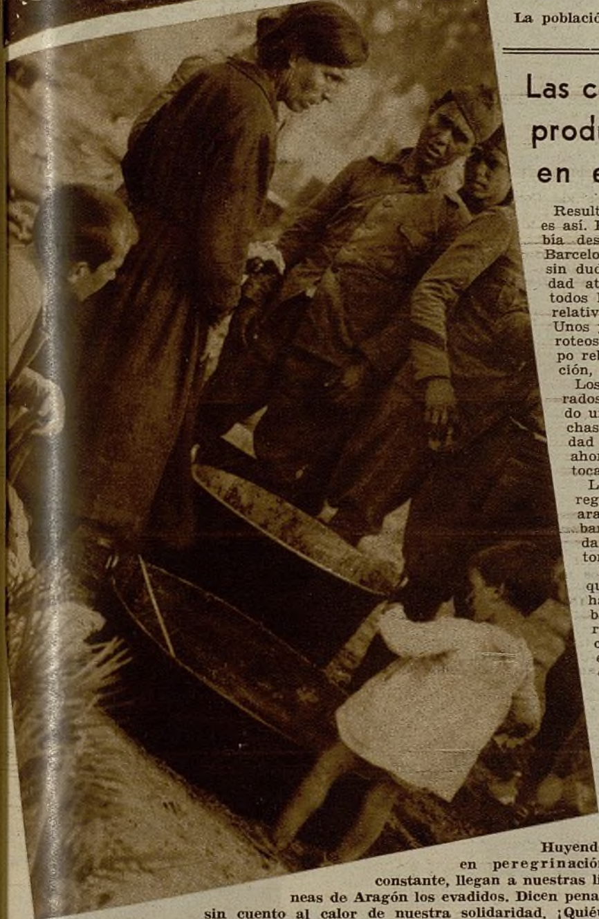
Huyendo en peregrinación constante, llegan a nuestras líneas de Aragón los evadidos. Dicen penas sin cuento al calor de nuestra solidaridad. ¿Quién sabe cuántos asesinatos registraron sus ojos!