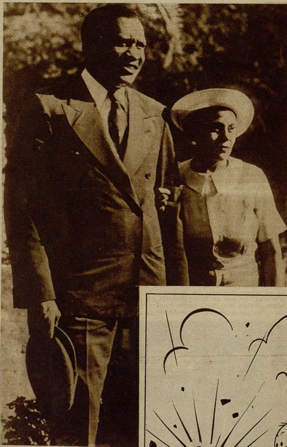
Paul Robeson, el gran artista negro y uno de los mejores cantantes de ópera, intérprete del drama de Eugène O'Neill "El emperador Jones", a su llegada al Cairo, donde se propone filmar su nueva creación, "Jericó". Reside en la Unión Soviética y milita en el Partido Comunista. Tiene un hijo, "Komsomol", que vive en el país feliz de los Soviets, donde no existen prejuicios raciales y donde el arte no tiene fronteras