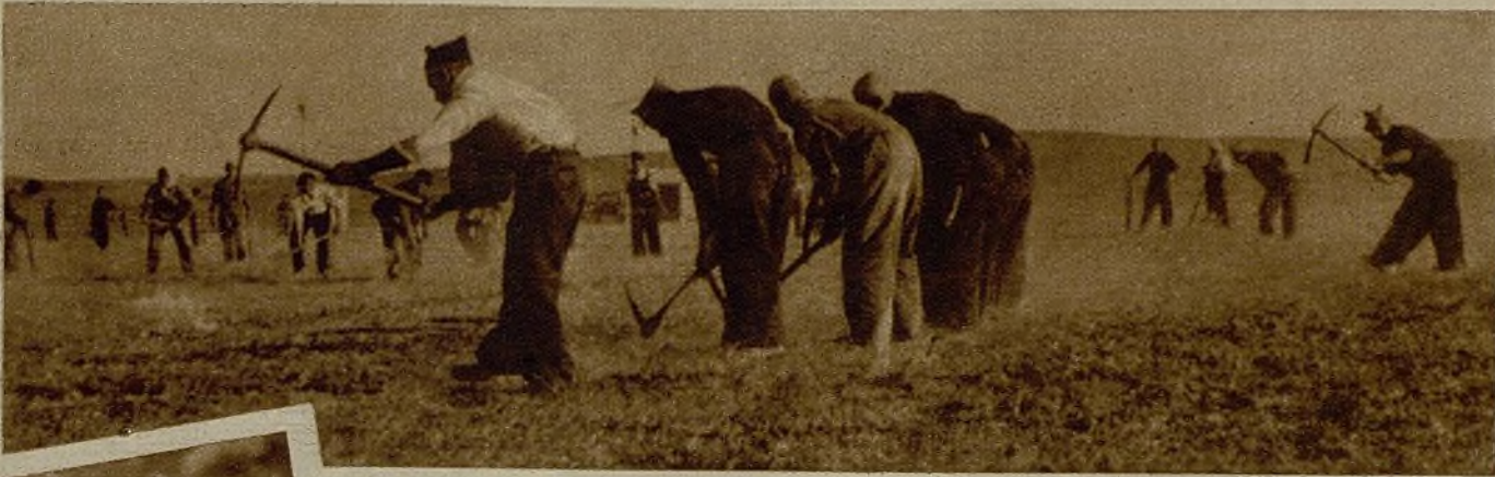
La población antifascista de Cataluña se moviliza. Barcelona da la tónica. Millares de hombres se preparan militarmente, hacen trincheras y refugios