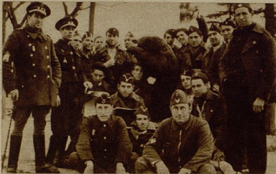
La gloriosa 17 Compañía de Asalto ha abierto una colecta para el órgano de la juventud. AHORA agradece el entusiasmo de estos compañeros