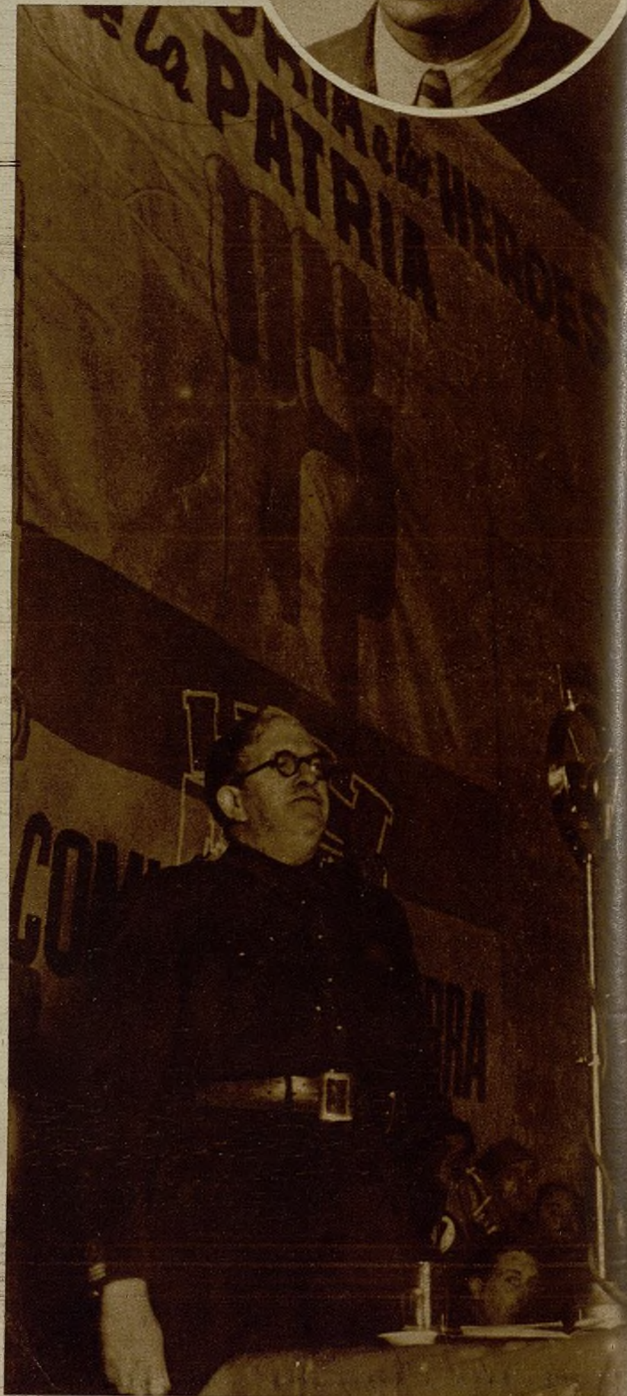
El ministro de Estado del Frente Popular y comisario general de Guerra durante su cálida intervención en el acto de homenaje al Comisariado de guerra

Nombre y apellidos: ..... Domicilio: ..... Edad: ..... Sindicato: ..... Oficio: ..... Lugar de trabajo: ..... Brigada: ..... Batallón: ..... Compañía: ..... Grado: ..... Frente de ..... Sector de ..... de ..... de 1937. (Firma.)