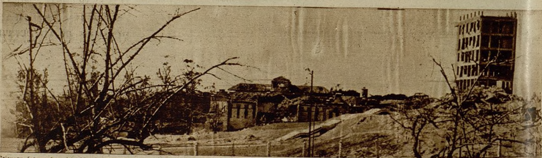
Primera fotografía obtenida del Instituto Rubio. A su derecha se ven los restos del Hospital Clínico. En esta parte derecha ejercen su dominio nuestros soldados, que se batan como leones contra los invasores. El enemigo se estrella en sus intentos contra la firmeza de nuestro Ejército