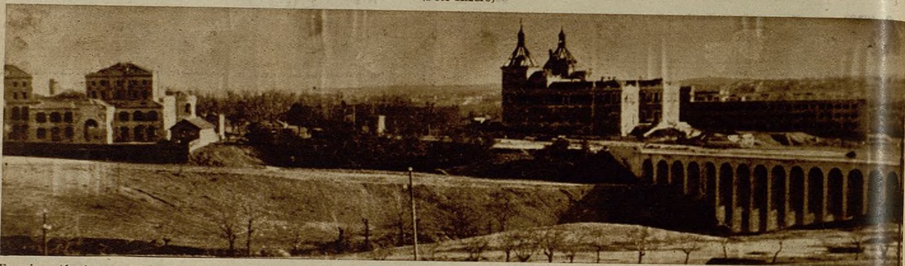
En primer término, el edificio de Ingenieros Agrónomos. A la derecha, una nueva vista de la Casa de Velázquez, desde la parte de Puerta de Hierro. Esta gran puerta de entrada a Madrid no ha sido hollada por las botas alemanas. Ni lo será. Jefes jóvenes, soldados disciplinados, han contraído este compromiso de honor con el pueblo de Madrid