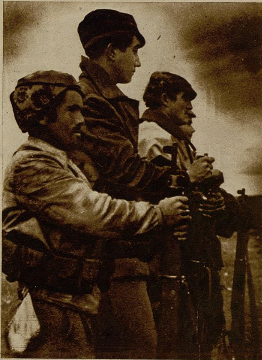
La noche comienza a llegar sobre las lomas y los olivares del Jarama... La mura- lla firme del Ejército del pueblo continúa su alerta entre el viento frío. Los altavoces de propaganda empiezan a gritar en las trincheras... A la derecha—por la Mara- ñosa—las ametralladoras han comenzado su discusión...