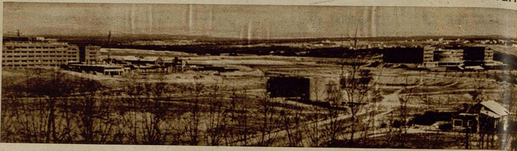
OTRA VEZ COBRA ACTUALIDAD LA CIUDAD UNIVERSITARIA. —Después de los recientes combates, donde nuestras tropas mejoraron sus posiciones, permite al fotógrafo la obtención de esta panorámica, en la que se ven los edificios de la Facultad de Filosofía y Letras y, a su derecha, la de la Facultad de Derecho