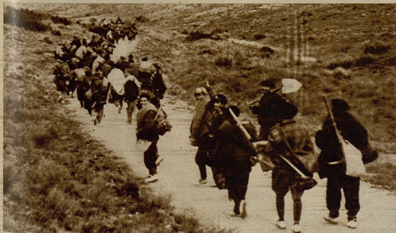
Estos hombres altos, que llenan los caminos de Arganda y de Morata, son los fortificadores. Nuestro Ejército ha hecho conquistas por dos flancos. Ellos vuelven ahora, al atardecer. Vienen de marcar—con sus palas y sus picos—el mapa de nue- tras líneas

Cuando estoy ante Líster le digo: —Comandante. Yo creí que habías muerto. Oí en Radio Salamanca que el cadáver de un famoso general extran- jero, apellidado Líster, había sido recogi-