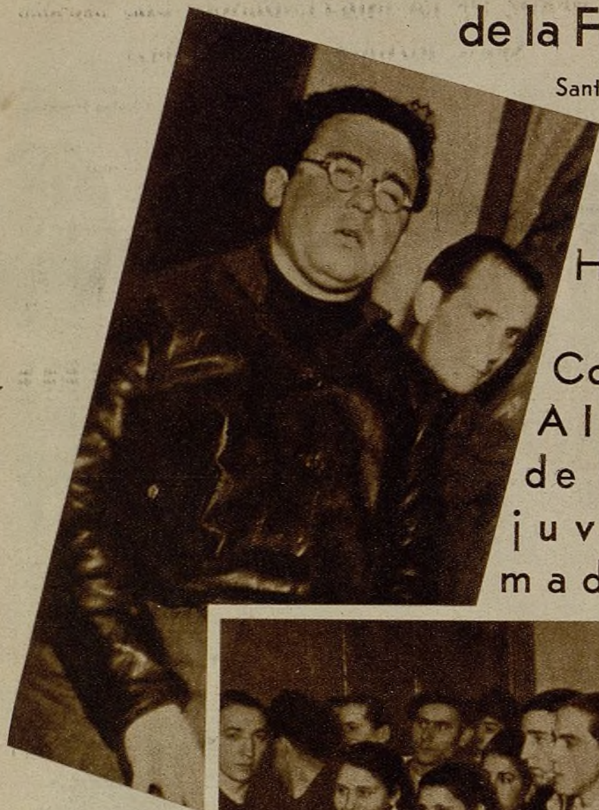
Santiago Carrillo, secretario general de la Comisión Ejecutiva de la Federación Nacional de Juventudes, se dirige a la juventud madrileña, saludándola por su heroísmo, su entusiasmo y su capacidad de trabajo. Sus palabras serán un estímulo para todos nuestros activistas

Hacia el Congreso Alianza de toda la juventud madrileña