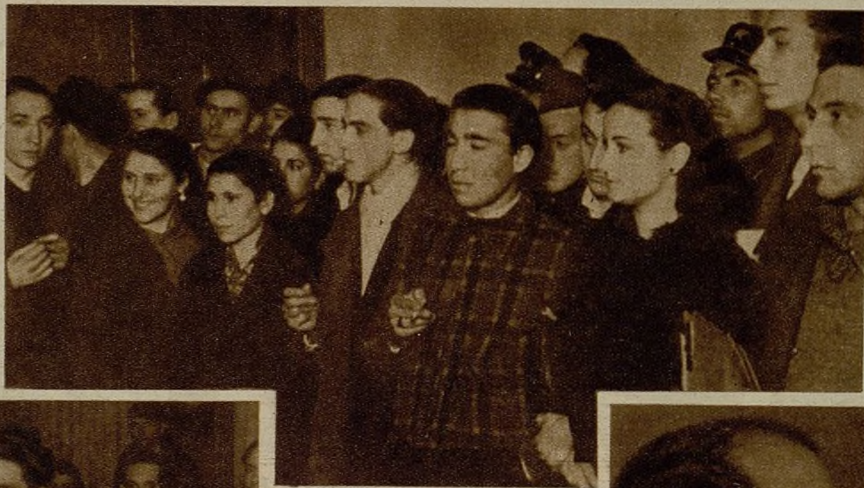
A la Asamblea de activistas de la Juventud Socialista Unificada Madrileña asistieron los héroes anónimos de nuestra organización. Muchachos y muchachas—nuestros mejores cuadros—, que día a día van construyendo la victoria, siguen la línea que se marcó en la Conferencia Nacional