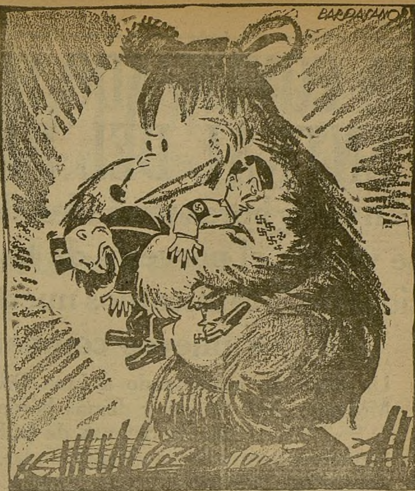
El abrazo de Vergara

Hoy la lealtad, capacidad, la garantía efectiva de una organización se mide por el comportamiento de sus hombres en la retaguardia y en el frente, por su disciplina, por la orientación que se ha comprobado como justa. A esto le llamamos nosotros política, y por ello somos políticos sin segundas intenciones. Y ésta es la política de claridad, que debe presidir la actuación de todos. Quien vaya contra ella sigue una política de maniobra contra la victoria.