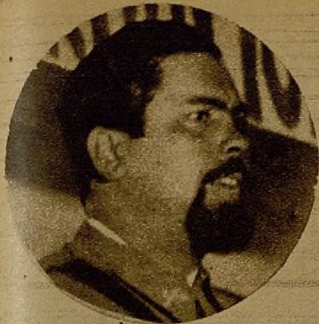
Valentín González, "el Campesino", hablando en el acto dedicado por el Socorro Rojo Internacional a los caídos por la defensa de la Patria. El público escucha entusiasmado a este guerrillero de nuestra independencia