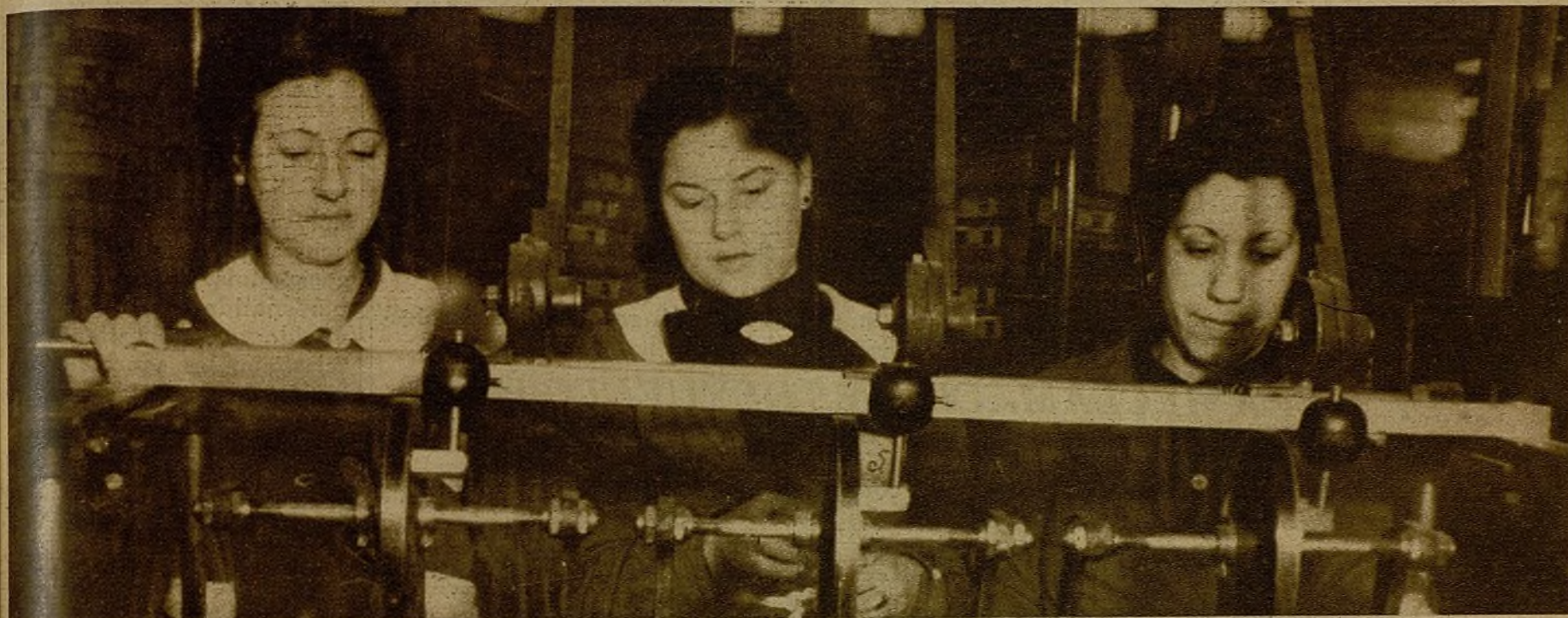
La fábrica de la juventud

Una mañana precisa, concreta, se encontraron con la fábrica en las manos. Unos se fueron al frente, a defenderla. Otros quedaron en los talleres para que las máquinas siguieran rodando, dando lentos chillidos al parir jerseys, camisas, lienzo. Al pie de las máquinas, 300 muchachas tejían el porvenir. Hay la misma alegría que en el frente de guerra. En los dos sitios hay en cada corazón un crecido orgullo de luchar por algo muy grande, muy alegre, muy joven: por un mundo mejor.