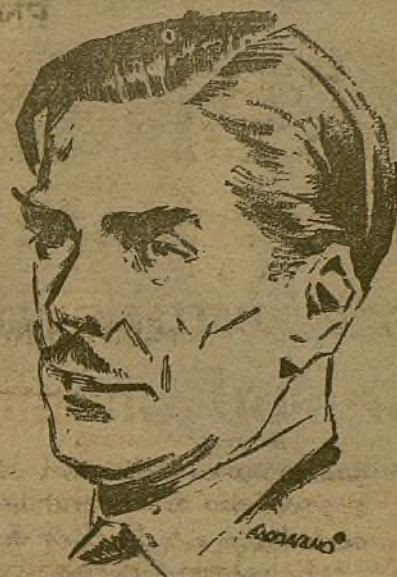
Mister Eden ha hablado en la Cámara de los Comunes de actos "vandálicos" cometidos por los facciosos. Y tan vandálicos. Como que son vandálicos precisamente quienes los cometen

El "Times" seguramente ha sido recogido por un artículo que publicó detallando el material terrestre y marítimo que los Gobiernos de Italia y Alemania han facilitado a los rebeldes de Franco.