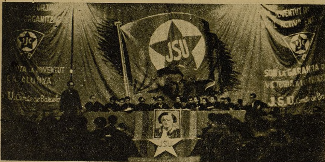
Bajo la consigna de la gran Conferencia de Valencia, la juventud de Barcelona ha celebrado su conferencia local. Trincheras, campos y fábricas estuvieron allí representados por los mejores combatientes, los mejores jóvenes de las brigadas de choque. La juventud barcelonesa siguió, minuto a minuto, los acuerdos de la Conferencia y se dispone a cumplirlos para acelerar la victoria. ¡Adelante, jóvenes de Barcelona! ¡Por la Alianza Nacional de la Juventud!