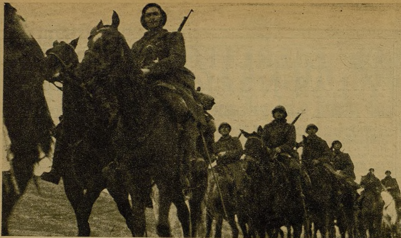
La gloriosa Caballería del Ejército republicano, que en el Jarama y en Guadalajara bate constantemente las líneas facciosas con gran arrojo y heroísmo. Algún día se sabrá el valor, la disciplina, el espíritu de sacrificio de estos valientes luchadores de la causa popular. Junto con la Aviación, la Artillería y la Infantería, nuestros "caballeros" son el terror de los "macarronis" de las bandas "nacionales"