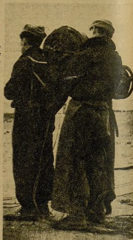
Entonces soldados de Lister, que pelean contra los invasores en uno de los frentes más duros, están los de la Sección de Transmisiones, valientes entre los primeros, que colaboran con abnegación en los mejores aciertos de la campaña