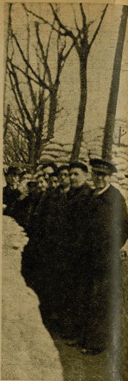
Los senadores belgas Neves y Van Egdonet, con otros representantes de su país, han llegado a Madrid para conocer nuestra lucha y buscar los medios de que la ayuda a los defensores de la libertad sea lo más eficaz y rápida. Aquí aparecen visitando las trincheras de uno de los sectores