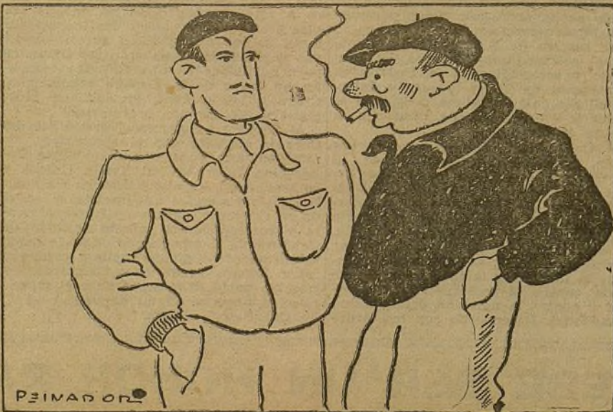
—¿Pero tú tienes ya la carta de trabajo? —No. Pero tengo el trabajo de buscar la carta.

BERLIN, 15.—El avión postal de servicio al África del Sur ha caído en las cercanías del río Gambia, pereciendo sus cuatro tripulantes.—Fabra.