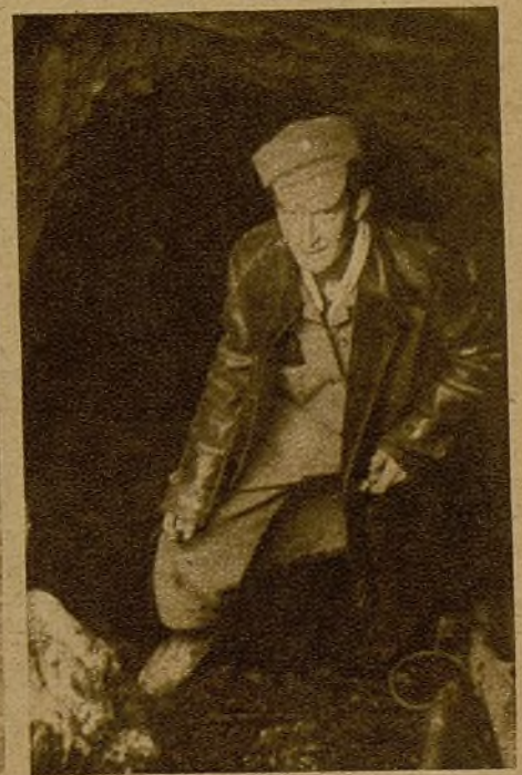
Trijueque está sobre un dedalo de cuevas, a manera de bodegas, profundas. En ellas permanecieron las mujeres del pueblo escondidas, mientras los italianos acamparon allí. De ellas hubo que sacar a los italianos, que se escondían de nuestros soldados