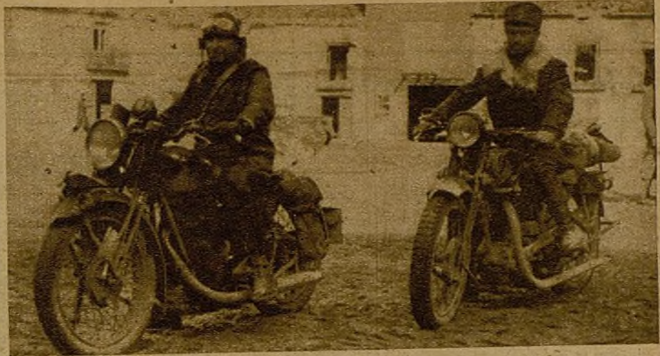
Los valientes de la "motorizada" hacen honor a sus héroes en todos los frentes. Pero en el de Guadalajara superaron su entusiasmo y llegaron adonde fué preciso, dando muestras de su heroísmo