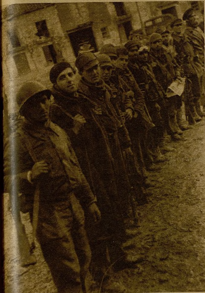
Valientes de Trijueque. Cada nombre, una página heroica. Cada acción, un ejemplo de lo que puede hacer un pueblo cuando lucha por su libertad y por su independencia. Cuando defiende su vida y su territorio