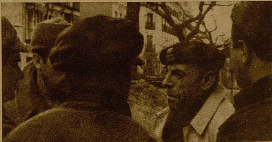
En la mañana cruzada de tiros, los jefes, los enlaces, los telefonos y las ordenes no descansan un solo segundo. El heroico teniente coronel Ortega (¡los madrileños se saben bien su nombre!) cambia impresiones, durante la batalla, con varios oficiales y comisarios del sector