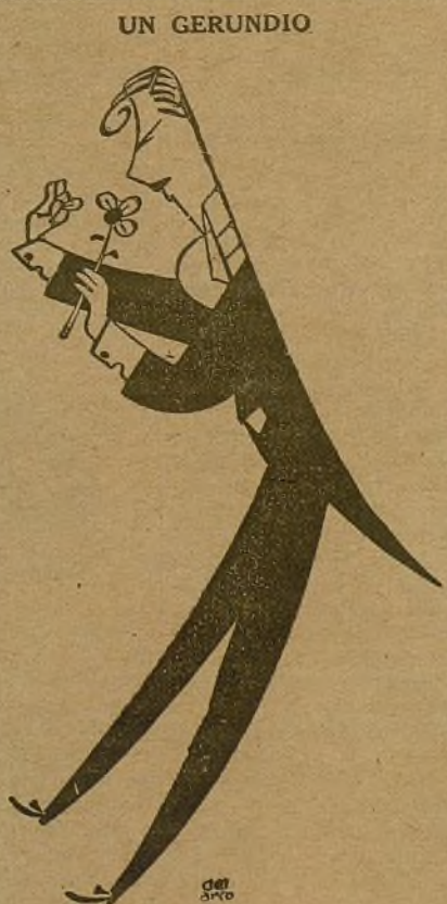
Mister Eden, mariposeando...

"Yo puedo afirmarle a usted que el pueblo inglés, que llenaba el teatro donde se celebraba el acto, respondió vibrante y unánime a estas palabras pidiendo a gritos aviones y armas para la España republicana como medio eficaz para aplastar al fascismo internacional."