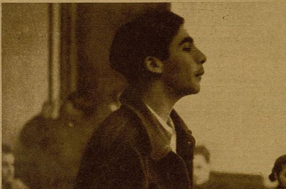
Ginobas llevó al Monumental—repleto de un público encendido—la palabra de la J. S. U. La palabra de esta juventud de España—que da el ejemplo seguro de unión—y que marca en la Alianza Nacional de la Juventud, el camino cierto de la victoria