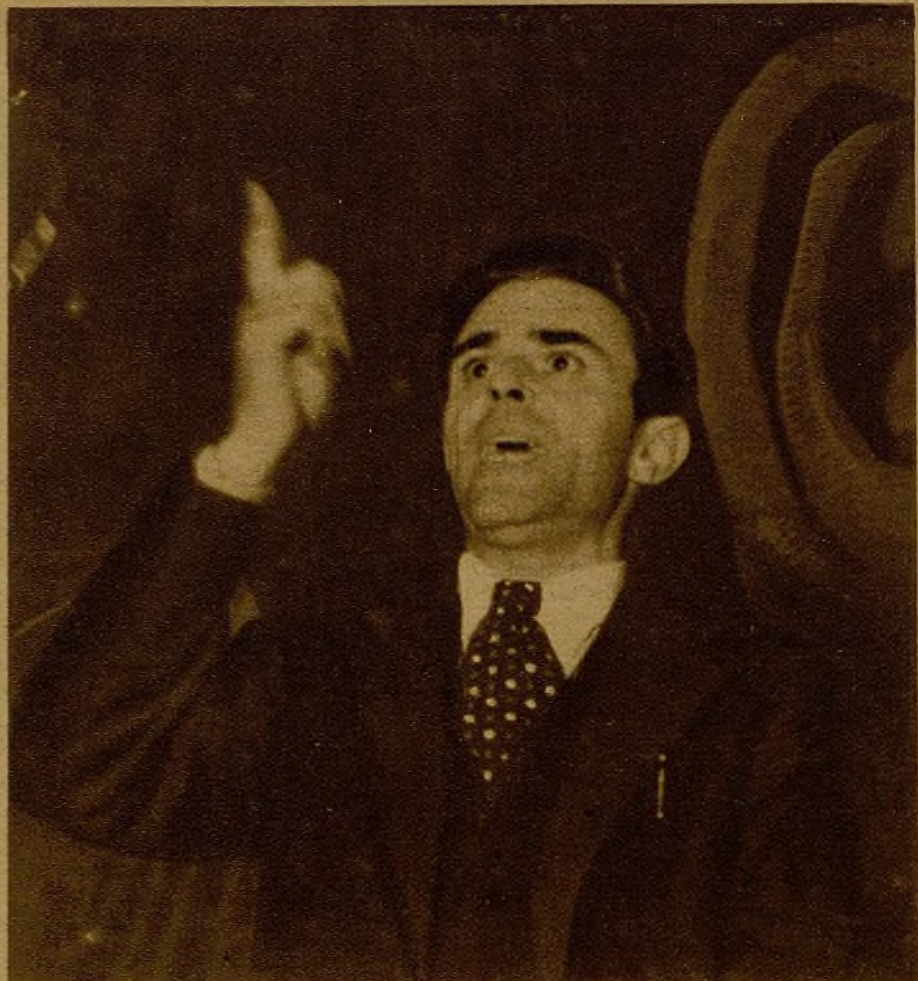
"El enemigo que se levantó el 18 de julio no se alzó sólo contra los comunistas. Se levantó contra todos los partidos del pueblo, contra el régimen mismo que se había dado el pueblo..." Habla José Díaz, secretario general del Partido Comunista