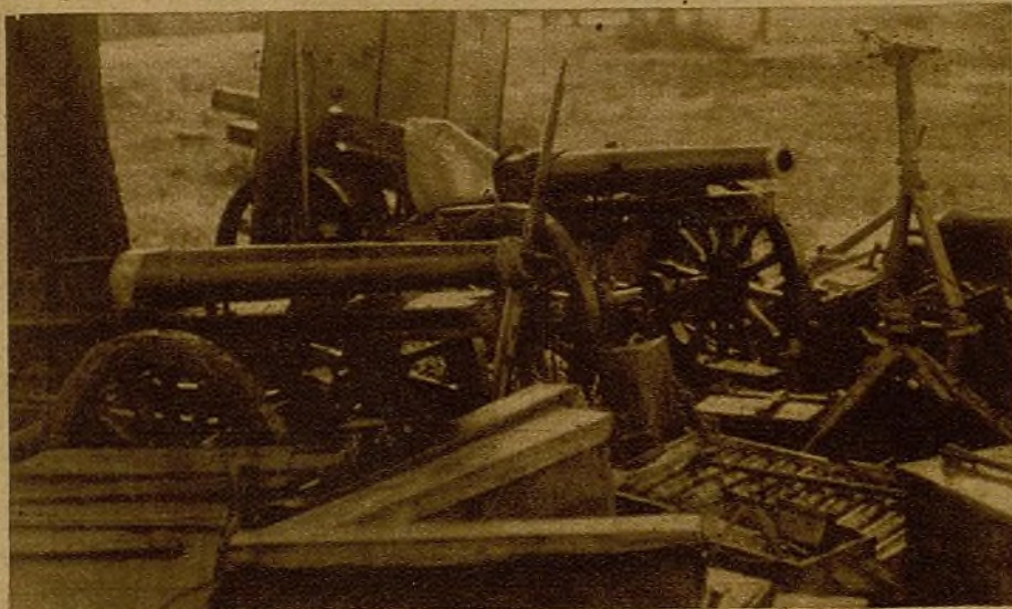
No se puede calcular fácilmente la cantidad de armas abandonadas por el invasor en su huida. Como este cañón hay muchos, muchos...