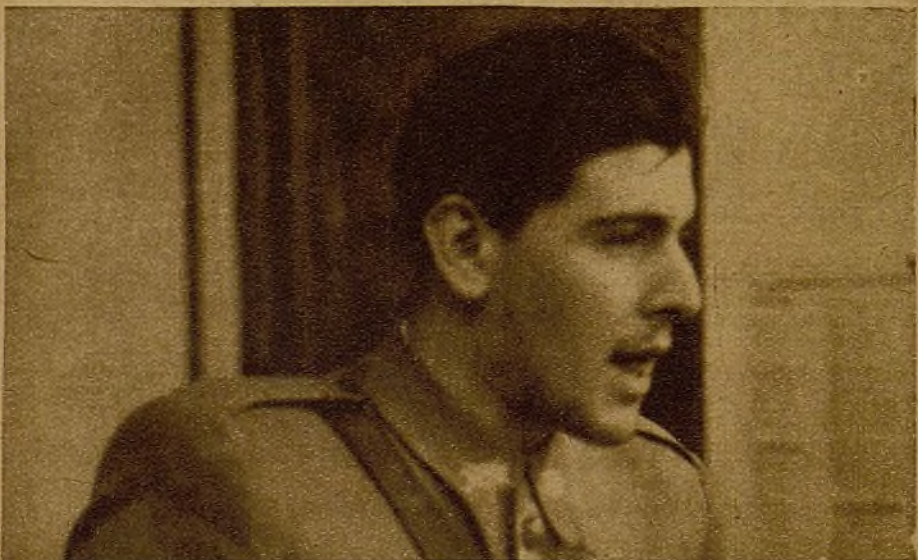
Rafael Carrasco—el heroico comandante joven—habló por los jóvenes defensores de nuestras mejores trincheras. Su voz fué la voz llena de honor de unos combatientes que han sabido clavar, ante los dientes del enemigo, su bandera implacable de heroísmo