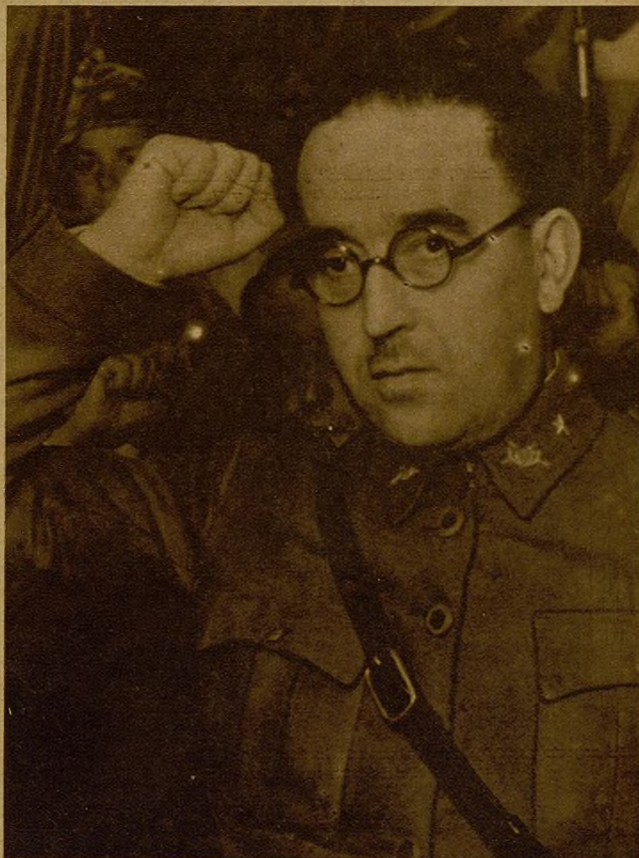
Ayuntamiento de Madrid