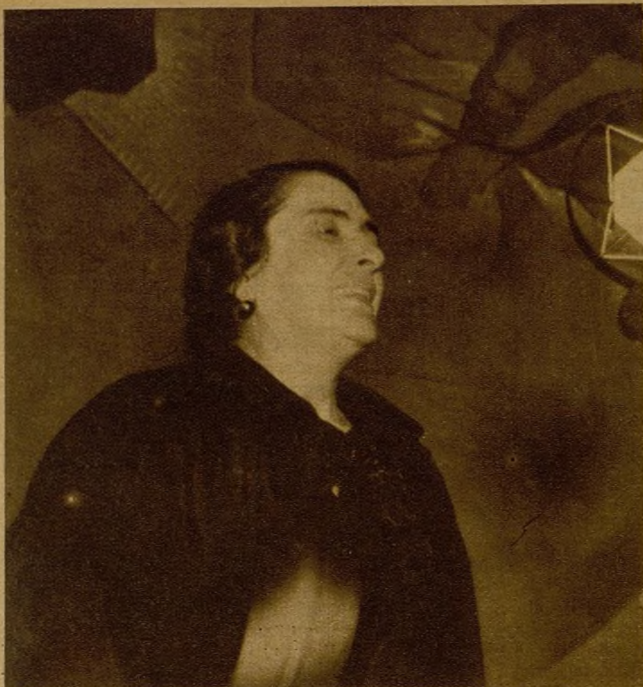
"Pasionaria"—la voz emocionada que levanta al pueblo—habló el domingo, en el mitin que el Comité Provincial del Partido Comunista celebró en el Monumental. "¡Pueblo de Madrid!—concluyó—, tú que has sido el baluarte de la defensa heroica, sabrás ser también el baluarte de la unión de las fuerzas antifascistas..."