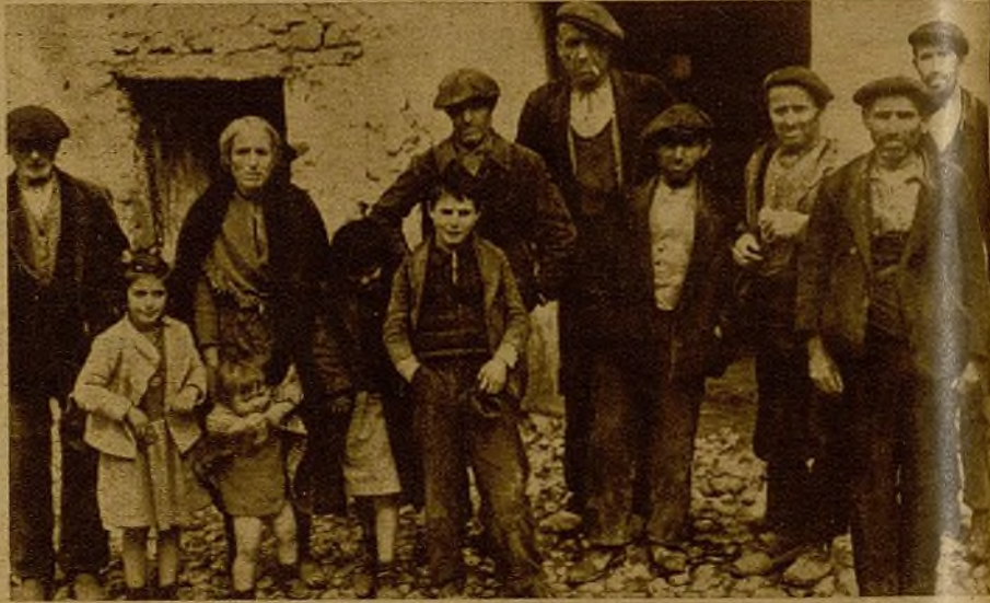
Las familias de los pueblos libertados recibieron a nuestro Ejército con vivas emocionantes. Y muera a Mussolini