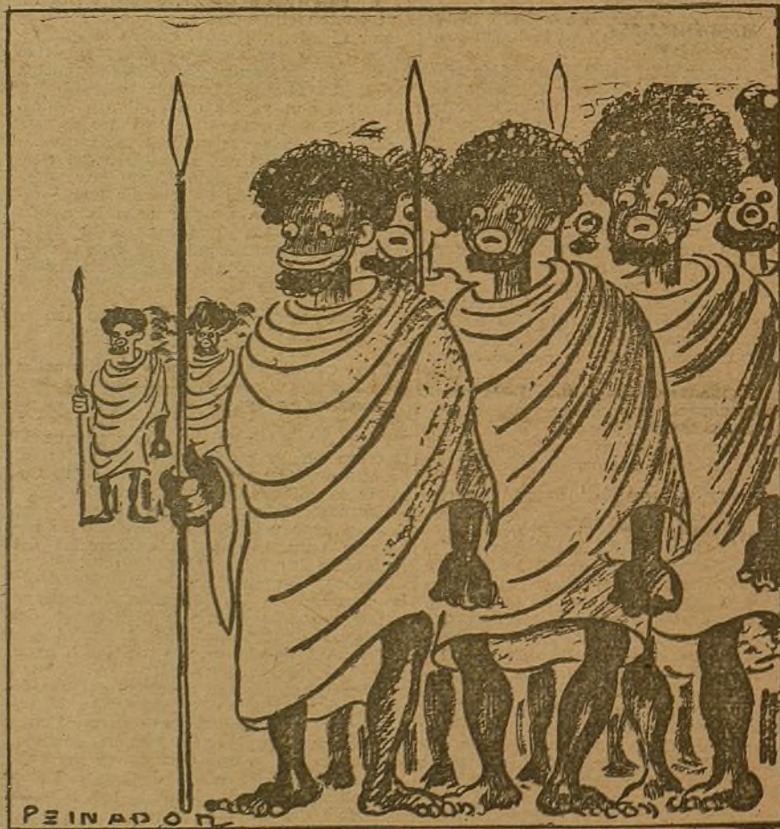
"Mussolini ha enviado a España 400 soldados etíopes." (De la Prensa.) —¡Más fuerzas nacionales!

MILAN, 23.—La noticia de que Toscanini fué invitado a dirigir la orquesta con motivo de celebrarse el LXX aniversario del teatro Scala, ha sido desmentida por el superintendente. Como se sabe, el ilustre director no había vuelto a actuar al frente de ninguna orquesta italiana desde que en 1931 se promovieron ruidosos incidentes, por negarse a que la orquesta que dirigía interpretara el himno fascista.—Fabra.