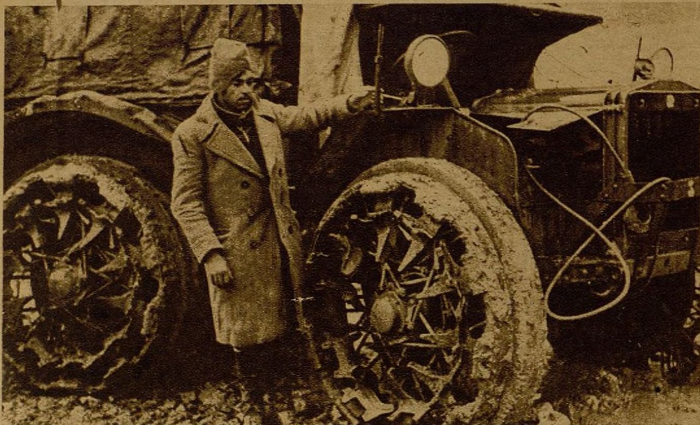
Como este camión-tractor, Mussolini ha perdido muchos más. Sus ruedas, llenas de dientes, querían clavarle más adelante, en el corazón mismo de España. Pero algo con lo que no contaba el tirano de Italia se ha alzado contra los invasores...