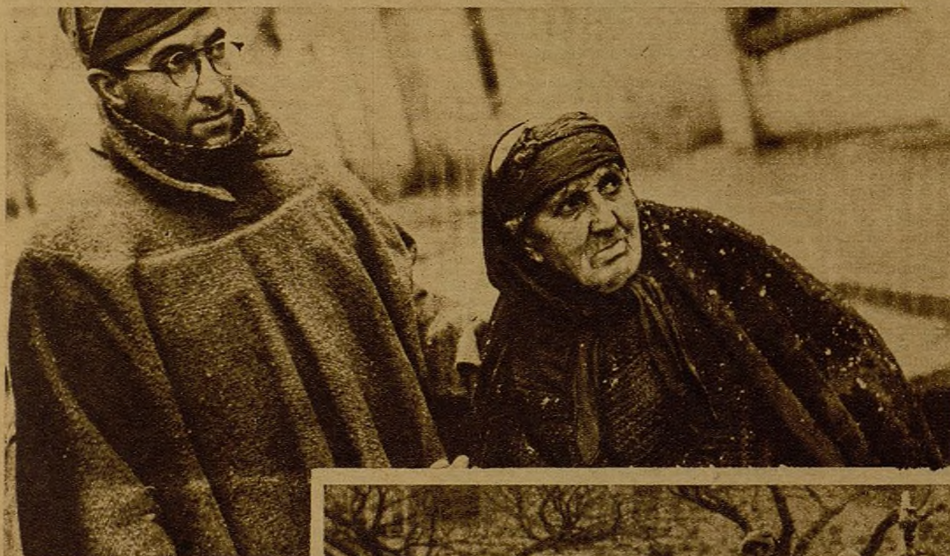
El Ejército de la libertad, el Ejército del pueblo ha entrado en Brihuega. Esta vieja campesina—llena de dolor y de ira—pide a gritos justicia contra los asesinos. La aviación del crimen ha querido vengar la carrera loca de su infantería despanzurrando con sus bombas las mujeres, los viejos y los niños del pueblo que se ha visto, de pronto, envuelto en el horror trágico de la guerra...