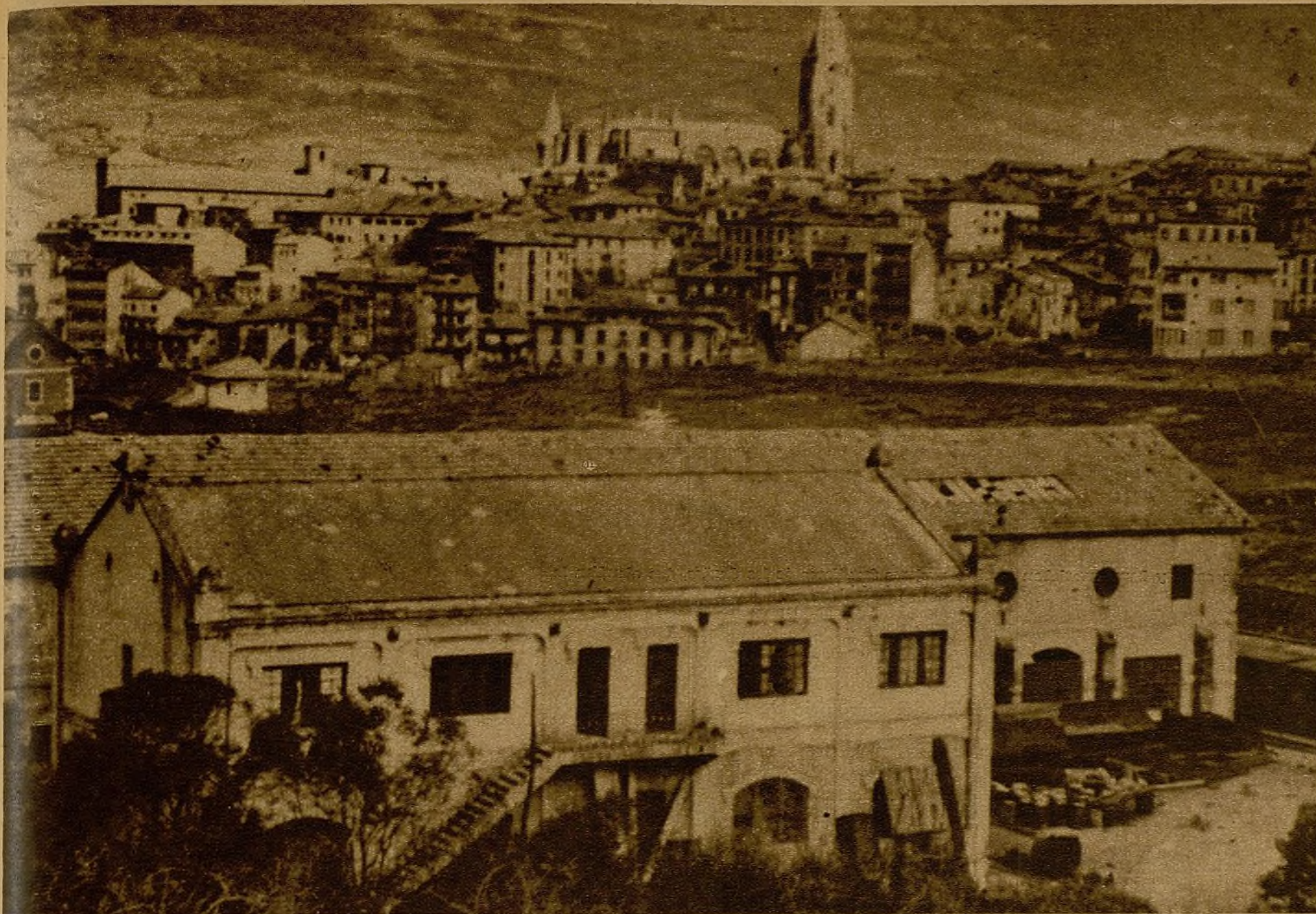
Torres altas de Oviedo bajo las nubes, cargadas de agua y de frío, malas enemigas para los hombres de Asturias que quieren seguir hacia adelante... Desde Santo Domingo—dura conquista a fuerza de dinamita y bayonetas—se ve así la ciudad y la estación, acibullada, del ferrocarril vasco, que está en primer término...