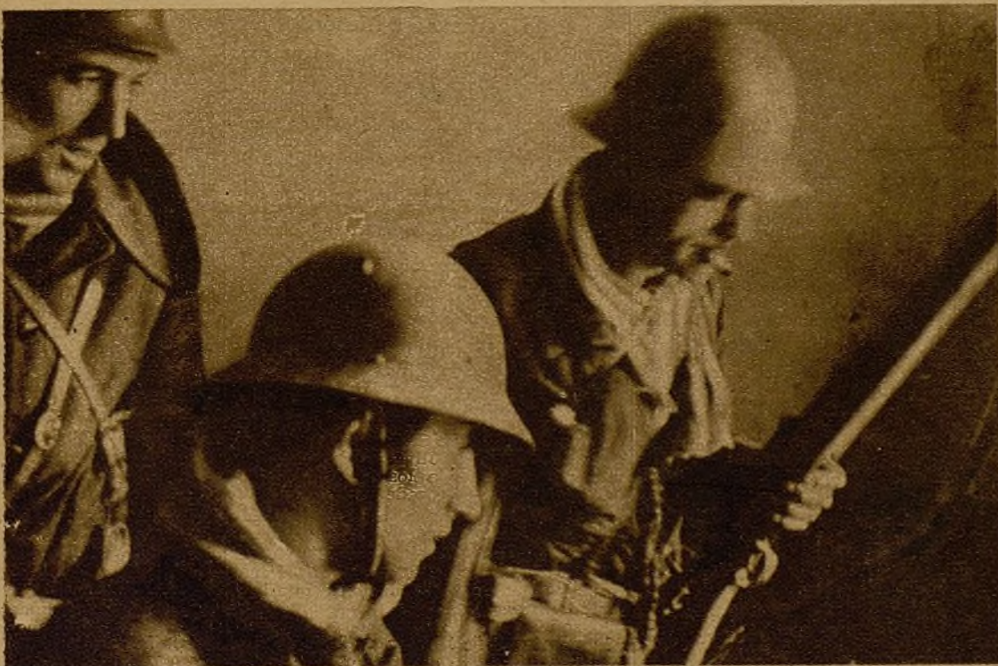
Mineros jóvenes. Héroes alegres y lejanos de Asturias... Tiros entre la lluvia, desde la ventana de una casa de la Tenderina...

Nuestros milicianos se desbordan dando gritos. Un avance rapidísimo, desplegados en perfecto orden. Las máquinas de