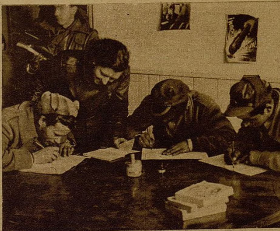
Un Hogar del Soldado. Todos los jóvenes soldados, de todas las ideologías, se unen en el Hogar del Soldado para hacer de cada combatiente un luchador consciente, culto, disciplinado. En él, los jóvenes guerreros adquieren, unidos, los conocimientos necesarios para ser más útiles a su pueblo