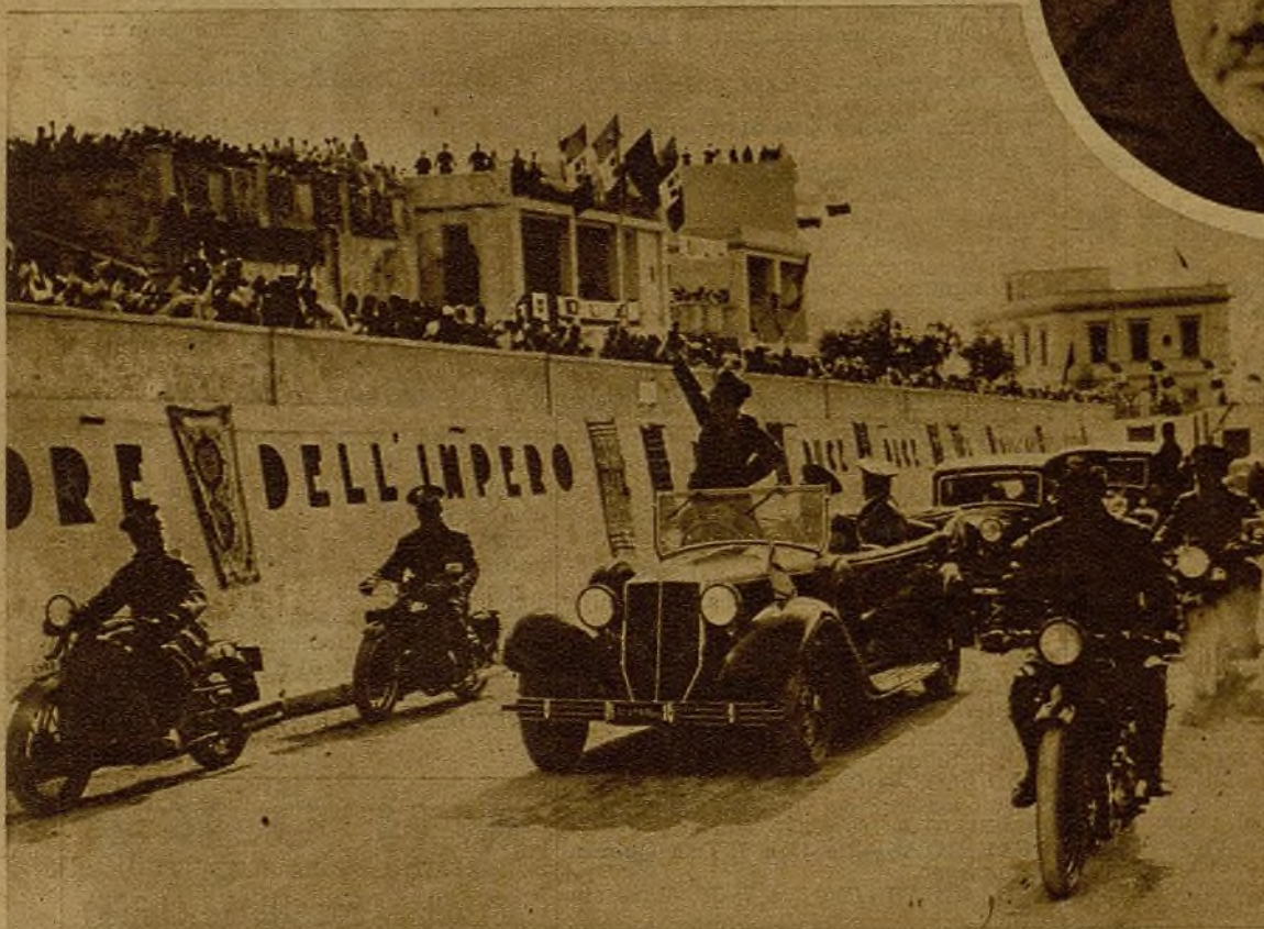
Benitto, el criminal tragicómico que invade España, pasa revista a sus lacayuelos de Libia. Aquí está haciendo uno de sus números especiales para colonias: ir de pie en automóvil haciendo curiosos equilibrios imperiales. A lo mejor, en el mismo instante en que corrian sus soldados por la Alcarria