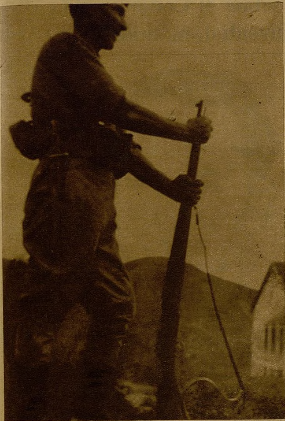
La fuerza y la audacia de los mineros se alza frente al Ejército de los traidores a la Patria. Este soldado hace guardia—erguido de orgullo—junto a una casa recién conquistada. Al fondo, las lomas que cuelgan del Naranco, escenario de duras batallas...

(Crónica de nuestro enviado especial, Soto)