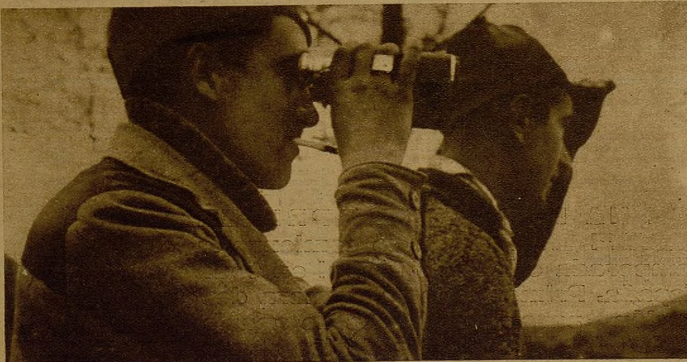
Gelpe de mano de los mineros y los vascos en una loma del Naranco. Mientras llega el momento de reanudar la ofensiva, los soldados recios de Asturias mejoran sus posiciones. Estos oficiales contemplan la marcha de las operaciones. Dos mil cadáveres enemigos cubren—después de los combates interminables—la falda del monte de Pando...

En Oviedo, desde los primeros días de nuestra ofensiva, es muy difícil entrar refuerzos en gran cantidad. La posesión por nuestras fuerzas de las lomas de Pando, del monte de la Verruga, y del Cristo y el Fresno por la parte oriental nos aseguran un bloqueo casi absoluto. Únicamente de noche podrán pasar a los de Oviedo algunos hombres formados en pequeños grupos y unos cuantos mulos de viveres y municiones. Pero es que nuestros frentes se extienden muchos kilómetros por Grullas, Bayo y El Escamplero, y allí, naturalmente, si pueden llegar los refuerzos. Actualmente se está contien-