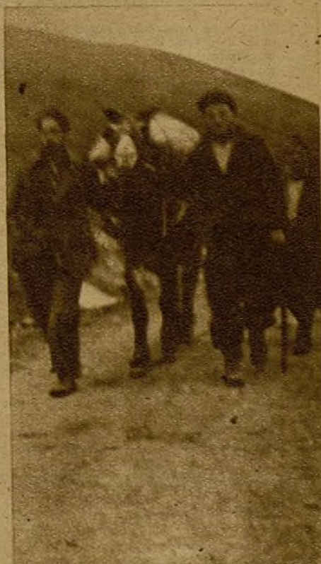
Comida y ropa para las avanzadillas. Estos muleros de Lugones recorren los caminos de Asturias—las pequeñas sendas de cabras, a los que ellos llaman "calellas"—a través de la bruma y el temporal