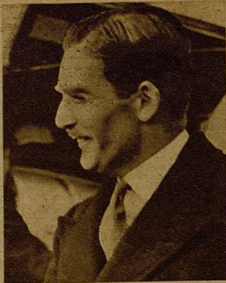
Mr. Antoni Eden, el ágil ministro de Relaciones Exteriores de la Gran Bretaña, que se sonríe de la fanfarronada del "signore" Grandi