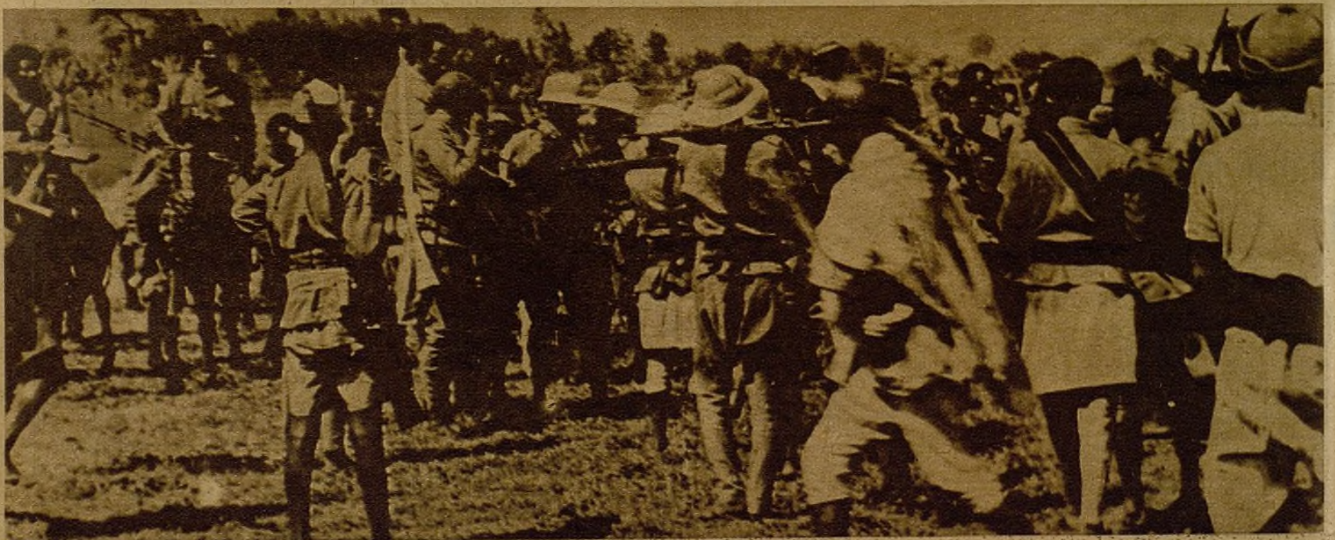
Aun quedan guerrilleros en Abisinia. La traición de unos jefes a su pueblo no ha acabado ni acabará con el heroísmo de un pueblo, que no quiere ser feudo del fascismo. De nada sirven las espectaculares paradas y los desfiles del Ejército italiano en Addis-Abeba. La vida en el interior del país es poco menos que imposible para los esclavos de Mussolini