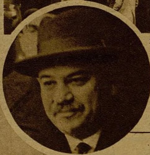
El camarada Maiski, delegado de la U. R. S. S. en el Comité de no intervención, que respondió adecuadamente a las palabras irresponsables de Grandi