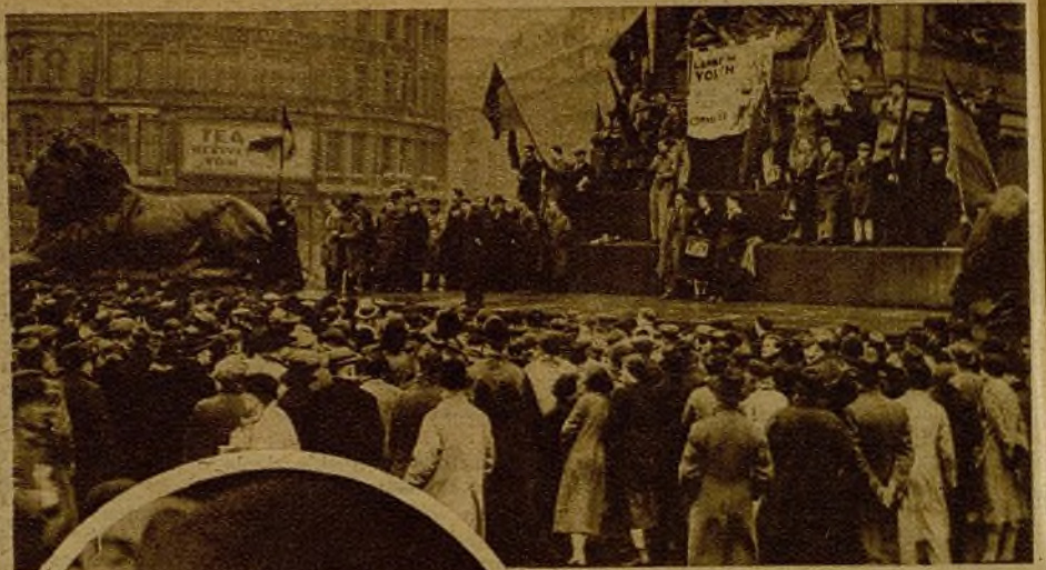
La juventud inglesa está al lado de la juventud española por la paz y contra el fascismo. En una manifestación espontánea celebrada en las calles de Londres, se acordó recaudar fondos para Madrid