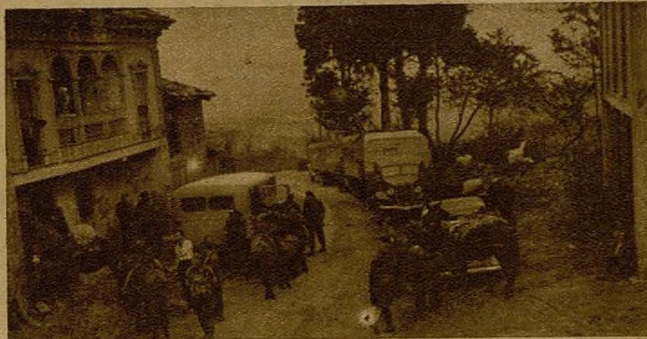
Casas antiguas de Asturias, con balcones de Arcos, pueblos campesinos de la ruta inexorable hacia adelante, caminos de castaños y robles que llevan a Oviedo... Un convoy del Ejército del pueblo se dispone a salir hacia el frente de Grullas...

En Asturias ha nacido un Ejército. "Mientras llega la hora del ataque conquistamos nuevas posiciones".— Los refuerzos, el contraataque de los seis días y los muertos del Monte Pando