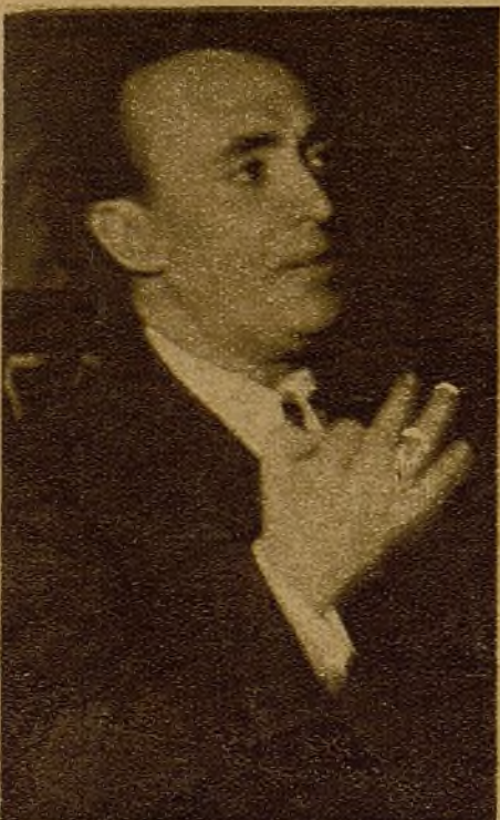
Miguel San Andrés, diputado a Cortes por Valencia, hablando en el acto del Pardiñas