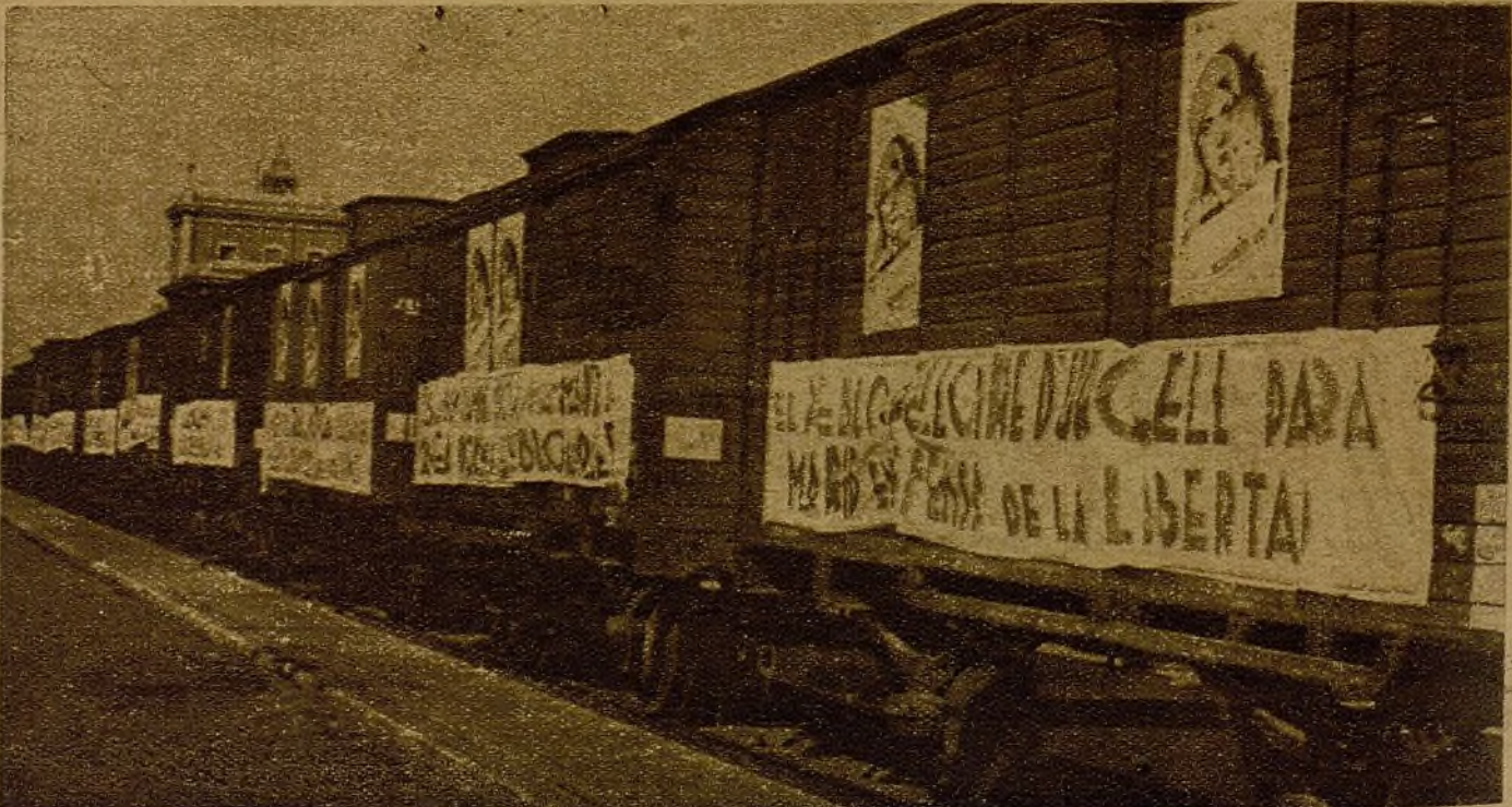
Es emocionante la solidaridad de toda la España leal con el heroico pueblo madrileño. Como éste, con las mismas inscripciones de aliento, han salido de Cataluña varios trenes de víveres para Madrid