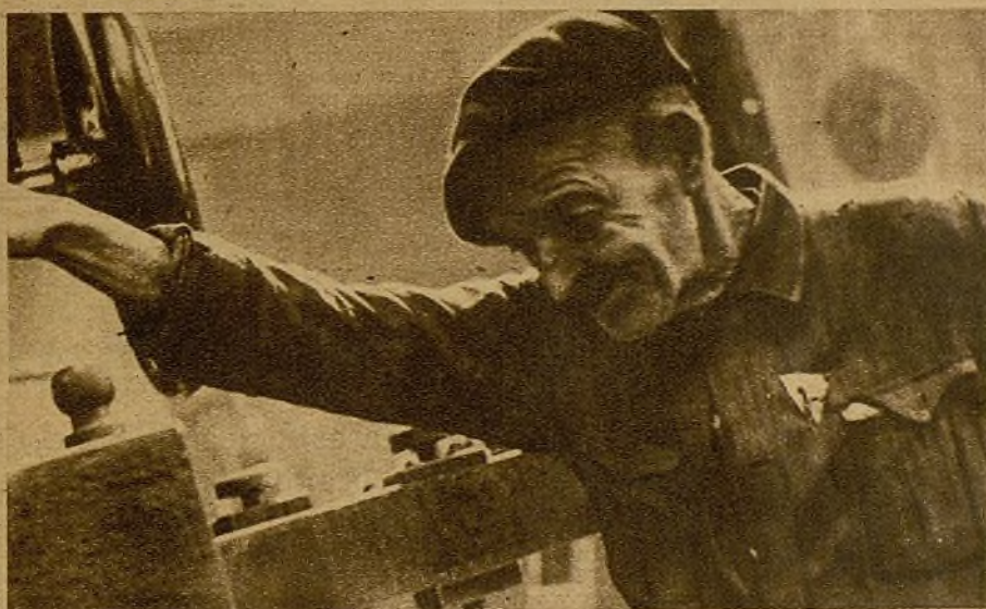
Este obrero, veterano glorioso de las máquinas, viejo combatiente de la lucha dura del trabajo, está orgulloso del trabajo de emulación que la juventud realiza desde las Brigadas de choque. Sobre su pecho lleva—como un deseo y un homenaje—la insignia de la Alianza Nacional de la Juventud...