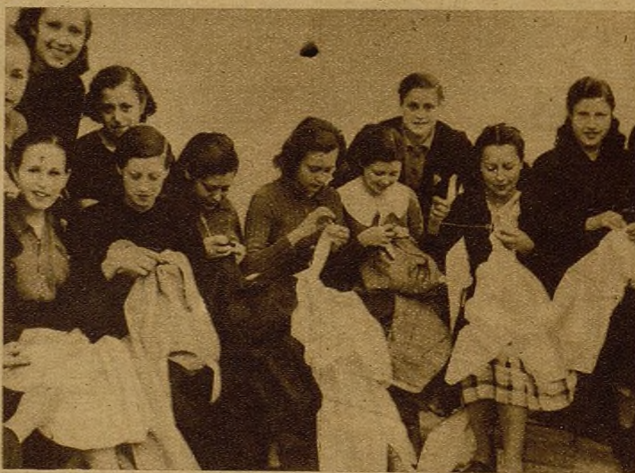
"Nosotras, obreras de las brigadas de choque, nos sentimos orgullosas de trabajar incansablemente, con la bandera de la Alianza nacional de la juventud, por la independencia de nuestra patria."