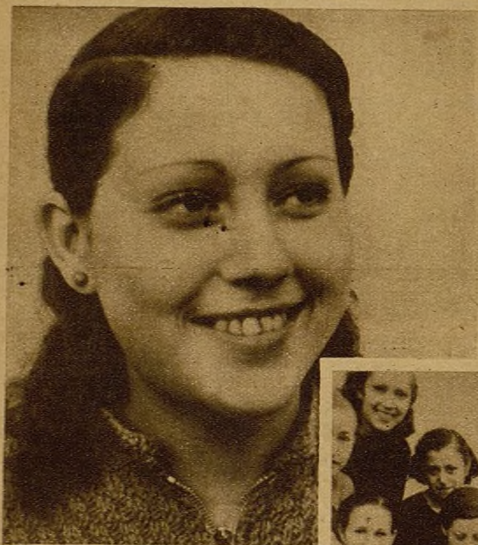
"Yo, hermana de dos combatientes, quiero, como mis hermanos, que todos los jóvenes luchemos y trabajemos firmemente unidos."