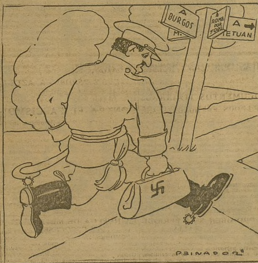
"El judío errante" (capítulo primero).

El cónsul británico manifestó que dicho bombardeo, por su intensidad, no podía compararse con los que vió en la guerra europea.—Febus.