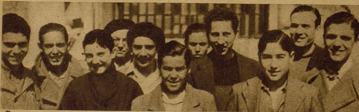
"Nosotros, hermanos menores de los héroes del trabajo y de las trincheras, vemos en la Alianza nacional de la juventud la garantía de un porvenir libre y feliz. Saludamos al Congreso-Alianza de la juventud madrileña en espera que de sus resoluciones salga invencible la bandera de la unidad juvenil."