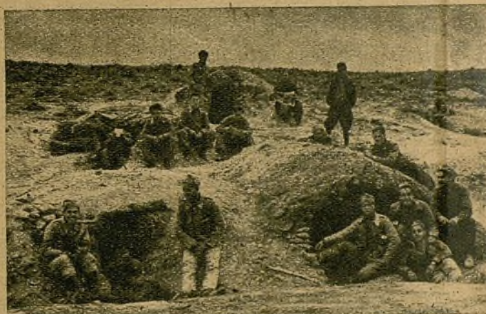
Camilleros de Levante. Heroes de las batallas frente a La Marañosa. Los hombres de las ambulancias de la 19 Brigada se estrenaron en la guerra evacuando heridos a lo largo de ocho kilómetros de camino, en los que el barro subía hasta los muslos y las ametralladoras "negras" buscaban el blanco de las camillas