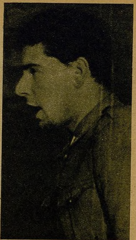
Jiménez Carrasco, ejemplo de jóvenes en los que la guerra ha descubierto unas excepcionales dotes militares, glorioso forjador del veterano batallón Joven Guardia y actualmente comandante jefe de operaciones del primer Cuerpo de Ejército, saluda al Congreso de los jóvenes de Madrid. La figura de este comandante es una demostración viva de la capacidad de la juventud para alcanzar los más altos puestos de nuestro Ejército