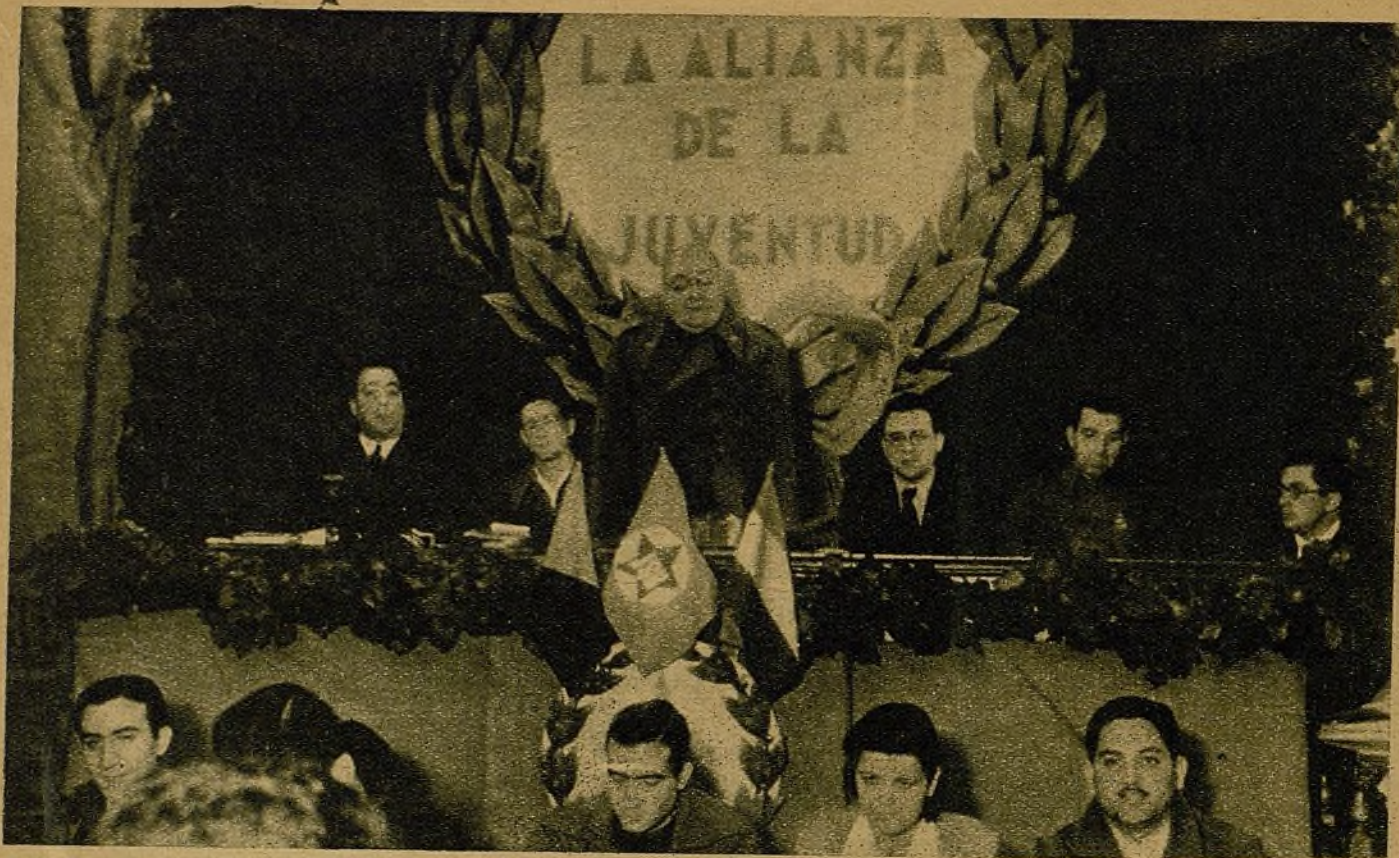
El general Miaja, presidente de la Junta Delegada de Defensa de Madrid, ejemplo de firmeza y heroísmo en la defensa de nuestra querida ciudad, que ha dirigido cariñosas frases de aliento y admiración a la juventud madrileña en su intervención inaugural del gran Congreso-Alianza de la Juventud Madrileña