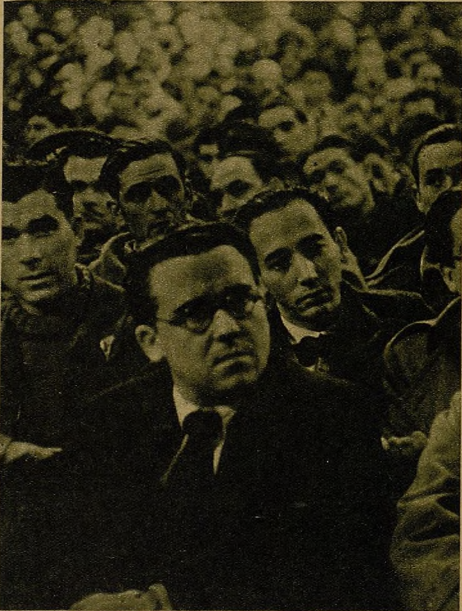
El secretario general de las Juventudes Socialistas Unificadas, gran forjador de la unidad juvenil, a quien los congresistas tributaron una ovación al advertir su presencia en la sala