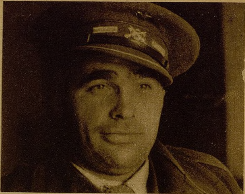
Enrique Lister, el de Guadalajara, que levantó con su presencia una de las mayores ovaciones del Congreso-Alianza