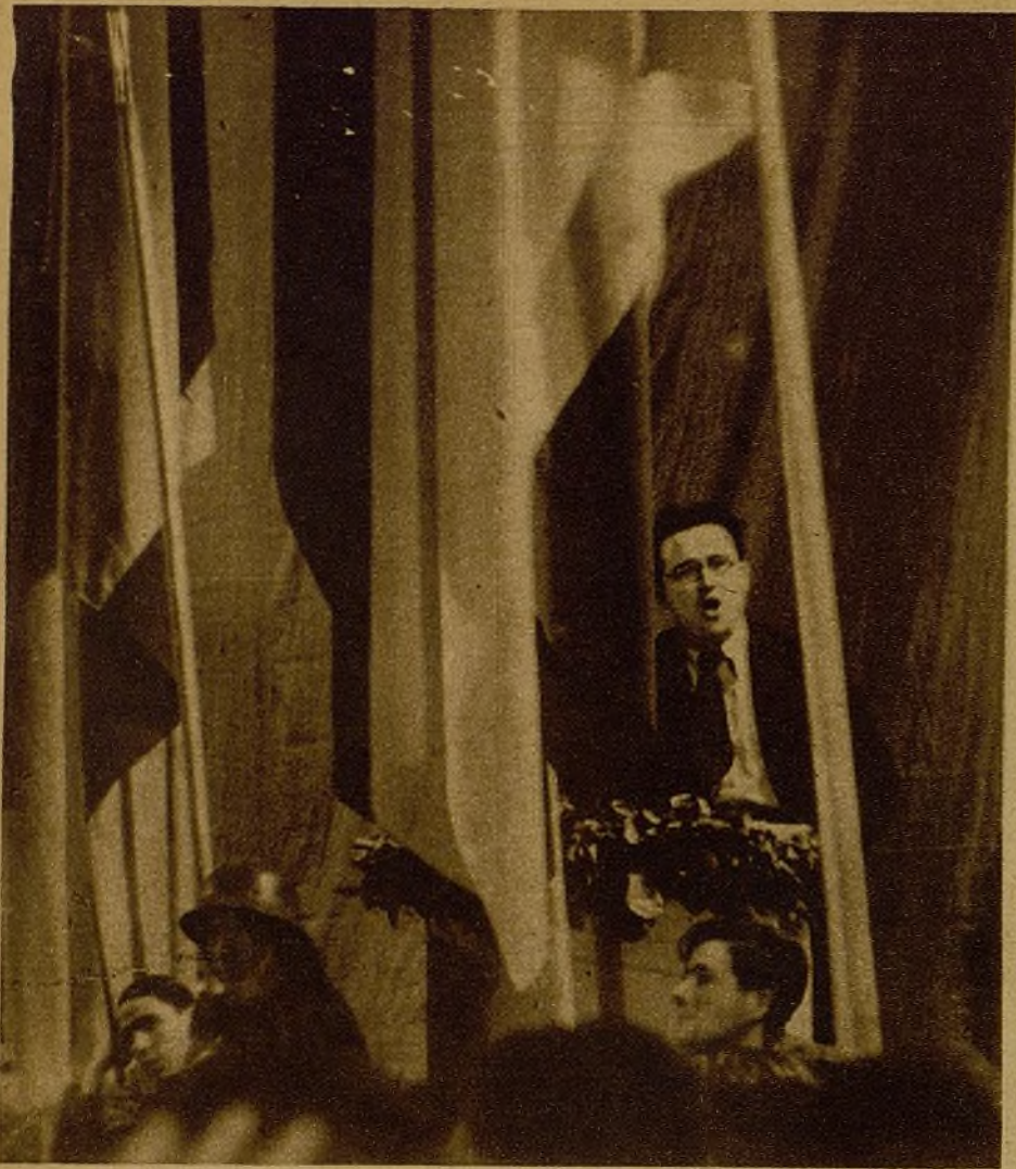
Santiago Carrillo, secretario general de la Comisión Ejecutiva Nacional de la J. S. U., que saludó a la juventud de Madrid como la juventud que mejor ha cumplido las consignas de la victoria, trazadas en la Conferencia Nacional de Valencia