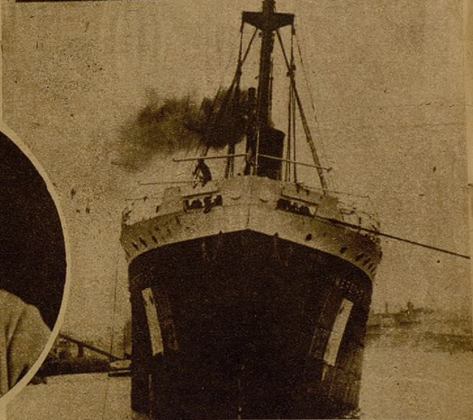
El vapor francés "Imerethie", que por la firmeza de su comandante logró escapar a las garras del buque pirata "Canarias". La foto del barco y del comandante está hecha al llegar a Marsella