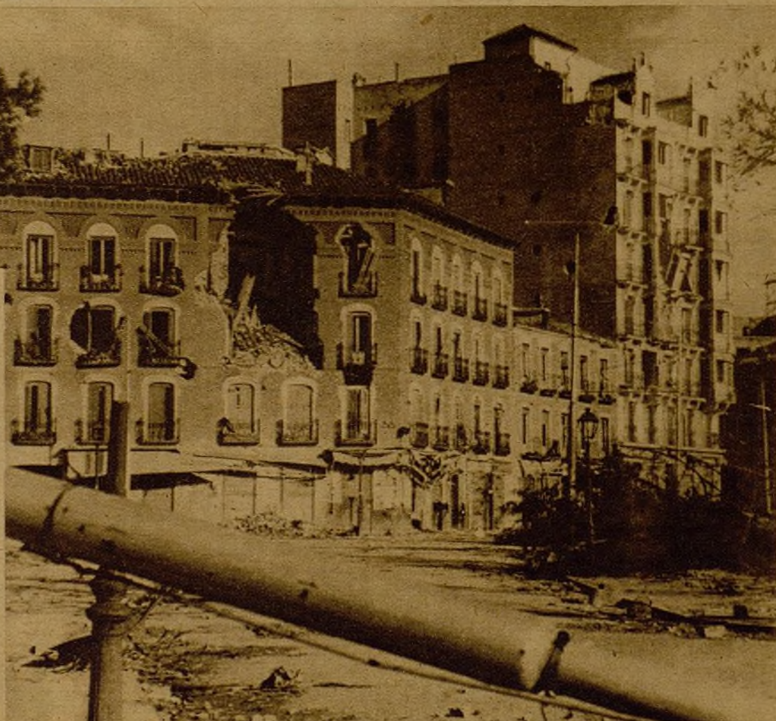
Moncloa.—El fascismo no ha conseguido pisar las calles de Madrid. Ante la barrera que el pueblo español formó a las puertas de su querida capital se estrelló la rabia y la impotencia del fascismo. De su salvajismo da una buena prueba esta foto: las casas de Madrid son un magnífico objetivo "militar" para los artilleros y aviadores fascistas