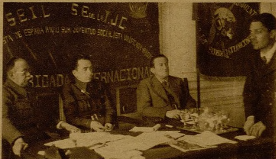
Los comisarios políticos han celebrado una reunión en la que se les ha informado de la celebrada en Albacete el día 2 de abril, bajo la presidencia del comisario general de Guerra, camarada Alvarez del Vayo