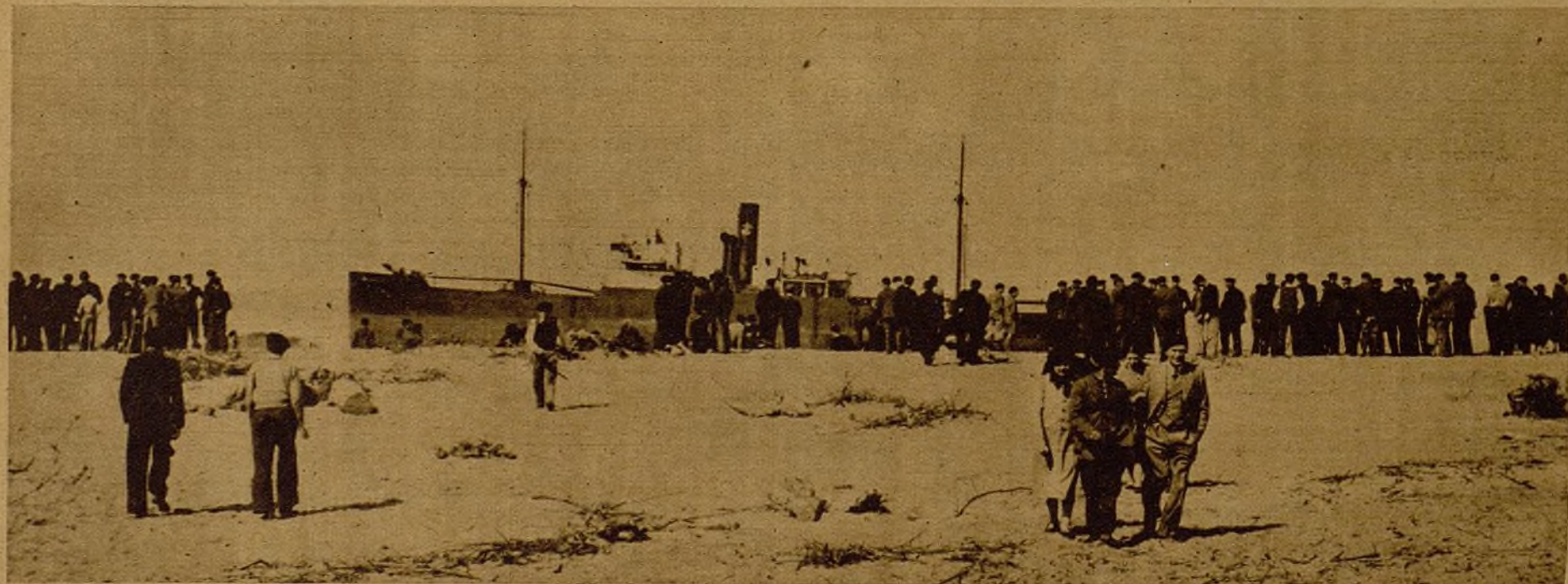
El vapor "Cristina", que llegó a Bilbao a pesar de los cañones que contra él dispararon los piratas del Cantábrico