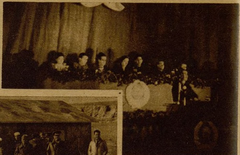
La Presidencia de la Conferencia Provincial del Partido Comunista de Madrid