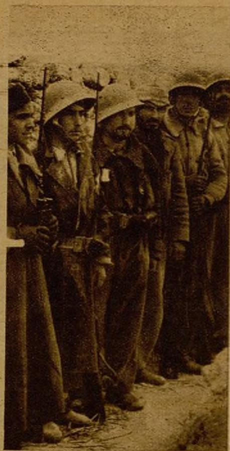
Ayer, los italianos en Guadalajara. Hoy, los moros y los alemanes en Madrid tienen pruebas "contundentes" del valor y del heroísmo de los soldados del Ejército popular. Estos muchachos esperan tranquilos en su trinchera las órdenes del Estado Mayor