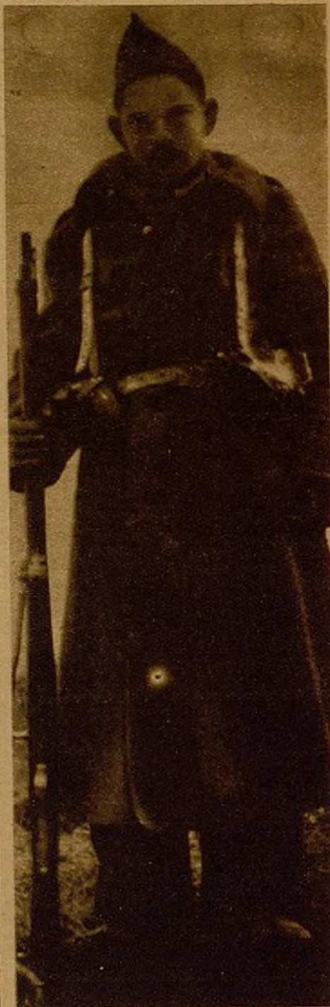
Mozo asturiano de las trincheras de Grado. Su tradición de pastor convierte el fusil en cayado. ¡Buen cayado de pólvora para correr la "romería" de Oviedo!