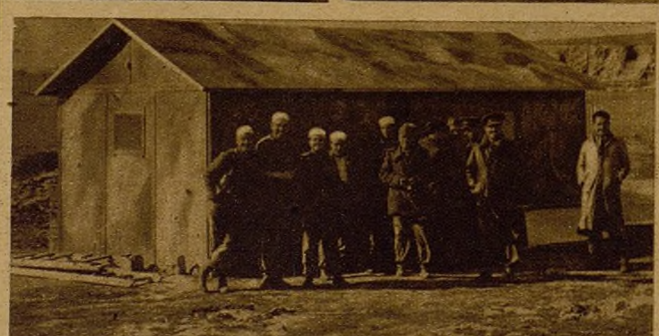
Esa casa, aunque parece de muñecas, es nada menos que un magnífico quirófano ambulante. Su material, cuidadosamente escogido y cuidado, es una garantía para los heridos del Ejército del pueblo