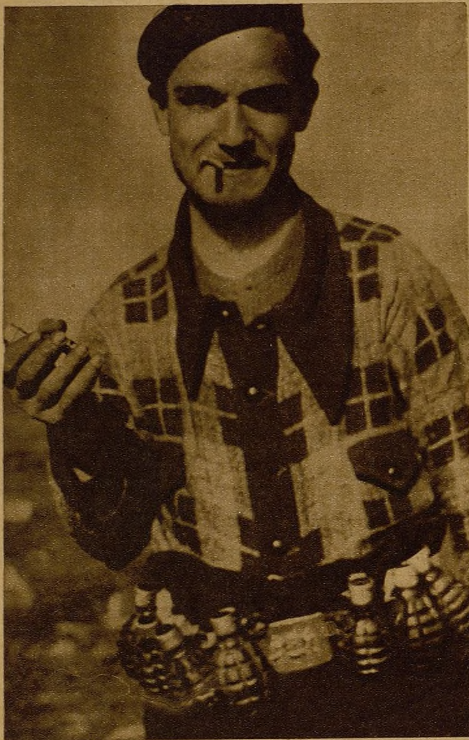
Joven santanderino, dinamitero del frente de Grado. Moros y alemanes conocen bien sus bombas