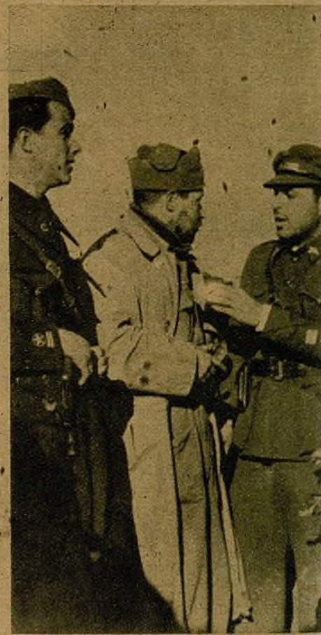
Camaradas del segundo Batallón de la 5.ª Brigada de Carabineros, que han recaudado para su periódico—AHORA—530 pesetas