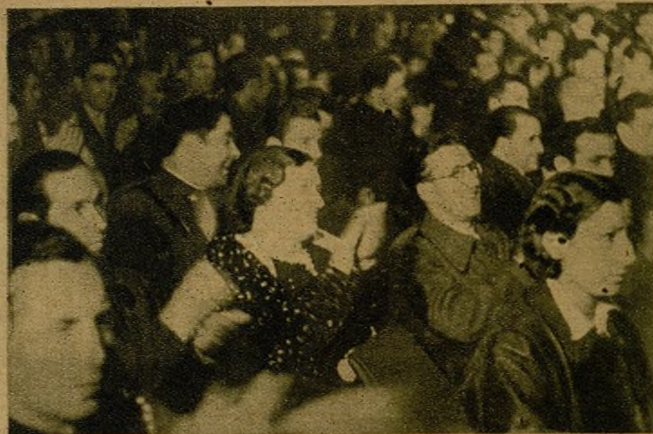
Una vista del salón de fiestas del Círculo de Bellas Artes, donde se está celebrando la Conferencia Provincial del Partido Comunista. Los delegados siguen con gran atención las intervenciones de los miembros destacados del glorioso Partido.