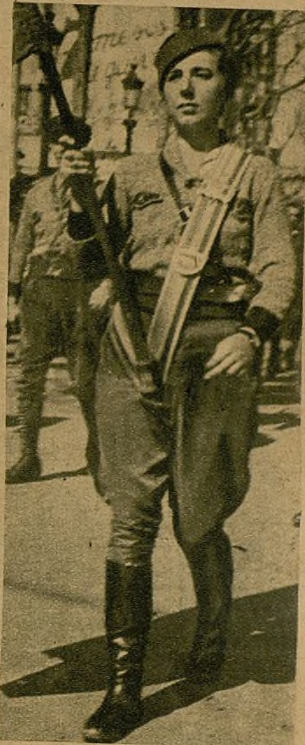
Guapa, sana y decidida, esta muchacha barcelonesa lleva con orgullo la bandera de una de las brigadas de reserva

Las menos decididas han tomado un camino y acuden diariamente a los pa-