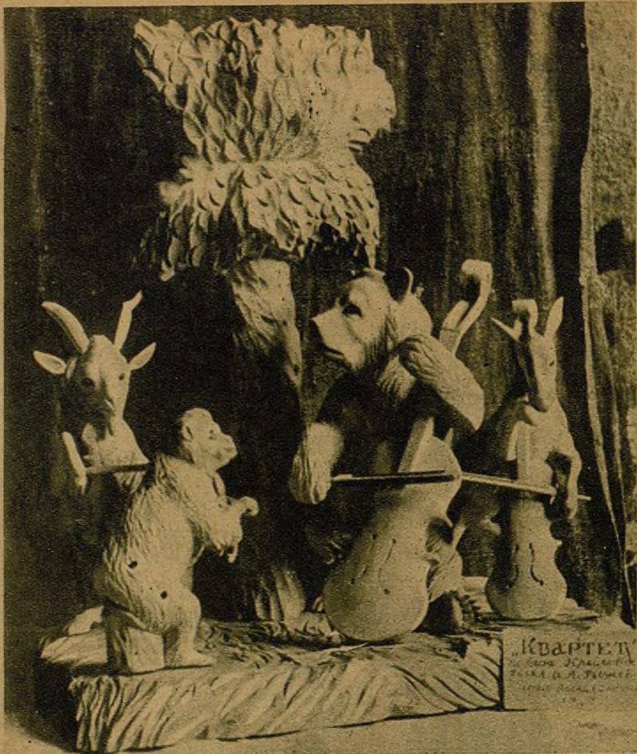
El pueblo ruso, libre de opresión, feliz en el régimen socialista, es un pueblo creador. Esta foto demuestra el espíritu de creación de los campesinos rusos. Es una demostración de que el sentido artístico y creador del pueblo se revela en los regímenes justos. Mientras, en tierras de Alemania y de Italia obreros y campesinos mueren de hambre en los campos de concentración o son enviados, como carne de cañón, a las guerras coloniales.