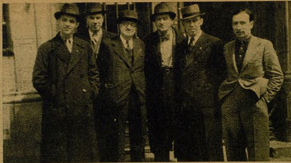
Una Delegación del Socorro Rojo Internacional, que ha visitado la España leal. Los miembros de la Delegación han sido recibidos con sincero cariño por el pueblo español, que sabe—pues tiene pruebas palpables—de la gran ayuda que el Socorro Rojo le ha prestado en los momentos más difíciles de la lucha.