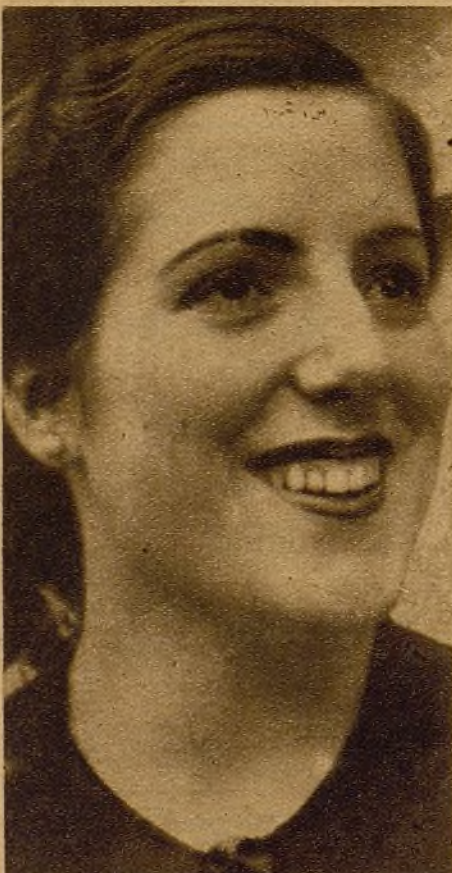
Esta muchacha comprende que en la retaguardia hay que trabajar intensamente para ganar la guerra. Por eso ella forma parte de la brigada de choque de su taller.