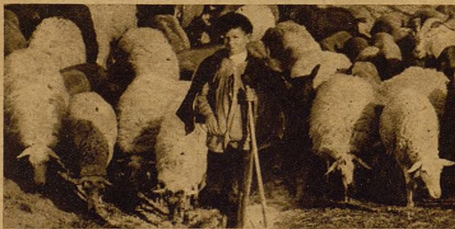
Aunque este pastor, con su manada, no procede del extranjero, publicamos su fotografía, porque quienes hicieron que sus padres y sus hermanos dejaran la labranza y fueran a las trincheras sí que son extranjeros. Se llaman Hitler y Mussolini. Y algunos otros nombres más, en apariencia amigos