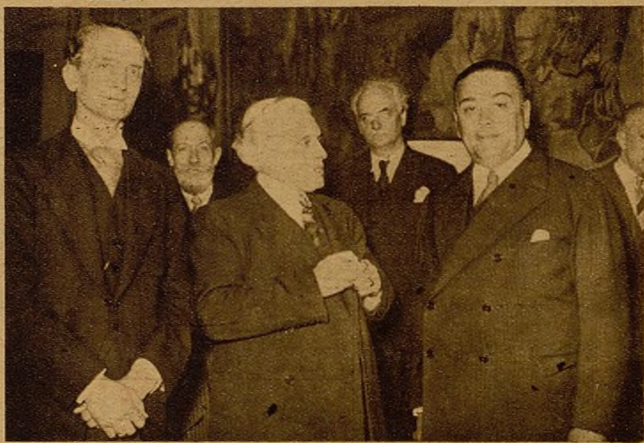
El presidente del Congreso de Diputados, señor Martínez Barrio, en compañía del presidente de la Cámara belga, M. Huysmans, y de M. Paul Boncour, durante la estancia en París de nuestro presidente parlamentario