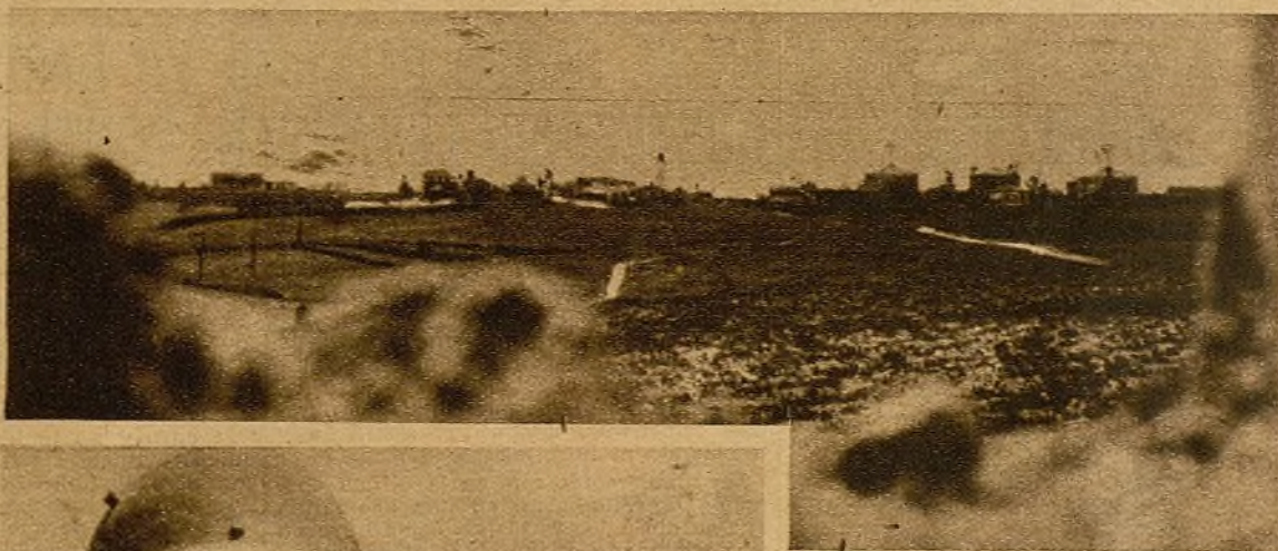
Frente a frente, cara a nuestras trincheras, está la línea de casas de Las Rozas. Aquí venía el viejo Lerroux a emborracharse, hace tres años...