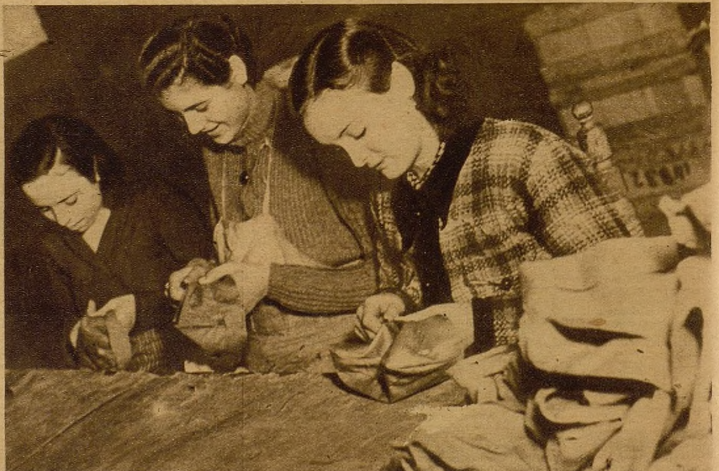
Las manos de estas muchachas trabajan incansablemente y con seguridad. Unos extraños trozos de piel saben convertirlos en magníficos gorros para los camaradas del frente. Están contentas, pues saben que con su trabajo contribuyen al enorme montón de gorros (1.500) que diariamente salen de su taller.