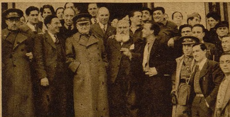
La Delegación del Socorro Rojo Internacional con el general Maíja, el coronel Rojo, el teniente coronel Ortega y varias personalidades políticas y militares, que expresaron a los delegados el agradecimiento del pueblo español a la organización del Socorro Rojo Internacional