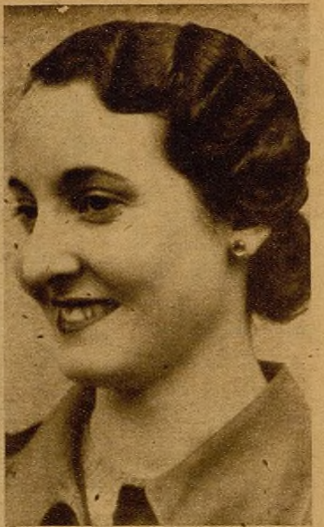
Esta muchacha vive y trabaja para ganar la guerra. Los que han dado todo para defender la causa justa del pueblo son dignos de que hagamos por ellos los más duros sacrificios; cuando el exceso de trabajo empieza a cansarnos, el recuerdo de los que están en las trincheras nos anima.