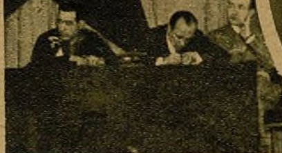
La 4 Brigada organizó un brillante homenaje a la U. R. S. S. y a Méjico, los dos pueblos amigos de España