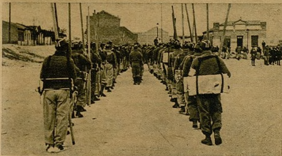
El segundo batallón de andaluces de la Brigada 36 desfila marcialmente, luciendo sus flamantes equipos