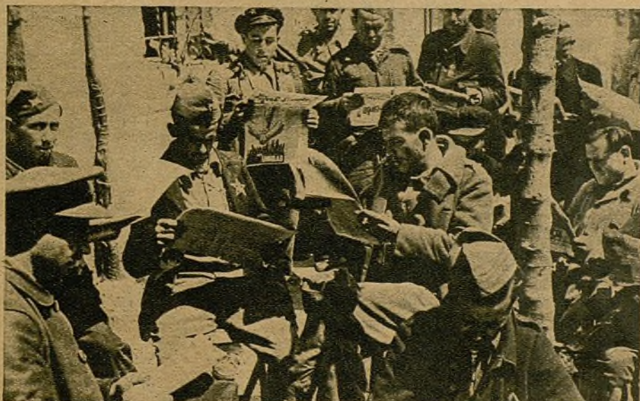
En los "Rincones Rojos" de la trinchera, los soldados leen y comentan las noticias de Prensa