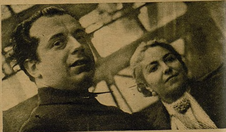
El poeta Rafael Alberti y la escritora María Teresa León, en Madrid, a su regreso de la U. R. R. S., que hacen en este número interesantes declaraciones sobre su viaje