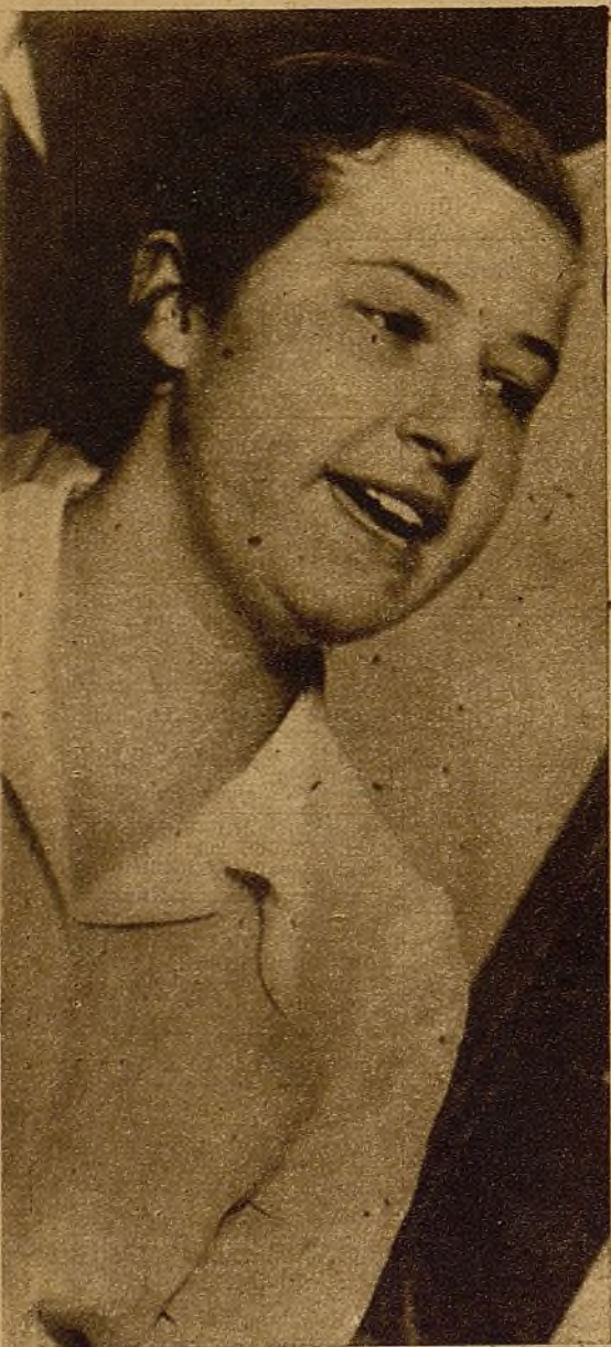
Esta muchacha, destacada militante del sector Oeste de la Juventud Socialista Unificada, se dirige a sus compañeras en la asamblea últimamente celebrada por la Sección Femenina del mismo