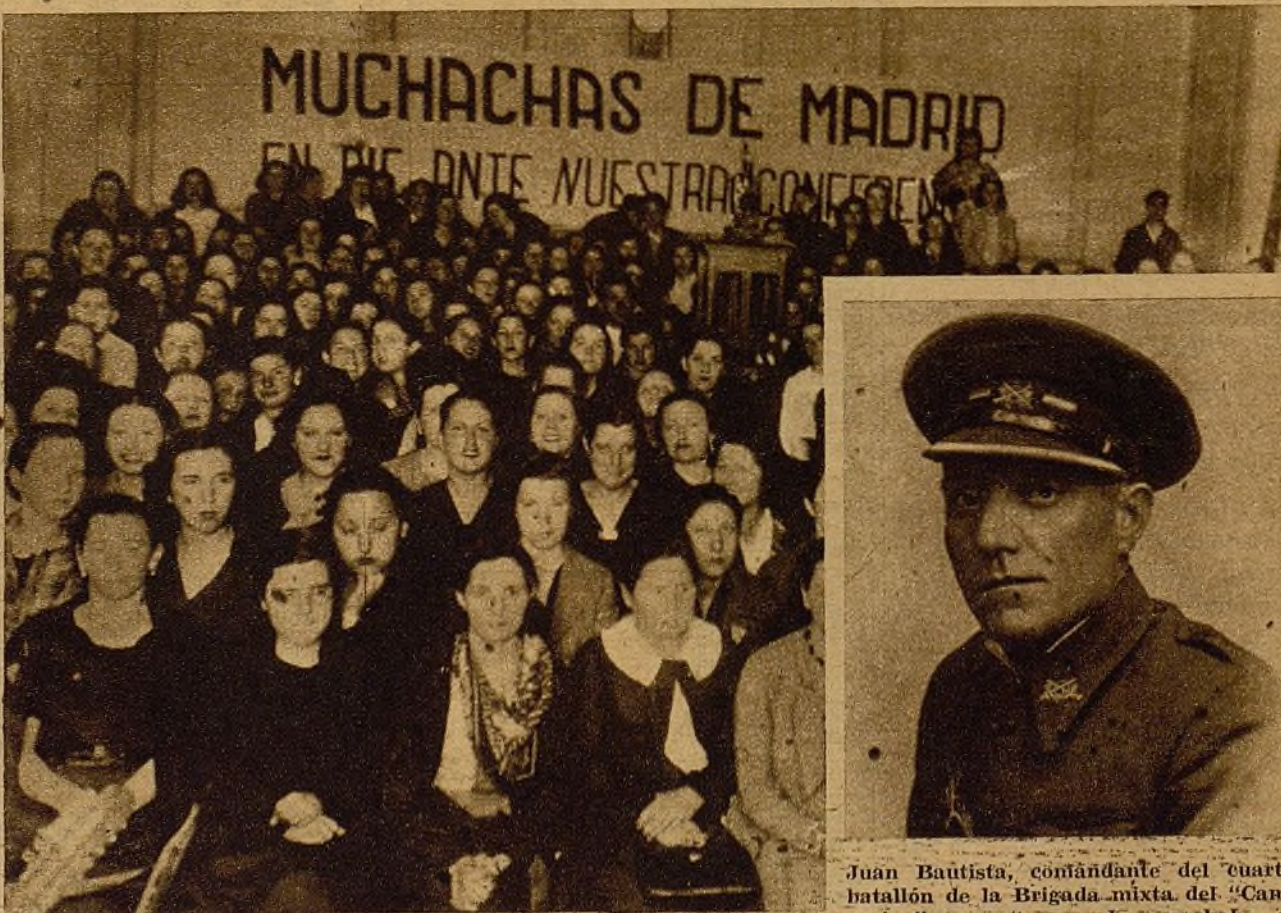
Las Secciones femeninas de los sectores de la J. S. U. de Madrid están celebrando sus asambleas, preparatorias de la Gran Conferencia de Muchachas que va a celebrarse próximamente en Madrid. Una vista del local donde celebran su asamblea las muchachas del sector Oeste