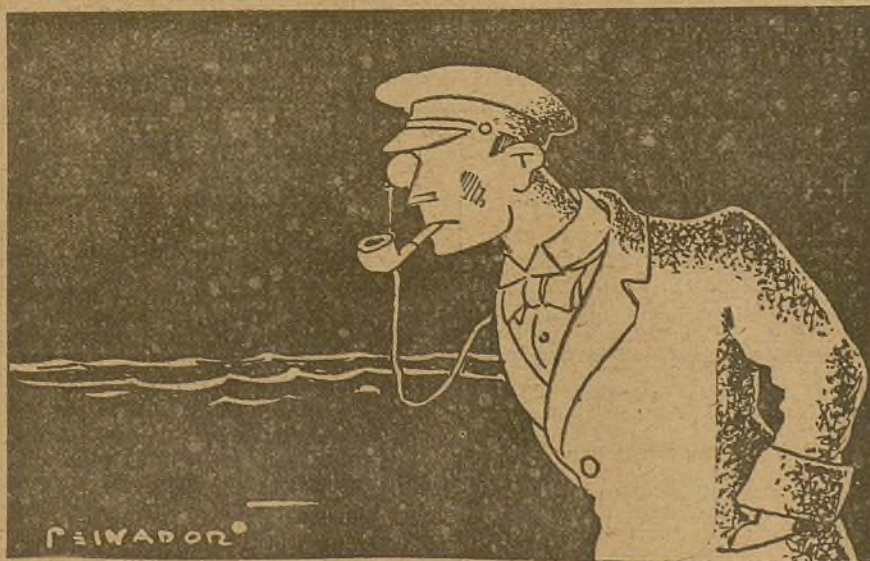
—Como el control ha empezado de noche, todavía no se ha visto nada claro...

Durante la noche última, la Aviación enemiga voló sobre Alcalá de Henares, lanzando algunas bombas, que produjeron algunos heridos, pero sin que lograrse los objetivos que se proponía, ya que no produjeron daños materiales.