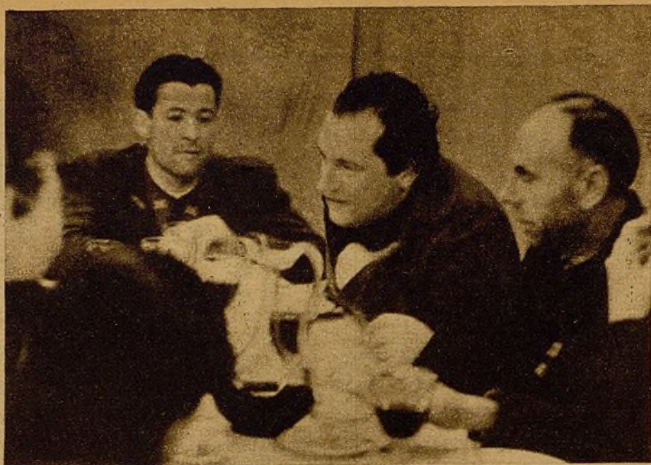
En el homenaje al general Miaja. De izquierda a derecha, el glorioso comandante Modesto, jefe de División; Rafael Alberti, poeta del pueblo y de la guerra; Ortega, el heroico jefe militar