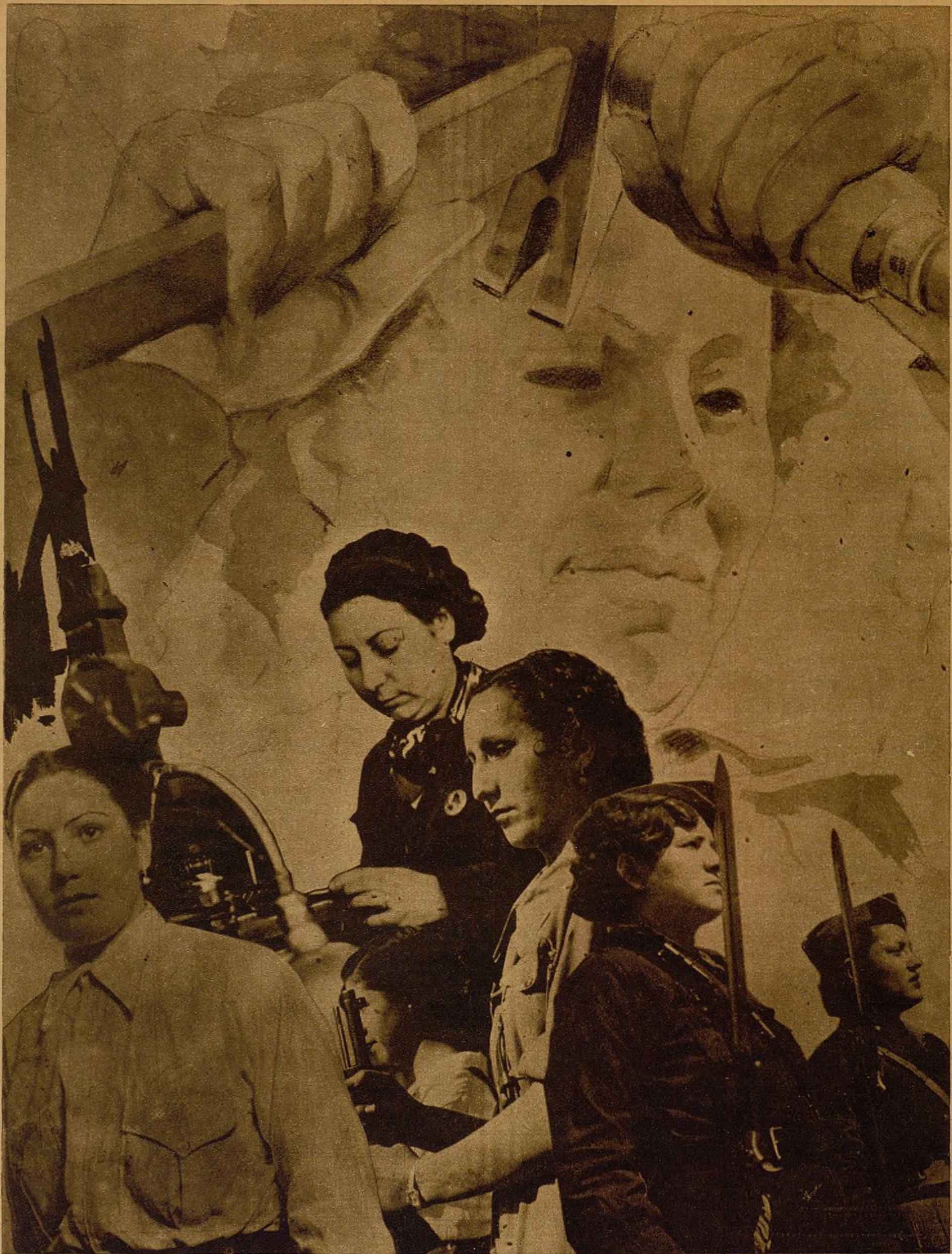
LAS MUCHACHAS MADRILEÑAS PREPARAN SU GRAN CONFERENCIA PARA EL PROXIMO MAYO. TODAS LAS JOVENES QUE TRABAJAN PARA LOGRAR EL TRIUNFO DEBEN PRESTAR SU COLABORACION A ESTE GRAN CONGRESO